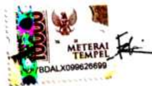
Faulina AI Muhtaramah

Banjarbaru, 27 Juni 2024 Yang Membuat Pernyataan,