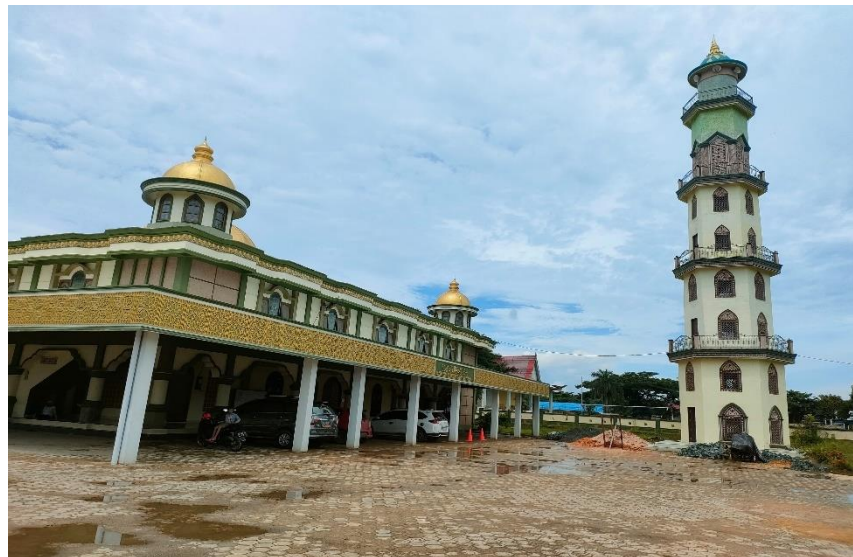
Gambar 4.5 Teras dan Menara Pengeras Suara Masjid

menara pengeras suara masjid, yang mana ini adalah hasil saran dan masukan dari masyarakat.