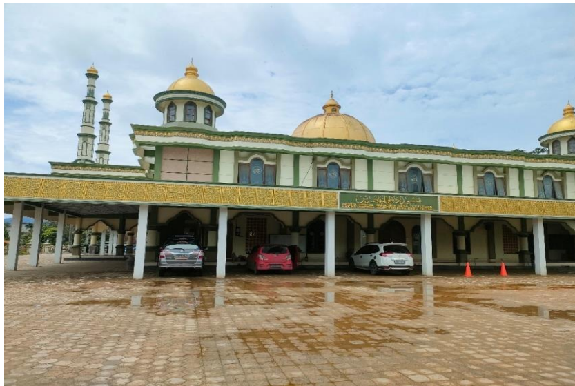
Gambar 4. 1 Masjid Jami Al-Muhajirin