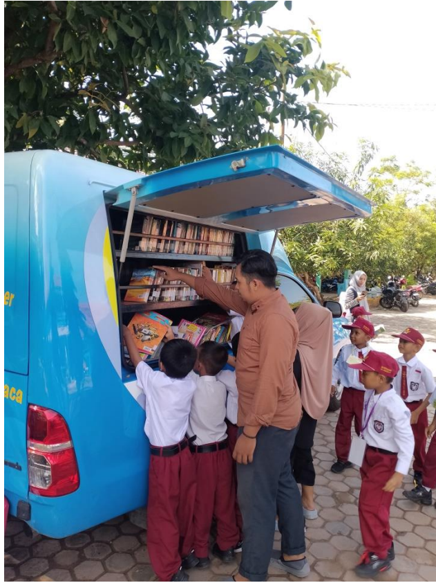
Gambar 2 Observasi Lapangan