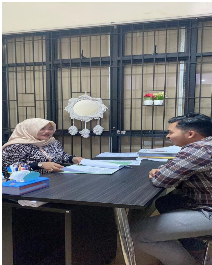
Gambar 1 Wawancara dengan Pustakawan