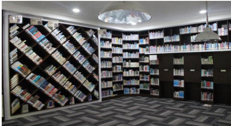
Gambar 4.7 Ruang Referensi