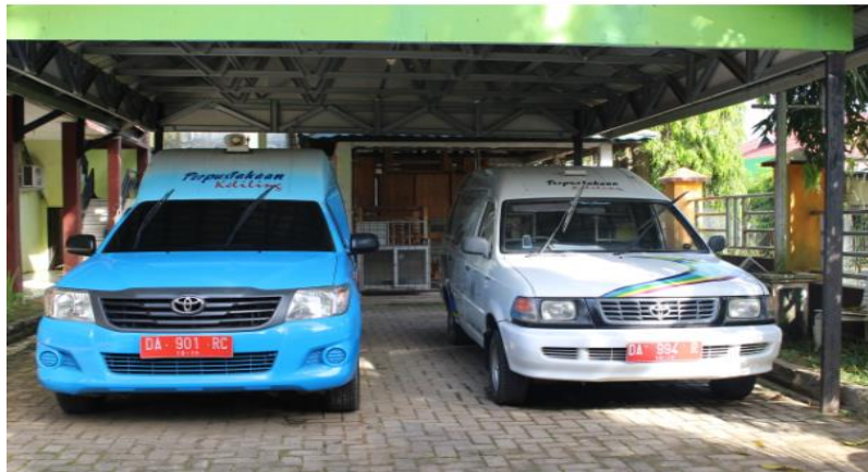
Gambar 4.10 Perpustakaan Keliling

Perpustakaan keliling adalah layanan perpustakaan umum yang bergerak dari suatu tempat ketempat lain dengan menggunakan kendaraan darat, air dan udara. Perpustakaan keliling biasanya dilaksanakan untuk melayani daerah-daerah jauh dan terpencil. Kendaraan yang digunakan bervariasi, dari kendaraan bis, gerobak, sepeda motor sampai kapal laut dan kapal terbang. Pada dasarnya perpustakaan keliling bukan merupakan satu jenis perpustakaan tersendiri. Perpustakaan keliling merupakan jenis layanan yang dikembangkan (ekstensi) pada perpustakaan umum, yang disebut layanan Perpustakaan Keliling. 9