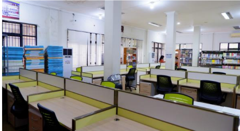
Gambar 4.5 Ruang Baca Umum