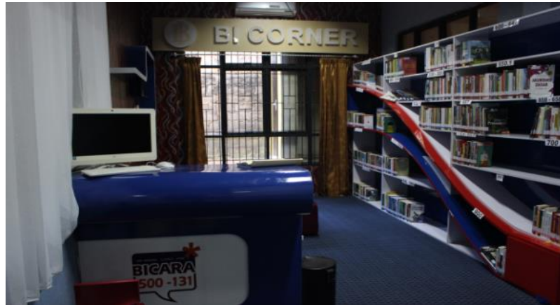
Gambar 4.6 BI Corner