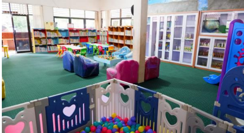
Gambar 4.4 Ruang Baca Anak

yang sesuai dengan karakteristik anak (seperti elemen warna dan elemen pendukung). 4