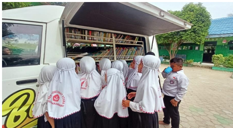
Gambar 4.12 Kunjungan ke SDN 2 Loktabat Utara