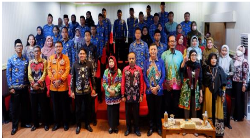
Gambar 4.8 Studio Mini

Studio mini di Dinas Arsip dan Perpustakaan Daerah Kota Banjarbaru merupakan tempat dimana kita bisa menonton film secara gratis dengan syarat harus daftar dahulu menjadi anggota perpustakaan. Studio mini ini terbuka untuk semua kalangan dan kebanyakan yang nonton adalah anak-anak sekolah dasar (SD). Lalu, film yang ditayangkan di studio mini ini adalah film edukasi dan film sejarah, film tersebut dapat berbentuk film animasi ataupun non animasi.