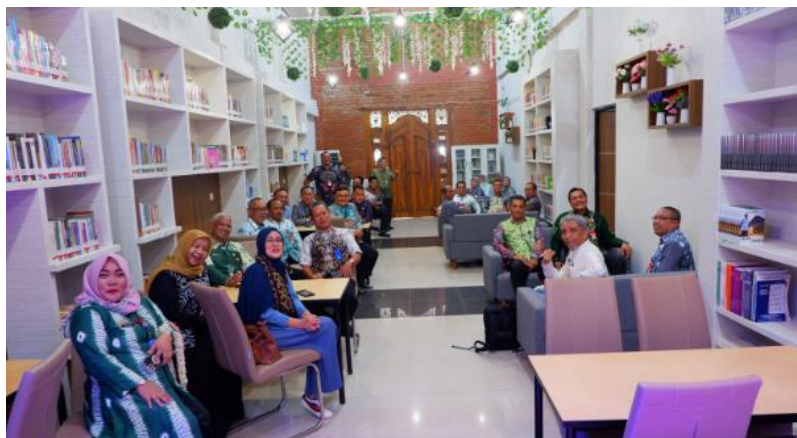
Gambar 4.9 Cafe Literasi Waka7

Literasi pada dasarnya adalah kemampuan seseorang dalam keterampilan membaca dan menulis. Diantara manfaatnya adalah membantu pengembangan pemikiran dan menjernihkan cara berfikir, meningkatkan pengetahuan, meningkatkan memori dan pemahaman. 8 Oleh karena itu, dengan adanya cafe literasi dapat membuat kita semakin berliterasi, baik sumber literasi itu dari buku atau obrolan-obrolan, baik secara digital atau non digital.