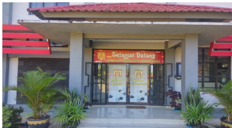
Gambar 4.3 Depo Arsip

Depo arsip merupakan tempat dimana arsip-arsip disimpan, gedung yang menjadi tempat penyimpanan arsip telah dirancang dengan struktur khusus, alasannya adalah untuk memenuhi kebutuhan terhadap perlindungan arsip, serta untuk menunjang tugas utamanya, yaitu melakukan pemeliharaan dan perawatan arsip.