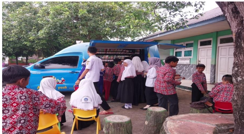
Gambar 4.11 Kunjungan ke SDN 1 Loktabat Utara

Perpustakaan keliling juga terbantu dengan antusias dan respon dari masyarakat dan lembaga pendidikan, karena dengan bantuan mereka dapat membuat perpustakaan keliling tetap aktif sampai sekarang. Dengan adanya kunjungan perpustakaan keliling ke sekolah-sekolah, para murid disana akan merasa senang dan secara perlahan akan timbul minat baca mereka terhadap buku.