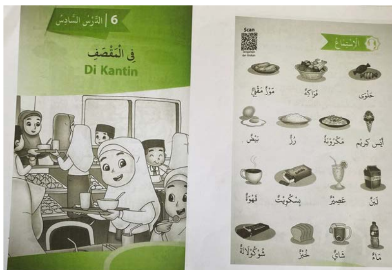
Gambar 4.1 Materi Pembelajaran Bahasa Arab

Guru memulai proses belajar mengajar dengan mengajukan pertanyaan kepada para siswa, pertanyaannya seperti “apa pelajaran kita sekarang?” menggunakan bahasa Arab, pertanyaan tersebut digunakan agar dapat membantu mengarahkan perhatian para siswa, dan guru menyampaikan tujuan pembelajaran. Materi pembelajaran yang diajarkan oleh guru bahasa Arab pada 16 Januari 2024 dan 23 Januari 2024 dapat dilihat pada Gambar 4.1 sebagai berikut: