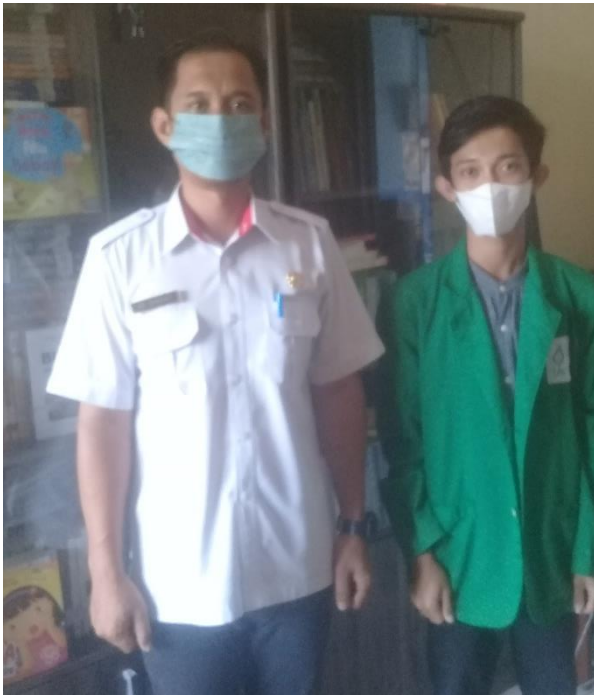
Gambar 2.2 Foto Bersama Pustakawan Dinas Perpustakaan dan Kearsipan Kabupaten Barito Selatan.