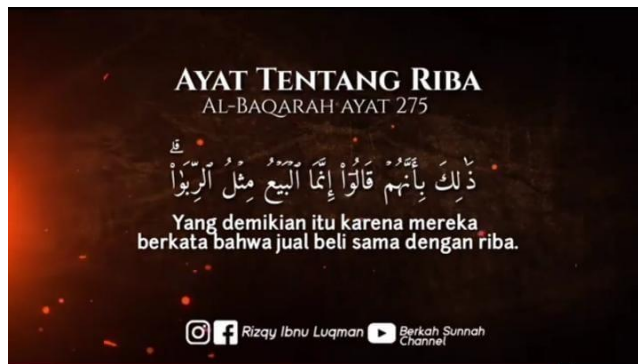
Gambar 4. 2 Screen Shot Ayat al-Qur'an pada Video Pembelajaran

aritmetika sosial yang digunakan dalam kehidupan sehari-hari serta menampilkan ayat al-Qur'an yang relevan.