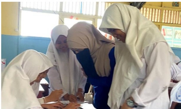
Gambar 4. 3 Interaksi Guru dan Siswa pada Pembelajaran

Selanjutnya, kelompok siswa yang memiliki gaya belajar visual dan auditori disajikan materi aritmetika sosial yang termuat di dalam video pembelajaran maupun teks langsung yang terdapat pada LKPD. Berbeda dengan kelompok siswa dengan gaya belajar audio dan visual, kelompok kinestetik melakukan kegiatan bermain peran terkait materi pelajaran dengan mengikuti petunjuk pada LKPD. Guru memberikan arahan dan bantuan dalam proses siswa memahami materi pelajaran.