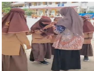
Gambar 4.2 Salam Bersalaman

Pengembangan budaya religius yang dilakukan di SDIT Ukuwah yaitu mengucapkan salam dan bersalaman rutin dilakukan oleh siswa setiap pagi datang sekolah yang disambut oleh ustadz dan ustadzah. Sebagaimana wawancara dengan