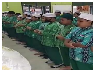
Gambar 4.3 Sholat Dzuhur Berjamaah

Semua guru dan siswa kelas 3, 4, 5, dan 6 melaksanakan sholat dzuhur dan ashar berjamaah di masjid sekolah. Pelaksanaan sholat dzuhur dan ashar berjamaah