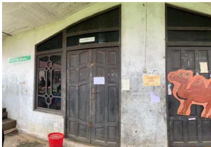
Gambar 4. 8 Asrama Maimunah dan Zainab

Asrama Fatimah memiliki 3 kamar, di mana masing-masing kamar dapat menampung antara 33 hingga 35 santriwati. Selain itu, terdapat 4 pengurus asrama yang bertanggung jawab untuk mengkoordinir dan mengawasi kegiatan santriwati di Asrama Fatimah. 7