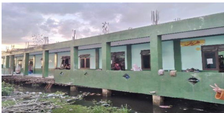
Gambar 4. 10 Asrama Maryam

Asrama Hafsah terdiri dari 10 kamar, dimana setiap kamar menampung 8 santriwati. Salah satu kamar dihuni oleh 5 pengurus asrama yang berbaur dengan 3 santriwati. Mereka bertanggung jawab atas koordinasi dan pengawasan aktivitas santriwati di Asrama Hafsah. 9