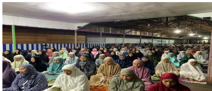
Gambar 4. 20 Sholat Berjamaah bersama Pembina Asrama dan Santriwati seluruh Santriwati

Asrama Darul Hikmah memiliki pendekatan yang ketat dalam membimbing santriwati dalam praktik ibadah, dengan tujuan membuatnya menjadi kebiasaan yang melekat dalam kehidupan mereka dan memupuk rasa takut akan konsekuensi meninggalkan ibadah. Oleh karena itu, pembina asrama dan stafnya telah menetapkan aturan bagi santriwati yang terlambat dalam menunaikan shalat atau mengikuti pengajian. Salah satu sanksi yang diberlakukan adalah memerintahkan mereka untuk berdiri di depan seluruh santriwati, dengan harapan bahwa hal ini akan membuat mereka menyadari pentingnya tidak mengulur waktu dalam menjalankan ibadah.