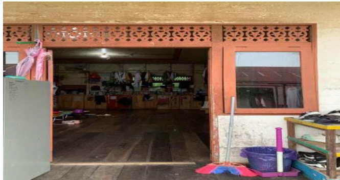
Gambar 4. 11 Asrama Ruqayyah

Asrama Maryam memiliki 5 kamar, di mana masing-masing kamar dapat menampung antara 19 hingga 23 santriwati. Tiap kamar memiliki satu pengurus asrama yang bertanggung jawab mengawasi aktivitas semua anggota di kamar tersebut di Asrama Maryam. 10