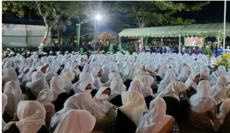
Gambar 4. 18 Acara Safrah Amal yang diadakan oleh Pondok Pesantren Rasyidiyah Khalidiyah secara Umum