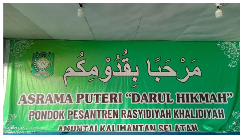
Gambar 4. 3 Asrama Puteri Darul Hikmah

Asrama Puteri Darul Hikmah terletak di lingkungan Pondok Pesantren Rasyidiyah Khalidiyah Amuntai. Asrama ini terdiri dari bangunan beton dan bangunan kayu. Pada awalnya, asrama ini hanya terdiri dari 3 bangunan yang diberi nama Asrama MAS, Asrama MAK, dan Asrama Permanen. Seiring berjalannya waktu, jumlah santriwati yang datang dari luar Kota Amuntai untuk menuntut ilmu di pondok pesantren ini meningkat, sehingga kapasitas asrama tidak lagi mencukupi. Akibatnya, asrama mengalami renovasi dan ditambah beberapa bangunan asrama di sekitarnya untuk menampung santriwati tambahan tersebut.