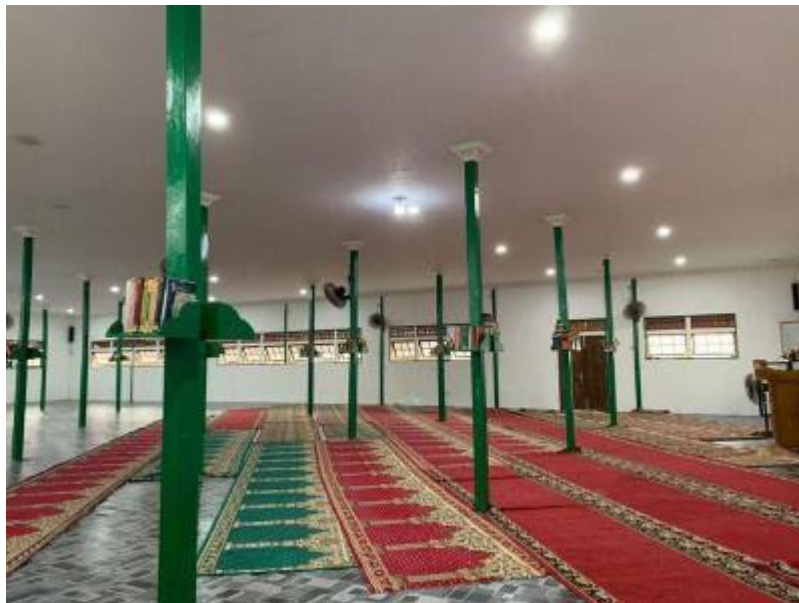
Gambar 4. 12 Mushola Asrama Darul Hikmah Puteri

Fasilitas yang tersedia di Asrama Puteri Darul Hikmah di Pondok Pesantren Rasyidiyah Khalidiyah Amuntai sudah cukup lengkap dan memadai untuk mendukung pelaksanaan program, kebijakan, dan aturan yang diterapkan oleh pengurus asrama. Namun, dengan pertumbuhan jumlah santriwati yang sangat cepat, pembangunan fasilitas dan infrastruktur tidak dapat mengikuti dengan cepatnya.