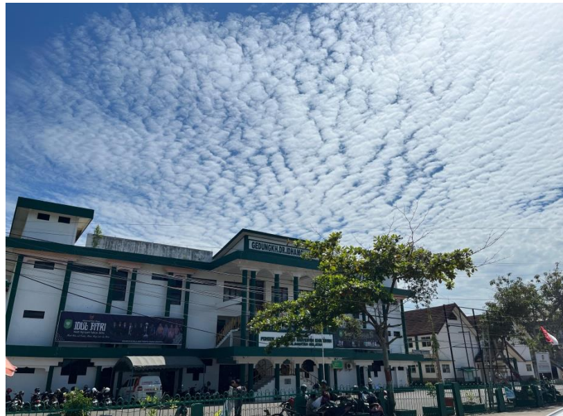
Gambar 4. 1 Pondok Pesantren Rasyidiyah Khalidiyah