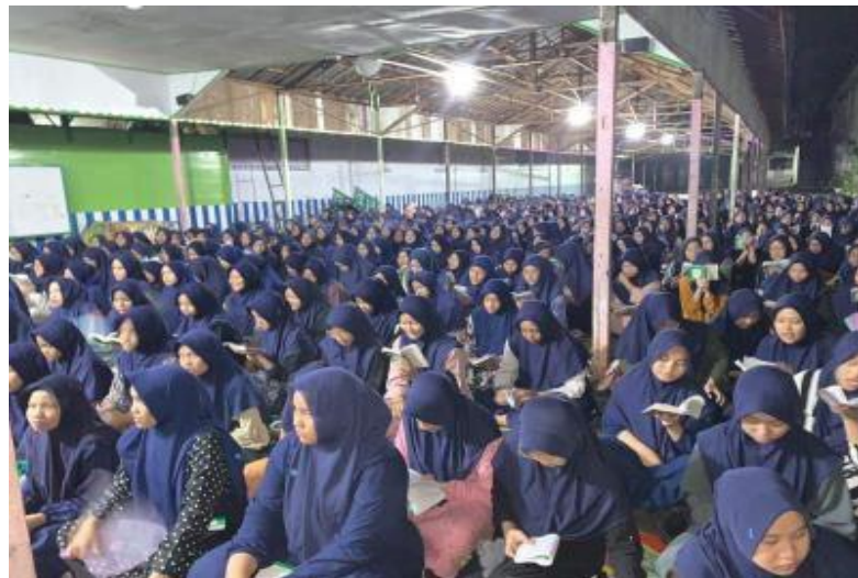
Gambar 4. 13 Pengajian Asrama Darul Hikmah

kemudian menerapkannya dalam kehidupan sehari-hari secara praktis. Hal ini bertujuan untuk membentuk karakter santri sesuai dengan ajaran syariat Islam. Selain itu, dakwah bil hikmah juga dilakukan dipondok pesantren ini, seperti mewajibkan para santri untuk shalat berjamaah setiap hari di musholla pondok pesantren saat waktu shalat lima waktu tiba, antrian untuk mengambil makanan dan mandi sebagai latihan kesabaran, serta mempromosikan saling menghormati antara sesama santri dan para ustadz/ustadzah.