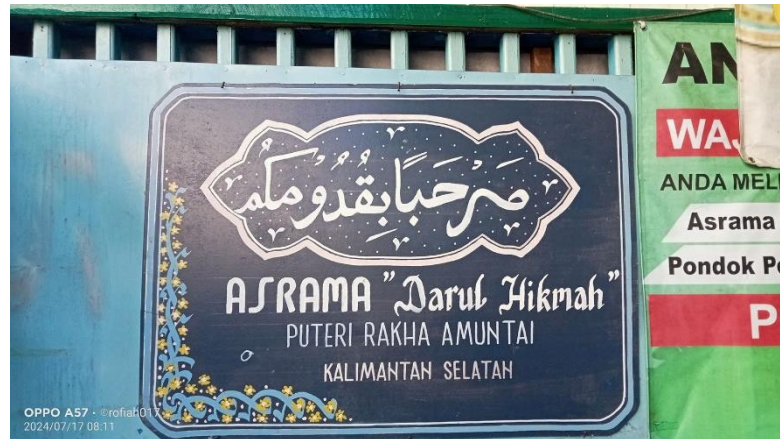
Gambar 4. 4 Asrama Puteri Darul Hikmah