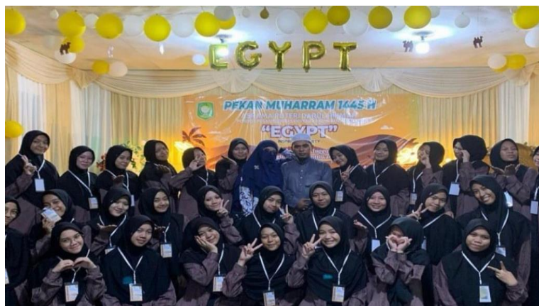
Gambar 4. 17 Acara Pekan Muharam Asrama Darul Hikmah

Kegiatan ini diadakan setiap kali hari raya Islam tiba atau acara khusus lainnya (seperti peringatan Isra dan Mi'raj, peringatan tahun baru Islam, peringatan Maulid Nabi, Nisfu Sya'ban, Hari Asyura, dan lain-lain) di musala pesantren. Setelah pengajian, para santri disugahi jamuan di lapangan depan musala. Tengah malamnya, dilakukan qiyamul lail bersama dengan para ustadz/ustadzah dan keluarga pengasuh pesantren.