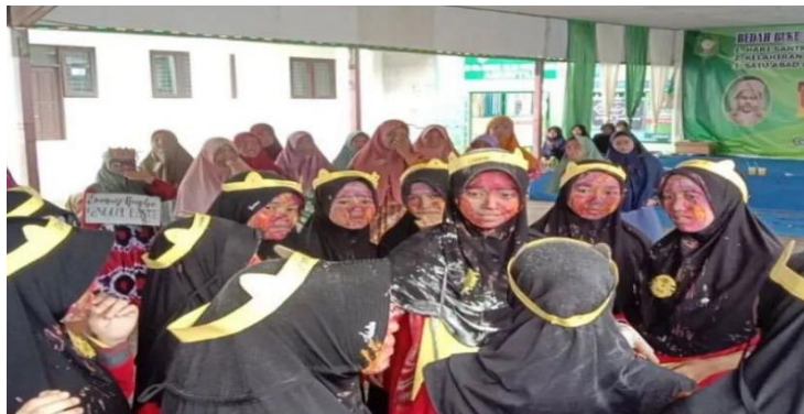
Gambar 4. 19 Estafet Bahasa Asrama Darul Hikmah

Evaluasi dalam pengajian rutin dilakukan untuk memastikan bahwa tujuan pembentukan karakter santri tercapai. Metode evaluasi mencakup observasi langsung selama pengajian, penilaian partisipasi dan keterlibatan santri dalam diskusi, serta refleksi melalui kegiatan tanya jawab. Pengurus Asrama Darul Hikmah juga melakukan evaluasi berkala terhadap efektivitas pengajian dengan meminta feedback dari santri. Hal ini membantu dalam menilai pemahaman santri terhadap materi yang diajarkan serta kemampuan mereka untuk menerapkan nilai-nilai tersebut