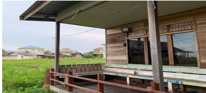
Gambar 4. 7 Asrama Fatimah