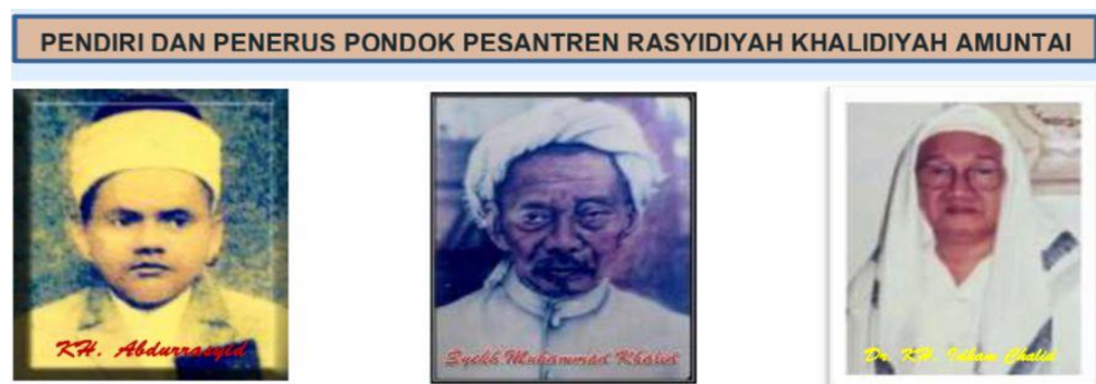
Gambar 4. 2 Pendiri dan Penerus Pondok Pesantren Rasyidiyah Khalidiyah 3

Untuk mengantisipasi keterlibatan dalam politik beliau telah menyatakan dalam surat beliau tertanggal 8 September 1953 dengan tegas menyatakan “Perguruan Normal Islam” tetap berjalan