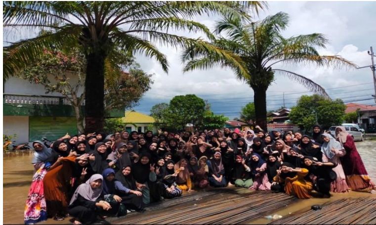
Gambar 4. 15 Bersih-Bersih Sampah setelah Kebanjiran

Evaluasi dilakukan untuk menilai efektivitas kegiatan dalam membentuk jiwa peduli lingkungan pada santri. Evaluasi ini dapat dilakukan melalui berbagai metode, seperti observasi langsung terhadap partisipasi santri dalam kegiatan, wawancara dengan santri dan pengurus pesantren, serta kuesioner untuk mengukur perubahan sikap dan pengetahuan santri tentang lingkungan. Selain itu, hasil kegiatan juga bisa dilihat dari keberlanjutan tindakan peduli lingkungan oleh santri, seperti kebiasaan membuang sampah pada tempatnya, partisipasi dalam program penghijauan, atau inisiatif lain yang mendukung pelestarian lingkungan. Hasil evaluasi kemudian digunakan untuk memperbaiki dan meningkatkan program di masa mendatang.