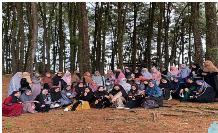
Gambar 4. 14 Liburan Staf Asrama Bersama Pembina Asrama

Oleh karena itu, Pondok Pesantren Rasyidiyah Khalidiyah menyelenggarakan suatu kegiatan di mana para santri dapat bersantai dan mengeksplorasi lingkungan serta alam sekitar setelah berbulan-bulan belajar di pesantren dan bertugas sebagai Staf Asrama Darul Hikmah. Mereka dapat melepas penat dan bersantai diberbagai tempat wisata domestik seperti Pantai Batakan dan Pantai Tangkisung. Selain itu, bagi pelajar tingkat akhir, pihak sekolah memberikan kesempatan untuk liburan agar para santriwati dapat memiliki pengalaman wisata yang tak terlupakan.