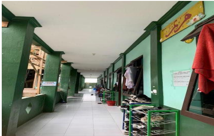
Gambar 4. 9 Asrama Hafsah

pengurus asrama. Mereka bertugas untuk mengelola dan mengawasi aktivitas santriwati di masing-masing asrama. 8