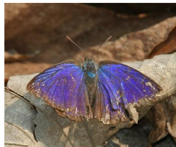
Gambar 4.15 Arhopala centaurus

Berdasarkan hasil pengamatan, kupu-kupu ketapang ( Arhopala centaurus ) termasuk ke dalam famili Lycaenidae dan ditemukan di zona II yaitu area dekat pemukiman warga. Sayap kupu-kupu ini memiliki ukuran rentang panjang mencapai 6 cm dan memiliki warna sayap yang cerah yang menjadi ciri khas yaitu warna biru cerah yang dominan, dan pola sayap sederhana. Antena kupu-kupu ini berbentuk membulat di ujungnya, mirip dengan benang. Kupu-kupu Arhopala centaurus sangat cepat dan gesit, saat ditemukan sedang bertengger di pohon