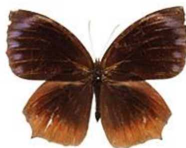
Gambar 4.10 Elymnias hypermnestra

Berdasarkan hasil pengamatan, kupu-kupu Elymnias hypermnestra dengan nama lokal kupu-kupu palem biasa yang termasuk jenis famili Nymphalidae, Elymnias hypermnestra memiliki ciri berukuran 6 cm, warna dasar kupu-kupu ini coklat gelap hingga hitam dengan pola yang mencolok di atas sayapnya. Bagian atas sayapnya memiliki pola unik berwarna biru keunguan dibagian sayap atas, dengan bintik putih yang tersebar disekitarnya. Bagian bawah sayapnya berwarna coklat dengan corak biru keunguan. Antena kupu-kupu ini berwarna hitam dan berbulu sama seperti kupu-kupu umumnya. Badannya berwarna coklat gelap dengan garis pola tipis.