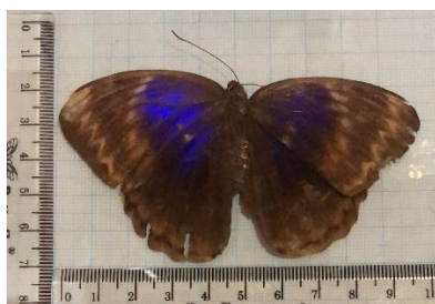
Gambar 4.5 Thaumantis klugius