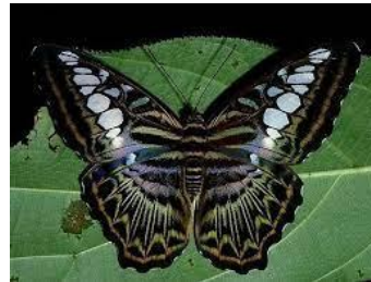
Gambar 4. Parthenos sylvia

Berdasarkan hasil pengamatan, kupu-kupu gunting coklat atau bisa juga disebut kupu-kupu pemotong ( Parthenos sylvia ) ditemukan di zona I yaitu area perkebunan kelapa sawit. Kupu-kupu gunting coklat ini memiliki panjang tubuh 9,5 cm dengan ciri berwarna dan pola sangat menarik, warna dasar sayapnya berwarna hitam, warna coklat yang membentuk garis-garis dan titik-titik bulatan pada sayap. Pada bagian atas sayapnya terdapat kombinasi warna hijau keunguan dengan aksen hitam, bagian bawah sayap memiliki pola yang lebih terang dengan kombinasi warna coklat, krim, dan oranye. Kupu-kupu pemotong ini memiliki bagian antena berukuran panjang dan berbulu serta badan yang ramping. Kupu-kupu Parthenos sylvia ditemukan aktif terbang di siang hari.