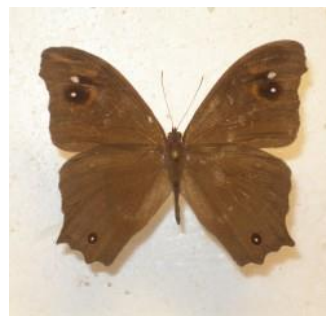
Gambar 4.7 Melanitis leda

Berdasarkan hasil pengamatan, kupu-kupu cokelat malam biasa ( Melanitis leda ) termasuk dalam famili Nymphalidae dan memiliki rentang sayap sepanjang 8,5 cm. Kupu-kupu Melanitis leda mempunyai sayap dengan warna dasar cokelat gelap, corak berbentuk bulatan hitam dan putih di bagian tengah sayap atas. Bagian bawah sayap juga sama dengan sayap atas namun corak bulatan hitam putihnya lebih kecil dan berada di tepi ujung sayap bawah. Kupu-kupu Melanitis leda memiliki perilaku yang susah di tangkap karena sangat lincah dan gesit saat terbang. Kupu-kupu ini ditemukan di sore hari di semak-semak padang rumput di zona I yaitu perkebunan kelapa sawit.