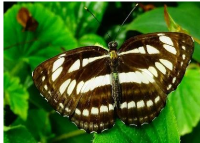
Gambar 4.13 Neptis hylas

Berdasarkan hasil pengamatan, kupu-kupu Neptis hylas dengan nama lokal kupu-kupu zebra hitam putih termasuk famili Nymphalidae yang ditemukan di dua lokasi yaitu zona I dan Zona II. Kupu-kupu Neptis hylas memiliki ukuran rentang sayap 6 cm bentuk sayapnya berbentuk segitiga dengan ujung yang sedikit melengkung. Warna dan pola kupu-kupu zebra hitam-putih ini memiliki warna dasar hitam dengan pola putih yang mencolok di atas sayapnya, yang memberikan penampilan zebra yang khas. Pola putih ini berupa garis-garis, bercak-bercak, atau motif yang terlihat seperti meliuk-liuk, pola ini terutama terlihat di bagian atas sayap, sementara bagian bawah sayapnya cenderung memiliki pola yang lebih netral dan berwarna cokelat muda keabu-abuan dengan bercak-bercak garis halus untuk memberikan kamuflase. Antena Neptis hylas berwarna hitam dan berbulu di ujungnya, seperti halnya dengan banyak spesies kupu-kupu lainnya. Badannya berwarna hitam kecoklatan dengan pola-pola tipis yang serasi dengan warna sayapnya. Kupu-kupu zebra hitam-putih ( Neptis hylas ) ditemukan di dedaunan hutan perkebunan kelapa sawit yaitu di zona I.