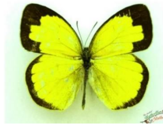
Gambar 4.17 Eurema hecabe

Berdasarkan hasil pengamatan, kupu-kupu Eurema hecabe dengan nama lokal kupu-kupu belerang termasuk famili Pieridae yang umumnya memiliki warna yang cerah dan mencolok. Hasil pengamatan pada kupu-kupu Eurema hecabe berukuran rentang sayap 5 cm, dengan ciri bentuk sayap berbentuk segitiga dengan ujung yang sedikit melengkung, warna dasar kuning cerah diseluruh sayapnya. Sayap dengan satu dua bercak orange pada bagian tengahnya. Pada bagian bawah sayapnya lebih pucat daripada bagian atasnya dan memiliki pola yang lebih sederhana, sering kali dengan garis-garis bercak yang terlihat lebih samar. Kupu-kupu ini memiliki antena berwarna hitam dan ujungnya sedikit berbulu, seperti kupu-kupu umumnya. Badannya berwarna kuning kecokelatan dengan garis dan