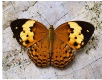
Gambar 4.8 Cupha erymanthis

Berdasarkan hasil pengamatan, kupu-kupu raja udang ( Cupha erymanthis ) ditemukan di zona I yaitu area perkebunan kelapa sawit. Kupu-kupu ini memiliki panjang 6 cm dengan ciri yang mencolok dari warnanya, disebut raja udang karena memiliki corak sayap yang menyerupai motif dan pola pada udang. Cupha erymanthis memiliki pola warna yang khas seperti garis-garis hitam yang menonjol dan bercak-bercak putih dan oranye yang teratur, dan mirip dengan pola warna pada beberapa jenis udang. Pada bagian sayap pada dasarnya memiliki warna cokelat oranye, pada bagian atas sayap, terdapat bercak putih yang berwarna kekuningan yang tersebar luas di permukaan sayap, serta terdapat bercak hitam di bagian ujung tepi sayap. Bagian bawah sayapnya memiliki warna yang tampak redup dan pucat.