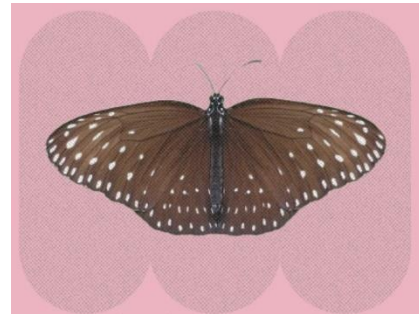
Gambar 4.4 Euploea camaralzeman

Berdasarkan hasil pengamatan, kupu-kupu gagak hitam berbintik ( Euploea camaralzeman ) termasuk ke dalam famili Nymphalidae, ditemukan di zona I yaitu area perkebunan kelapa sawit. Kupu-kupu ini memiliki panjang rentang sayap 12,5 cm dengan bentuk sayapnya berbentuk segitiga dengan ujung yang sedikit melengkung. Warna kupu-kupu Euploea camaralzeman ini memiliki warna dasar coklat pekat dengan bintik-bintik putih atau kekuningan yang tersebar di sepanjang tepi sayapnya. Pola sayapnya menciptakan tampilan yang kontras dan mencolok. Bagian atas sayapnya memiliki pola yang lebih terdefinisi. Kemudian bagian bawah sayapnya mempunyai pola yang lebih netral atau lebih samar. Antena Euploea camaralzeman berwarna hitam dan berbulu di ujungnya, seperti halnya dengan banyak spesies kupu-kupu pada umumnya. Badannya berwarna coklat gelap dan terdapat garis-garis tipis. Kupu-kupu ( Euploea camaralzeman ) dapat ditemukan di berbagai habitat, seperti hutan hujan, pinggiran hutan, dan kebun.