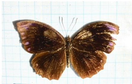
Gambar 4.10 Elymnias hypermnestra