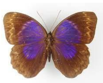
Gambar 4.5 Thaumantis klugius (Sumureus, 2020)