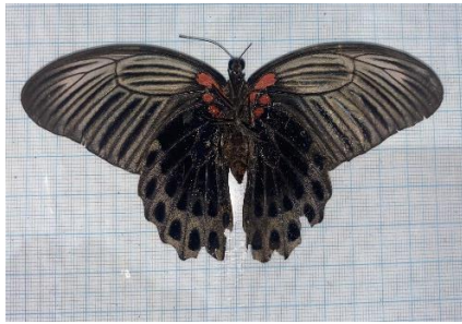
Gambar 4.1a Papilio memnon Betina