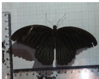
Gambar 4.1a Papilio memnon Jantan