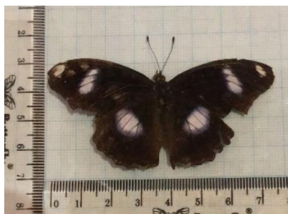
Gambar 4.6a Hypolimnas bolina