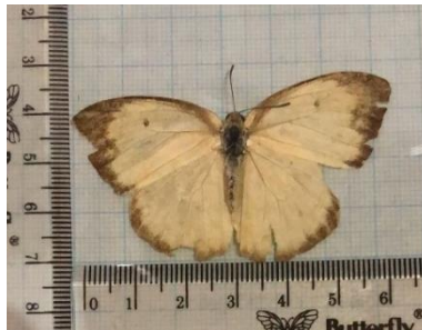
Gambar 4.16 Catopsilia pyranthe