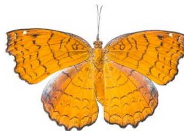
Gambar 4.9 Ariadne ariadne

Berdasarkan hasil pengamatan, kupu-kupu lingkaran tahun ( Ariadne ariadne ) ditemukan di zona I yaitu area perkebunan kelapa sawit. Kupu-kupu Ariadne ariadne termasuk dalam famili Nymphalidae yang memiliki ciri-ciri bagian sayap berwarna cokelat yang berkombinasi dengan warna kemerahan