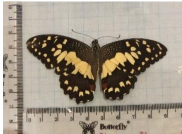
Gambar 4.2 Papilio demoleus