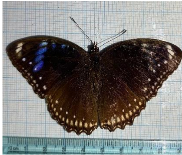
Gambar 4.6a Hypolimnas bolina