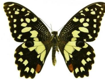
Gambar 4.2 Papilio demoleus

Berdasarkan hasil pengamatan, kupu-kupu jeruk ( Papilio demoleus ) termasuk ke dalam famili Papilionidae. Papilio demoleus memiliki sayap berwarna hitam yang mencolok dengan warna yang kontras. Kupu-kupu jeruk ini sedang beraktivitas di pohon jeruk pada siang hari di zona II yaitu area dekat pemukiman warga. Sayap depannya memiliki garis-garis hitam dan coklat melengkung, terdapat bercak-bercak kuning dan hitam yang tersebar di sekitarnya dan terdapat corak oranye dan biru. Bagian belakang sayapnya memiliki pola yang serupa dengan sayap atas namun tampak lebih sederhana. Bentuk sayapnya berbentuk segitiga dengan ujung yang melengkung, berukuran panjang 9,5 cm. Antena kupu-kupu ini berwarna hitam dan berbulu di ujungnya, badannya berwarna coklat. Umumnya jenis jantan dan betina kupu-kupu Papilio demoleus memiliki penampilan yang mirip, tetapi betina sering terlihat lebih netral dan samar warnanya dibanding jantan.