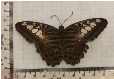
Gambar 4. Parthenos sylvia