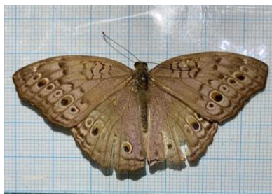
Gambar 4.11 Junonia atlites