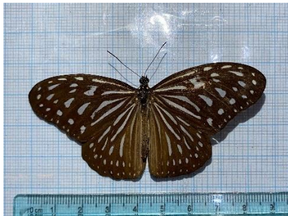
Gambar 4.12 Ideopsis vulgaris