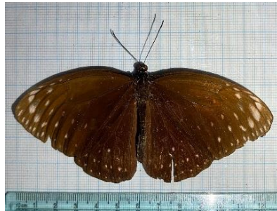
Gambar 4.4 Euploea camaralzeman