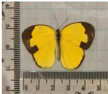
Gambar 4.17 Eurema hecabe