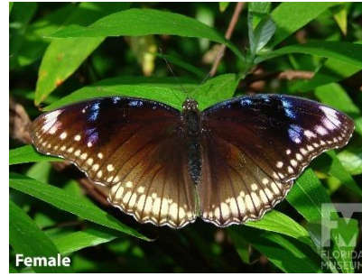
Gambar 4.6b Hypolimnas bolina

Berdasarkan hasil pengamatan, didapatkan sepasang kupu-kupu Hypolimnas bolina , kupu-kupu betina memiliki nama lokal kupu-kupu telur atau great eggfly ( Hypolimnas bolina ) sedangkan jenis jantan nama lokalnya kupu-kupu bulan biru, kupu-kupu ini termasuk famili Nymphalidae. Hypolimnas bolina jantan biasanya disebut kupu-kupu bulan biru karena memiliki ciri pola dan warna yang unik dengan warna dasar sayap hitam kecokelatan terdapat pola berwarna biru seperti ungu metalik di bagian atas sayapnya. Pada betina memiliki lebih banyak pola berwarna coklat namun masih ada aksen pola berwarna biru di bagian atas sayapnya, bagian bawah sayap lebih netral berwarna coklat atau kehitaman dengan bercak-bercak garis coklat muda seperti renda dan titik-titik putih ditepi atas dan bawah sayapnya. Hypolimnas bolina jantan dan betina memiliki antena berwarna hitam dan berbulu di ujungnya, badannya berwarna coklat gelap. Berdasarkan hasil pengamatan perbedaan antara jantan dan betina jenis Hypolimnas bolina cukup jelas dengan perbedaan pada bagian sayap antara warna dan pola.