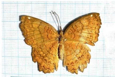
Gambar 4.9 Ariadne ariadne