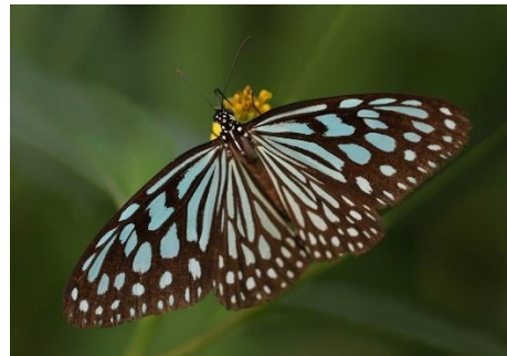
Gambar 4.12 Ideopsis vulgaris

Berdasarkan hasil pengamatan, kupu-kupu harimau berkaca biru dengan nama ilmiah ( Ideopsis vulgaris ) termasuk ke dalam famili Nymphalidae. Kupu-kupu ini ditemukan di zona I kebun kelapa sawit dan di zona II area dekat pemukiman warga. Ideopsis vulgaris ditemukan dengan panjang 8,5 cm memiliki ciri sayap berwarna abu-abu kebiruan dengan garis-garis hitam yang terlihat membentuk pola guratan dan titik di permukaan sayap. Bagian sayap depan terlihat garis pendek di sepanjang tepi punggung sayap berwarna hitam. Sayap pada bagian depan memiliki garis hitam melintang ke arah ujung tepi sayap, di bagian sayap bawah memiliki tanda yang mirip dengan pola di sisi atas namun warnanya sedikit lebih terang. Pada bagian belakang sayap memiliki garis-garis berwarna abu-abu kebiruan yang terlihat seperti membentuk huruf V sempit dengan puncak yang