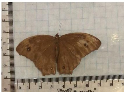
Gambar 4.7 Melanitis leda