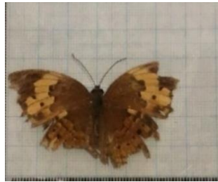
Gambar 4.8 Cupha erymanthis