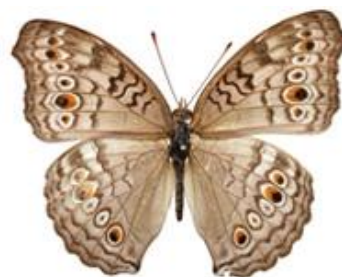
Gambar 4.11 Junonia atlites