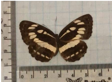
Gambar 4.13 Neptis hylas