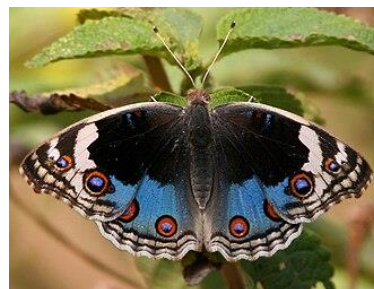
Gambar 4.14 Junonia orithya

Berdasarkan hasil pengamatan, kupu-kupu Junonia orithya dengan nama lokal kupu-kupu bola mata biru termasuk famili Nymphalidae, memiliki rentang sayap mencapai 6 cm. Junonia orithya dengan ciri-ciri sayap yang dominan warna biru yang mencolok dibagian bawah sayapnya dan merupakan kupu-kupu jantan. Warna biru pada sayap yang dipadukan dengan garis-garis hitam yang kontras dan