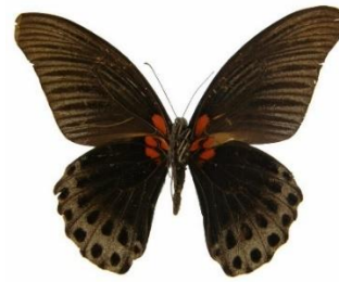
Gambar 4.1b Papilio memnon Betina

Berdasarkan hasil pengamatan, ditemukan kupu-kupu Papilio memnon jenis jantan dan betina dengan nama lokal kupu-kupu sayap burung atau bisa juga disebut birdwing atau swallow tails ( Papilio memnon ). Kupu-kupu sayap burung ( Papilio memnon ) ini ditemukan di zona I area perkebunan kelapa sawit, memiliki panjang rentang sayap 13,5 cm, Papilio memnon jantan memiliki ciri sayap berwarna hitam pekat seperti berbulu dengan bentuk bergelombang di pinggirannya, memiliki garis-garis warna biru. Bagian bawah sayap belakang hitam terdapat warna gelap, yang mana bagian pinggirannya berwarna biru dan memiliki garis titik-titik hitam, terdapat bercak merah pada bagian pangkal sayap belakang.