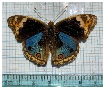
Gambar 4.14 Junonia orithya