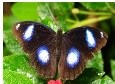
Gambar 4.6b Hypolimnas bolina