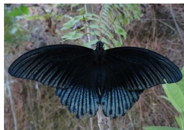
Gambar 4.1b Papilio memnon Jantan