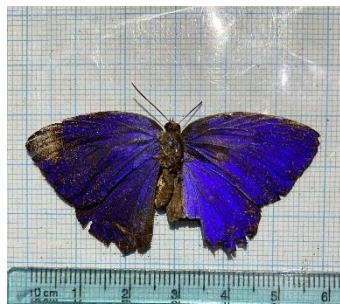
Gambar 4.15 Arhopala centaurus