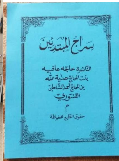
Dokumentasi Kitab yang digunakan