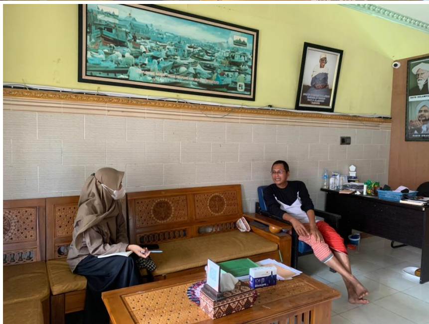
Dokumentasi wawancara dengan pengasuh dan pembina