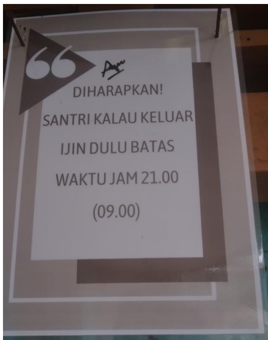
Dokumentasi peraturan di pant