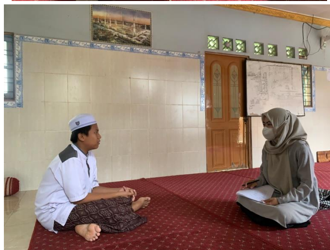
Dokumentasi wawancara dengan anak asuh