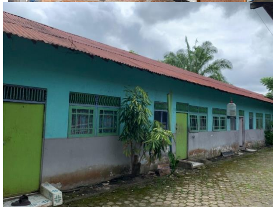
Dokumentasi Bangunan panti