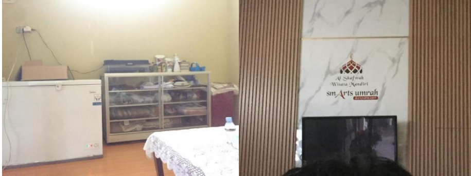
Kantor Smarts Umrah cabang Kalimantan Selatan