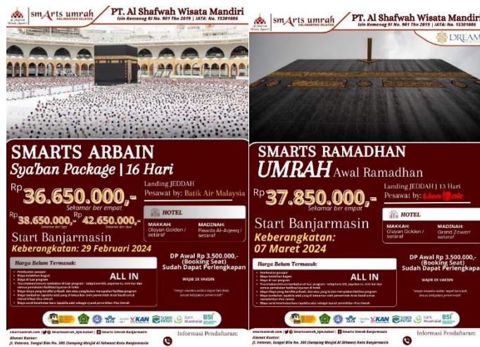
Foto-foto periklanan milik Smarts Umrah Travel Kalimantan Selatan