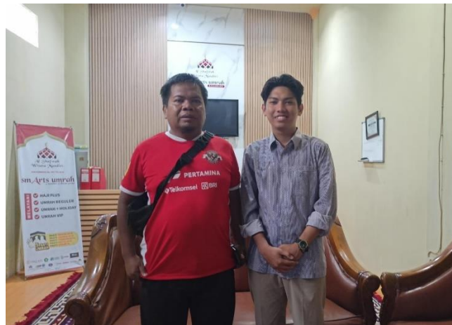
Wawancara dengan Jemaah Smarts Umrah cabang Kalimantan Selatan