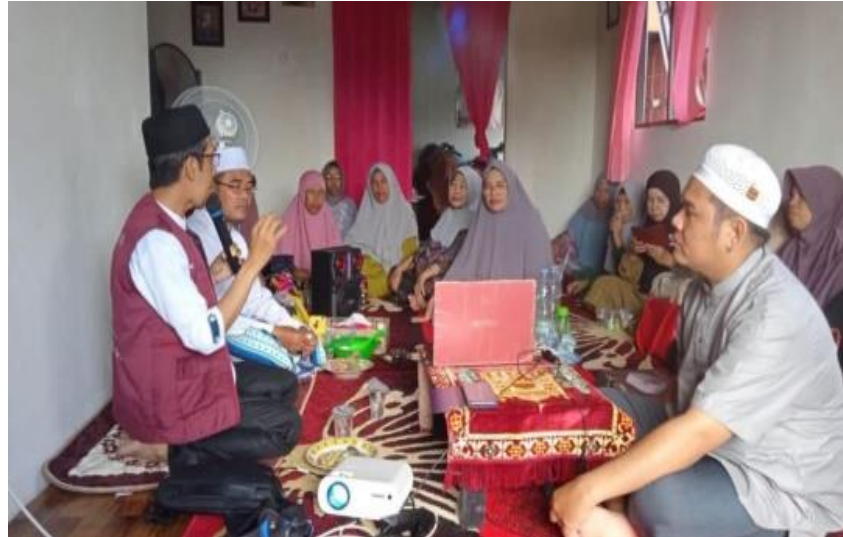
Gambar 4.2 Syiar Smarts Umrah