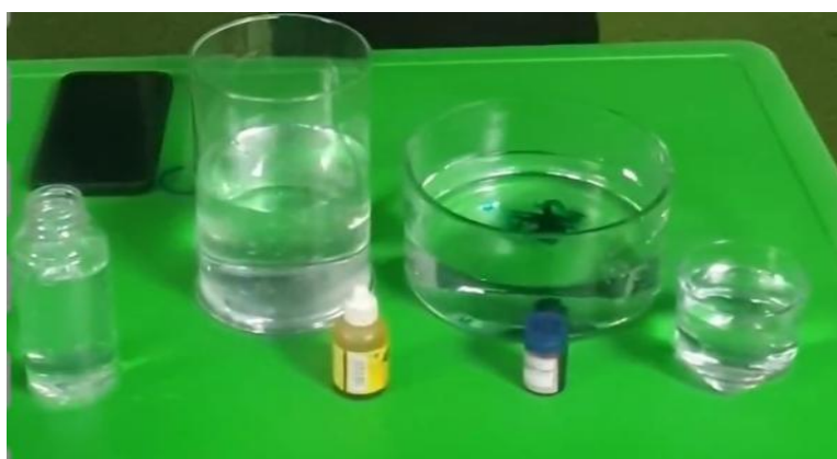
Gambar 4.2 Alat dan bahan eksperimen perubahan warna (cdf7) 76

Peneliti datang ke PAUD IT Athaiara Modern School Kota Banjarbaru. Kegiatan awal seperti biasa dimulai dengan senam pagi. Pada kegiatan little scientist hari ini pencampuran warna sekunder yaitu warna biru, kuning, dan merah. Pada little scientist kali ini mengenalkan konsep perubahan warna. Pendidik menyiapkan alat dan bahan yang sederhana dan aman untuk anak seperti tabung kaca, botol plastik, air dan pewarna makanan. Semua alat dan bahan di letakkan di atas meja seperti yang terlihat pada gambar 4.2 dan anak-anak duduk melingkar supaya bisa dilihat oleh seluruh anak (c11.p1). 75