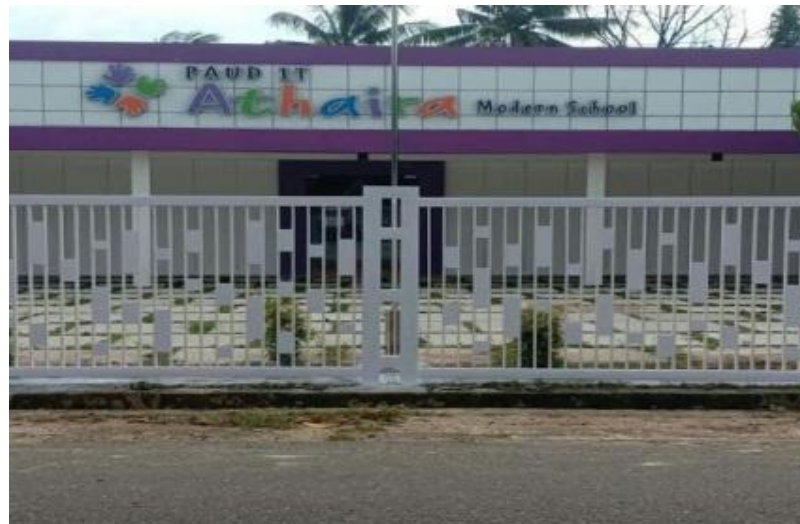
Gambar 4.1 PAUD IT Athaira Modern School (cdf1) 48