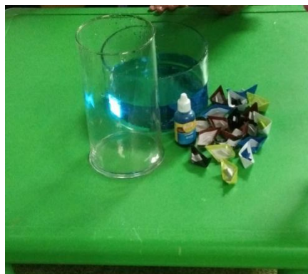
Gambar 4.6 Alat dan bahan eksperimen kapal tenggelam (cdf9) 85

Anak-anak duduk melingkar memperhatikan pendidik untuk terlebih dahulu mencontohkan bagaimana cara bermain. Anak bergantian maju ke depan, pertama anak memilih kapal yang anak suka untuk dimainkan, kemudian kapal tersebut diletakkan di atas air dan ditutup dengan gelas kaca panjang menggunakan dua tangan agar gelas tersebut bisa tenggelam sampai menyentuh dasar gelas seperti gambar 4.7. Pendidik meminta anak untuk mengamati kapal yang tenggelam di dalam gelas berisi air tersebut apakah basah atau tidak, anak menjawab kapal yang ada di dalam air tidak basah, gelas diangkat perlahan ke atas agar kapal tidak terbalik dan basah, kapal yang sudah selesai dimainkan dikasih pada anak (c13.p2). 86