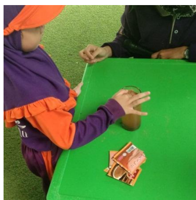
Gambar 4.5 Anak mencelupkan jari pada serbuk kayu manis (cdf12) 82

waktu setiap anak mencoba yaitu sekitar 3 detik, seperti yang ada pada gambar 4.5 anak mencoba satu persatu mencelupkan jari ke dalam gelas dan ditanya apakah jari tersebut basah atau tidak basah, hampir semua anak menjawab tidak basah, tetapi ada juga jari anak yang basah karena anak terlalu dalam mencelupkan jari ke dalam bubuk kayu manis sehingga menembus ke dalam air. Bubuk kayu manis semakin lama berada di atas air juga akan perlahan larut ke dalam air, sehingga harus sering diganti ketika sudah beberapa anak yang mencoba bermain. Setiap anak yang sudah melakukan percobaan sains mencuci tangan dan dipersilahkan untuk ke kelas dan istirahat makan. Kegiatan little scientist pada hari ini sampai jam 10.00 (c12.p2). 81