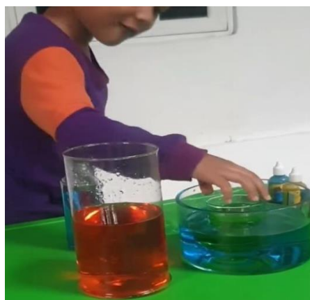
Gambar 4.3 Anak mengamati perubahan warna kuning dan biru menjadi hijau (cdf11) 78

Sebelum anak mencoba di depan kelas terlebih dahulu pendidik mencontohkan bagaimana cara bermain, anak mengamati secara langsung proses pencampuran warna dan memahami tahap main. Setelah selesai dicontohkan oleh pendidik, anak diberikan kesempatan 1 kali untuk bereksperimen, anak mencelupkan botol yang berwarna kuning ke dalam tabung kaca yang berisi air warna biru, kemudian anak mengamati perubahan warna tersebut ketika di dalam air berubah menjadi warna hijau, sedangkan botol warna biru yang dicelupkan ke dalam tabung kaca berisi air warna merah akan berubah menjadi warna ungu seperti yang terlihat pada gambar 4.3 dan terlihat semua anak bisa untuk menyebutkan perubahan warna yang terjadi pada pencampuran warna sekunder tersebut dan anak senang mengikuti kegiatan little scientist pada hari ini (c11.p2). 77