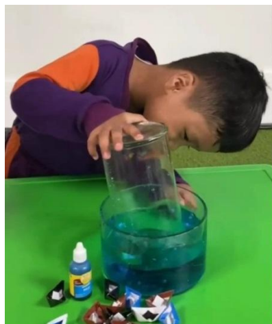
Gambar 4.7 Anak menutup kapal menggunakan tabung kaca (cdf13) 87

Setelah anak mendapatkan kesempatan main satu kali anak mencari kegiatan main yang ada disekitar seperti menaiki perosotan dan bermain bersama dengan teman yang lain. Dalam kegiatan eksperimen ini anak-anak masih ada beberapa yang dibantu untuk menekan gelas kaca karena kekuatan otot tangan yang kurang kuat, serta anak yang tidak pelan-pelan menarik gelas ke atas sehingga gelas kemasukan air dan kapal menjadi basah. Kegiatan selesai pada jam 10.00 anak-anak cuci tangan dan istirahat di kelas masing-masing makan sambil menunggu jam pulang (cl3.p3). 88