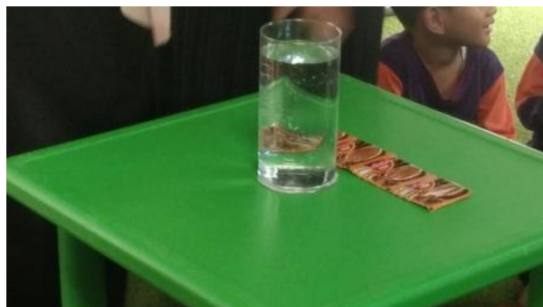
Gambar 4.4 Alat dan bahan eksperimen basah dan kering pada serbuk kayu manis (cdf8) 80

Pendidik menjelaskan terlebih dahulu kepada anak bubuk kayu manis berfungsi untuk pengharum pada makanan dan digunakan untuk pelengkap bumbu pada masakan. Setelah selesai menjelaskan pendidik menciumkan bubuk kayu manis ke anak untuk mengenal bau pada rempah-rempah masakan. Beberapa anak ada yang menyebutkan bau bubuk kayu manis tidak enak dan ada juga yang menyebutkan seperti bau kulit pohon. Sebelum anak-anak mencoba, terlebih dahulu pendidik menjelaskan dan mempraktikkan tata cara bermain, air yang ada di dalam gelas kaca besar di tuang ke dalam gelas yang kecil sampai terisi penuh, kemudian bubuk kayu manis dimasukkan ke dalam gelas sebanyak dua sachet agar penghalang antara bubuk dengan air tebal. Pendidik memasukkan jari telunjuk ke dalam bubuk kayu manis dan diangkat jari tersebut apakah basah atau tidak. Gelas kaca yang digunakan untuk percobaan diganti dengan air yang baru untuk anak, dimasukkan bubuk kayu manis dan durasi