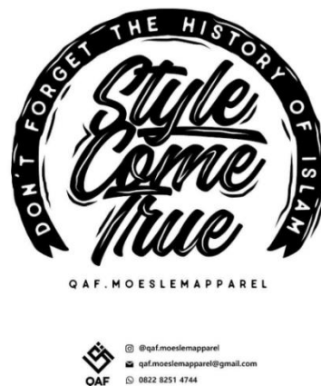
Gambar 1. 1 Qaf Moeslem Apparel

mempromosikan pesan-pesan positif dan inspiratif. Qaf Moeslem Apparel juga mempersembahkan produk-produk yang tidak hanya memenuhi kebutuhan fashion, tetapi juga menyampaikan sebuah pesan-pesan moral dan spiritual kepada para pelanggannya, sehingga menciptakan hubungan yang lebih dalam antara konsumen dan produsen.