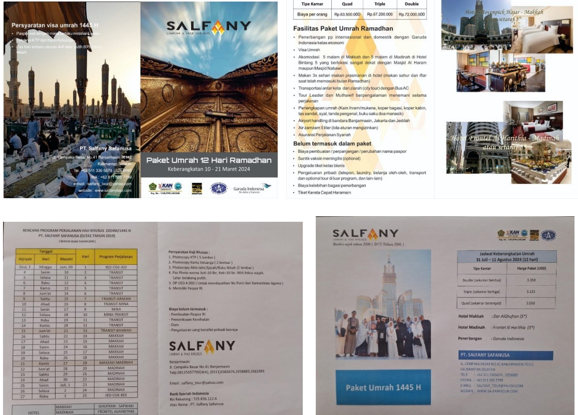
Gambar 5. 7 Brosur PT. Salfany Safanusa