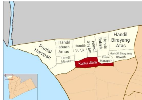
Gambar 4.1 Kantor dan Peta Desa Kurau Utara