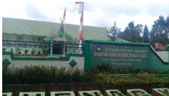
Gambar 4.2 Kantor Kementerian Agama Tanah Laut

Lokasi Kementerian Agama Kabupaten Tanah Laut berlokasi di jalan H. Boejasin, Komplek Perkantoran Gagas Pelaihari (70814). Telepon/Fax. (0512) 21068. Email: talakalsel@kemenag.go.id . Website resmi Kantor Kementerian Agama Kabupaten Tanah Laut yaitu https://kemenagtanahlaut.blogspot.com . Situs ini dikelola oleh Bagian Humas.