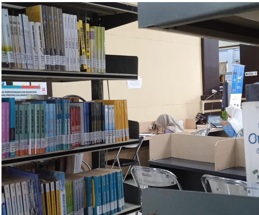
Gambar 3 fasilitas baca dan tempat koleksi