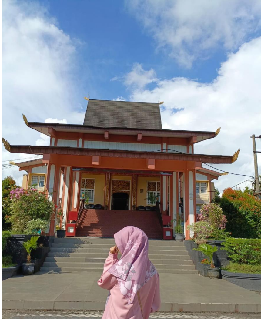
Gambar 1 Dinas Perpustakaan dan Kearsipan Provinsi Kalimantan Selatan