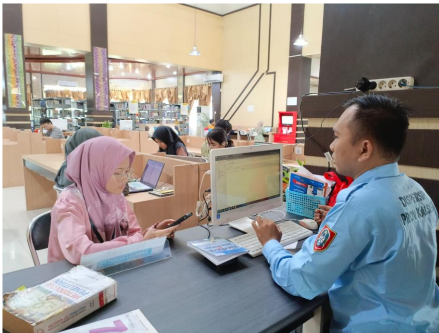
Gambar 5 Wawancara dengan Pustakawan