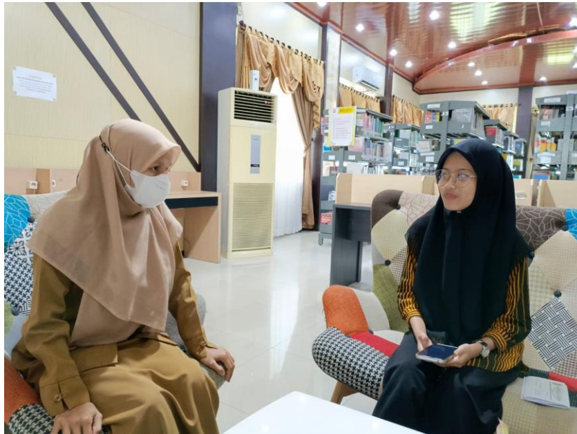
Gambar 4 Wawancara dengan Pustakawan