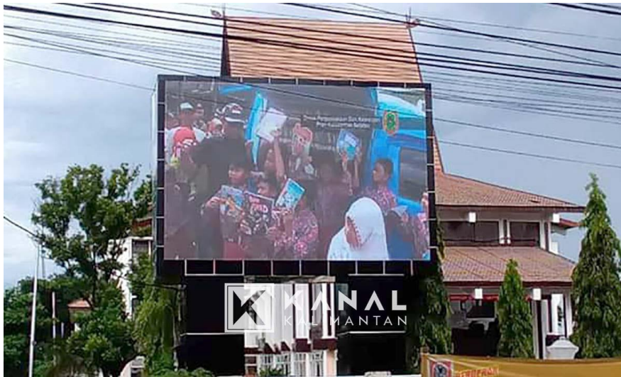
Gambar 2 HDS sistem Dinas Perpustakaan dan Kearsipan Provinsi Kalimantan Selatan