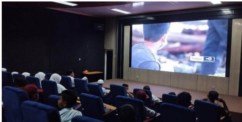
Gambar 4.2 Ruang teater audio visual

Melalui program ini dari hasil wawancara yang telah dilakukan oleh poenulis, promosi koleksi digital mendapat peluang yang sangat strategis dan mudah, menampilkan secara langsung kepada pengunjung macam-macam koleksi digital seperti audio visual ini.