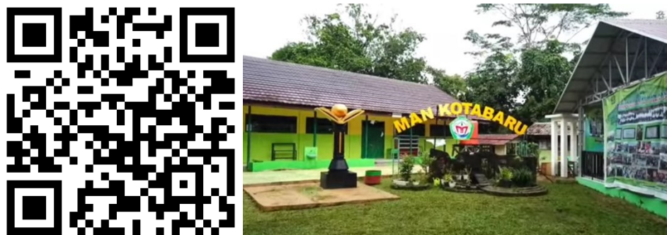
Gambar 3.2 Peta Lokasi MAN Kotabaru

Penelitian ini berlangsung di Madrasah Aliyah Negeri (MAN) Kotabaru. Madrasah ini berlokasi di Jalan Brigjend H. Hasan Basri Desa Semayap Kabupaten Kotabaru. Peta lokasi penelitian MAN Kotabaru disajikan pada gambar 3.2.