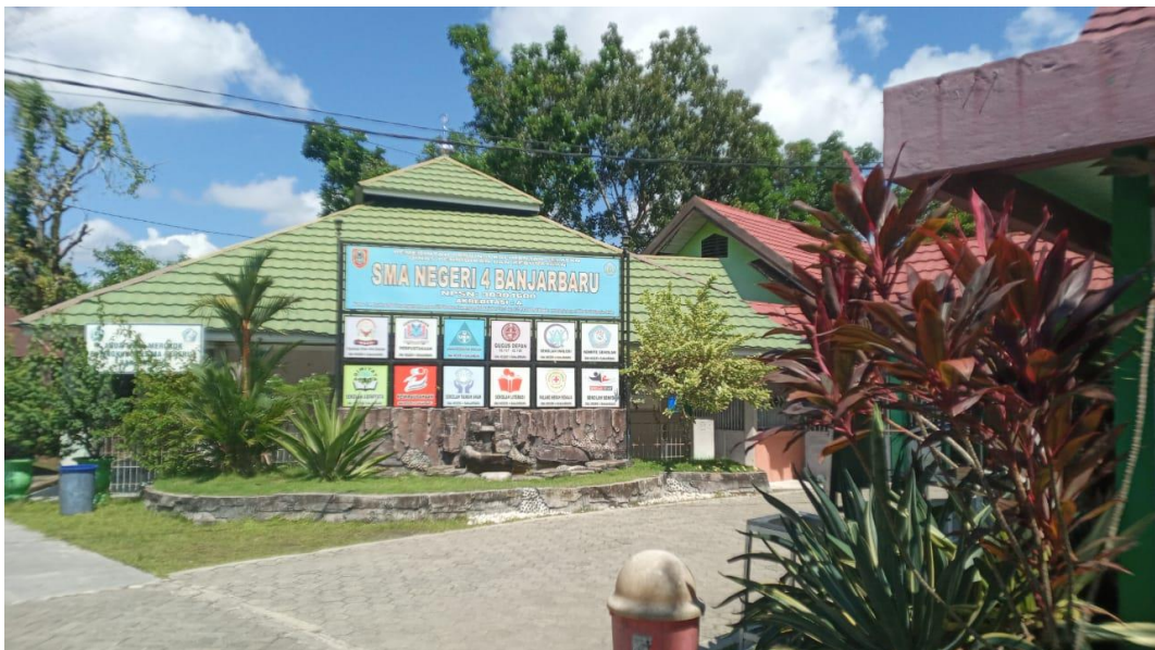
SMA Negeri 4 Banjarbaru