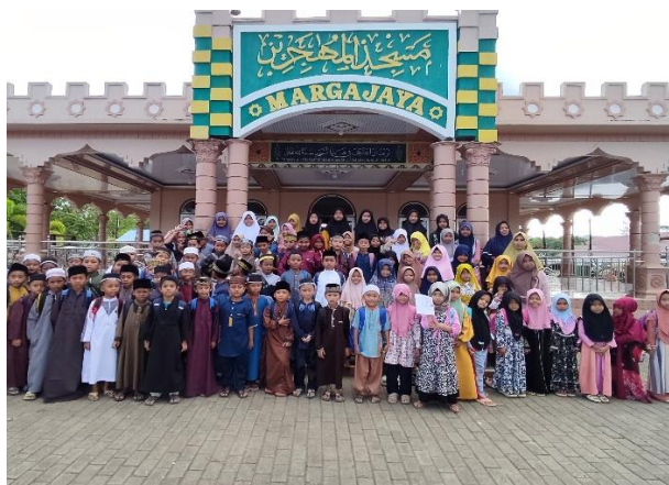
GAMBAR 4.3 Persiapan Maulid Nabi Bersama Santri TPQ