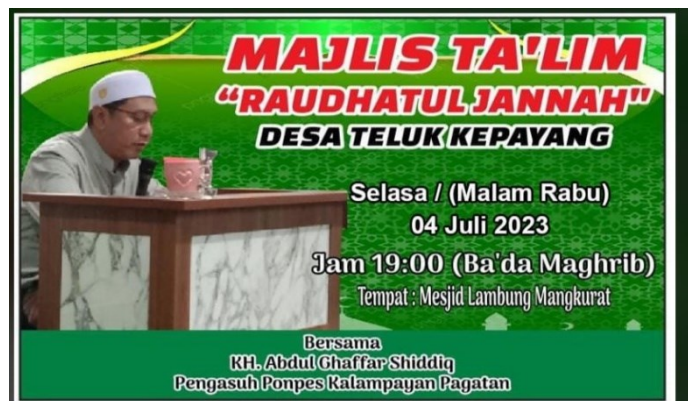
Dokumentasi Plamflet pemberitahuan majelis taklim Raudhatul Jannah