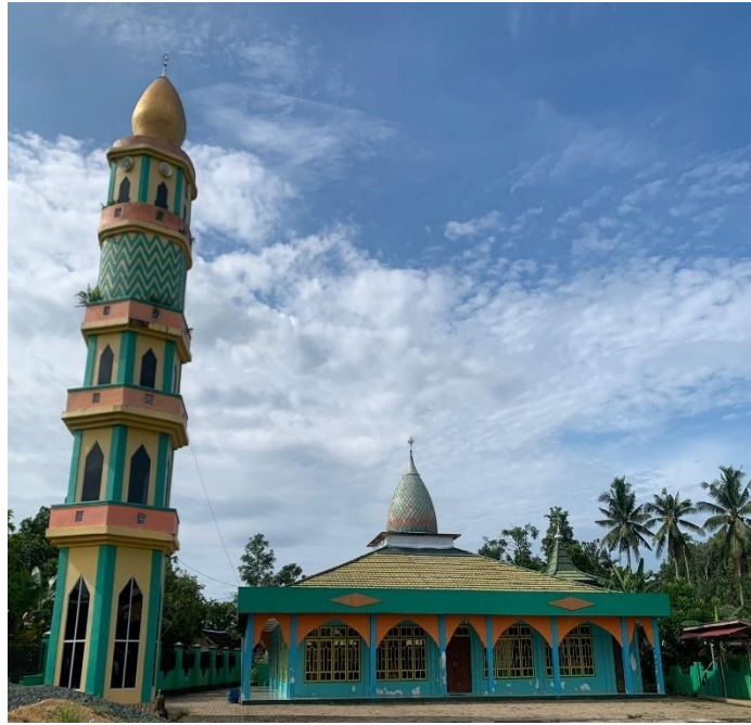
Dokumentasi Tempat majelis taklim Raudhatul Jannah Teluk Kepayang