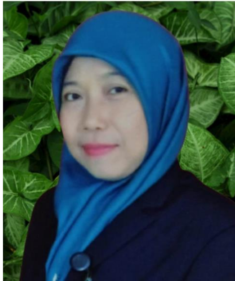
Gambar 4.3 Kepala Unit TK/TP Al-Qur'an Unit 191 Al-Inayah Banjarmasin