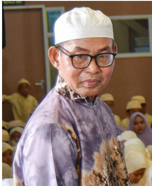
Gambar 4.2 Pengasuh TK/TP Al-Qur'an Unit 191 Al-Inayah Banjarmasin