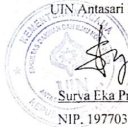
Surva Eka Privatna, M.cs

Mengetahui Ketua Jurusan Komunikasi dan Penyiaran Islam Fakultas Dakwah dan Ilmu Komunikasi UIN Antasari Banjarmasin,