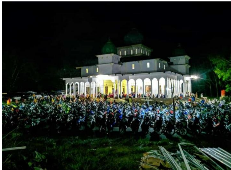
Gambar 4.9 Area Parkir Majelis Taklim Nurul Musthofa

Sarana dan prasarana yang memadai menjadi faktor pendukung yang membantu keberhasilan kegiatan pengajian. Majelis Taklim Nurul Musthofa dari tahun ke tahun terus meningkatkan kualitas dan kuantitas sarana dan prasarana mereka supaya jemaah merasa nyaman saat hadir di kegiatan pengajian mereka. Salah satu contohnya adalah perpindahan lokasi majelis taklim ke musala Diyaussajidin yang berada di area Pondok Pesantren Nurul Musthofa yang memiliki daya tampung lebih banyak dan area parkir yang lebih luas. Agar untuk dapat menampung lebih banyak jemaah.