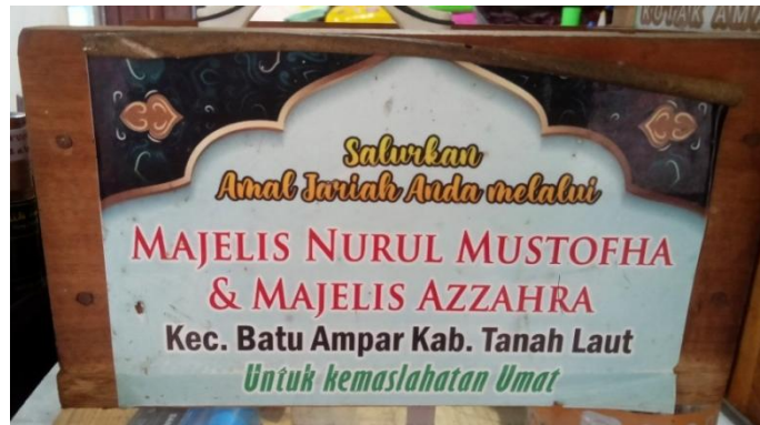
Gambar 4.5 Kotak amal