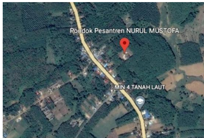
Gambar 4.4 Letak Majelis taklim Nurul Musthofa