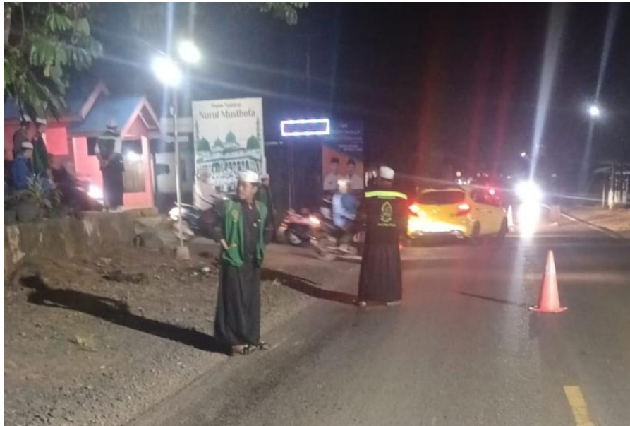
Gambar 4.6 Remaja Majelis Mengatur Arus Balik Jemaah

remaja majelis. Untuk kemudian secara resmi menjadi anggota remaja majelis setelah diberikan atribut remaja majelis. 11