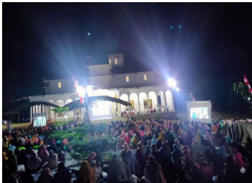
Gambar 4.8 Kegiatan Tahunan Majelis Taklim Nurul Musthofa

Lalu kegiatan tahunan yang diselenggarakan setiap satu tahun sekali adalah peringatan hari besar Islam (PHBI) dan haul. Kegiatan tahunan meliputi peringatan isra mi'raj , maulid Nabi, haul dan akikah. Untuk akikah biasanya sekaligus dengan peringatan maulid atau isra mi'raj . Pada kegiatan ini Majelis Nurul Musthofa selalu mengundang pemateri undangan serta majelis-majelis terdekat dan mengundang jemaah secara umum secara langsung dan melalui sosial media. Undangan secara langsung disampaikan setelah acara pengajian rutin seminggu sebelum acara tahunan dilaksanakan, kemudian juga mengundang jemaah majelis lain dengan cara mengamanahkan kepada pengurus majelis tersebut untuk mengundang yang hadir saat itu untuk hadir di acara tahunan. Undangan melalui sosial media berupa pamflet yang dibagikan pada akun instagram resmi yayasan pondok pesantren dan majelis taklim Nurul Musthofa.