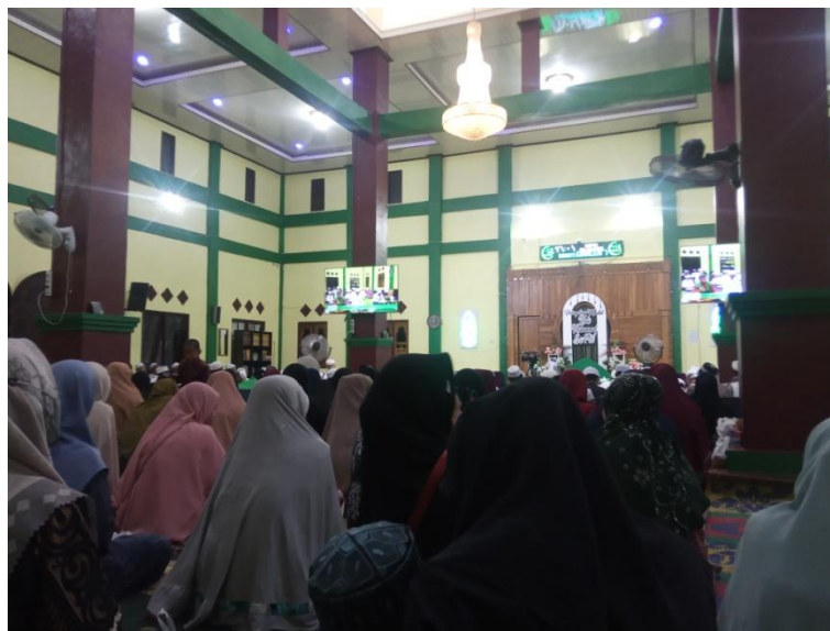
Gambar 4.7 Kegiatan Rutin Mingguan Majelis Taklim Nurul Musthofa

Kegiatan majelis terbagi menjadi kegiatan mingguan dan kegiatan tahunan. Kegiatan mingguan diselenggarakan setiap satu minggu sekali yaitu pada hari kamis khusus untuk wanita dan hari sabtu untuk umum.