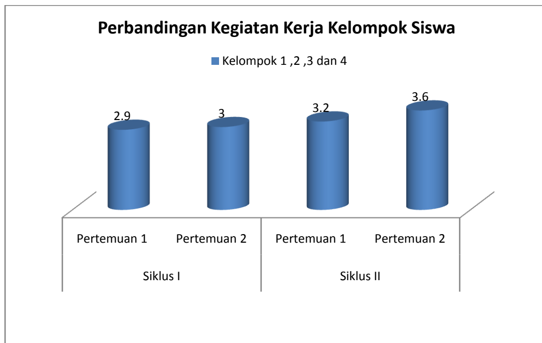
Grafik : 2 Perbandingan Kegiatan Kerja Kelompok Siswa

Dari temuan yang diperoleh melalui kegiatan belajar mengajar yang dilaksanakan 2 siklus dengan 4 hasil pertemuan ( 2 x 35 menit) melalui observasi aktivitas siswa dalam KBM , penilaian formatif dan perbandingan kegiatan kerja kelompok siswa. Maka dapat dinyatakan