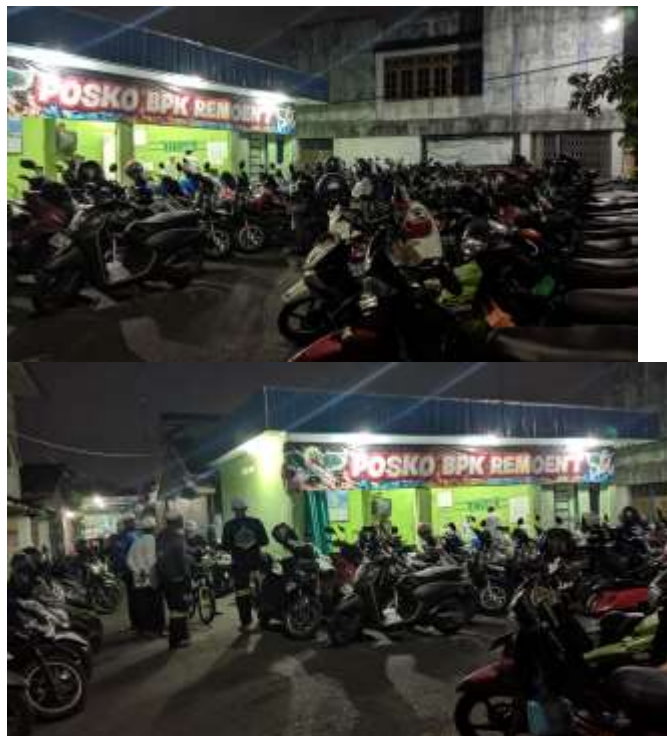
Gambar 4. 6 Parkiran Majelis Sholawat Ar-Raudhah Saka Permai

beberapa titik lokasi untuk bertugas, ketika acara besar petugas parkir bekerja sama dengan petugas kepolisian, BPK setempat untuk mengatur arus lalu lintas dan penempatan tempat parkir jemaah baik kendaraan maupun mobil. Biasanya ketika acara besar berlangsung di Majelis Sholawat Ar-Raudhah Saka Permai jemaah membeludak banyak yang datang, jadi jika petugas dari pihak majelis saja bakal kewalahan dapatnya jemaah yang banyak, dengan itu pihak majelis bekerja sama dengan beberapa pihak untuk mengurangi kemacetan.