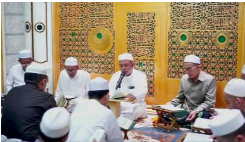
Gambar 4. 1 Kegiatan Majelis Sholawat Ar-Raudhah Saka Permai