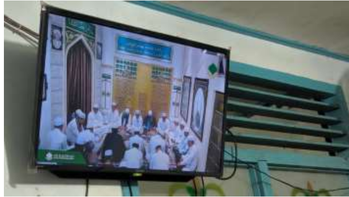
Gambar 4. 12 LCD TV