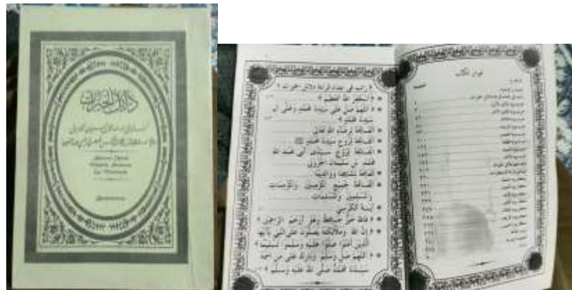
Gambar 4. 5 Kitab Dalail Khairat