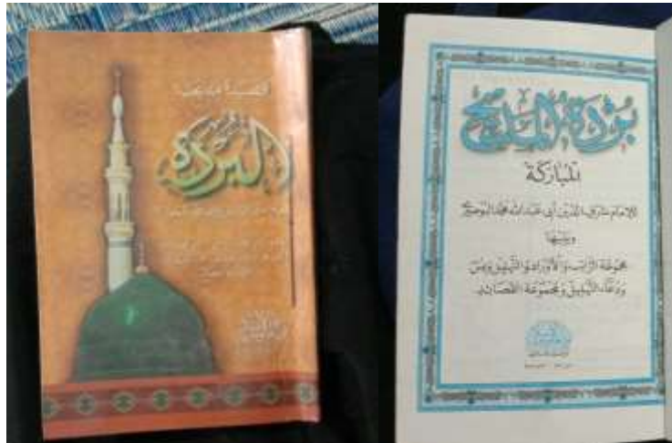
Gambar 4. 4 Kitab Burdah

Muhammad Al-Azab, terakhir di tutup dengan Salat isya berjemaah” 10