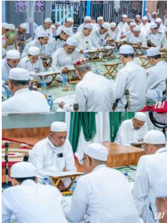
Gambar 4. 9 Acara Khataman Al-Qur'an