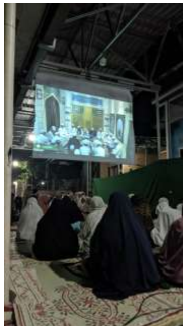
Gambar 4. 13 Layar Proyektor