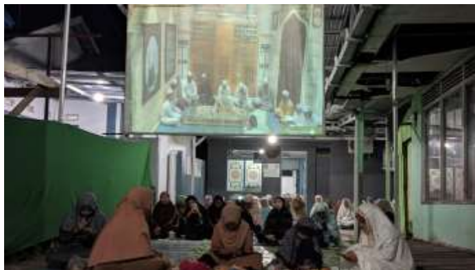
Gambar 4. 8 Foto Kegiatan Majelis Sholawat Ar-Raudhah Saka Permai