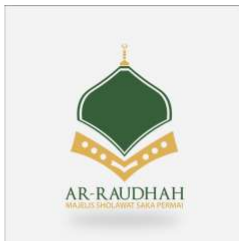
Gambar 4. 2 Logo Majelis Sholawat Ar-Raudhah Saka Permai