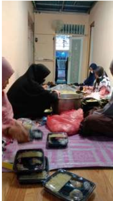
Gambar 4. 7 Bidang Konsumsi Saat Acara Haul