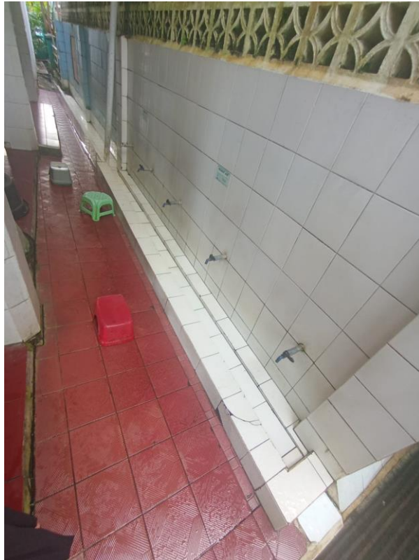
Tempat berwudhu yang lain