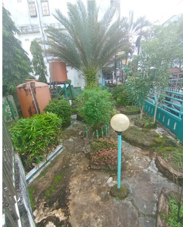
Halaman depan Mushola Sirojul Huda