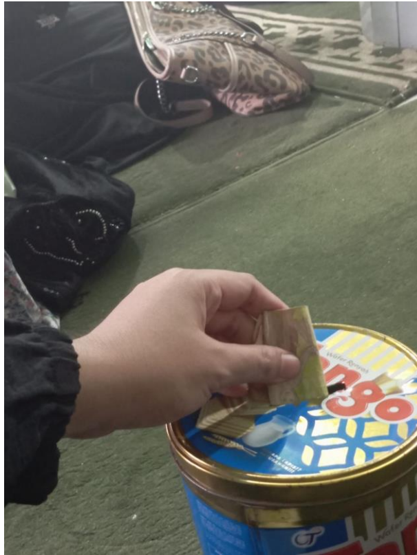
Kegiatan jempitan/sumbangan sukarela selama pengajian berlangsung