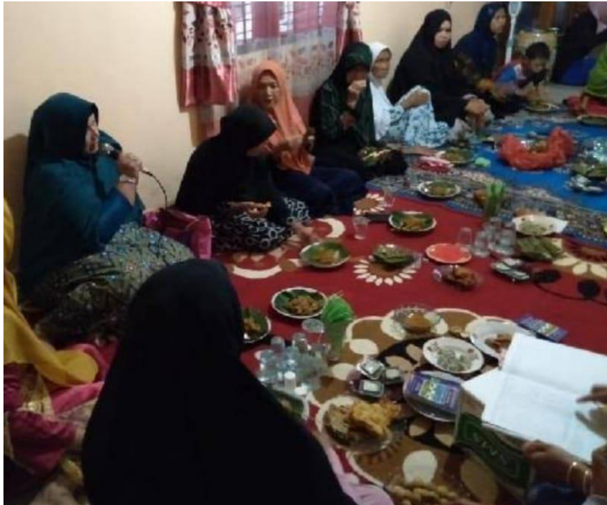
Program arisan yang digelar di rumah salah satu jamaah Majelis Taklim Sirojul