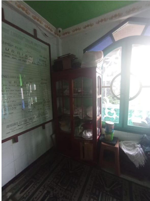
Lemari khusus mukena dan beberapa barang lain