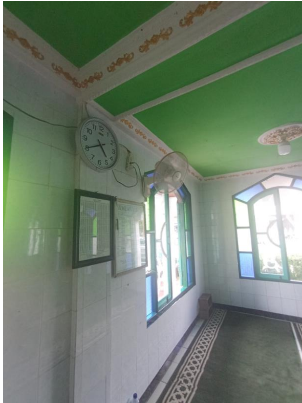
Beberapa fasilitas yang terdapat pada Mushola Sirojul Huda