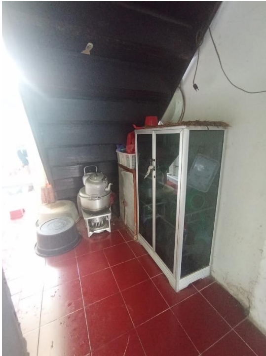
Area dapur Mushola Sirojul Huda