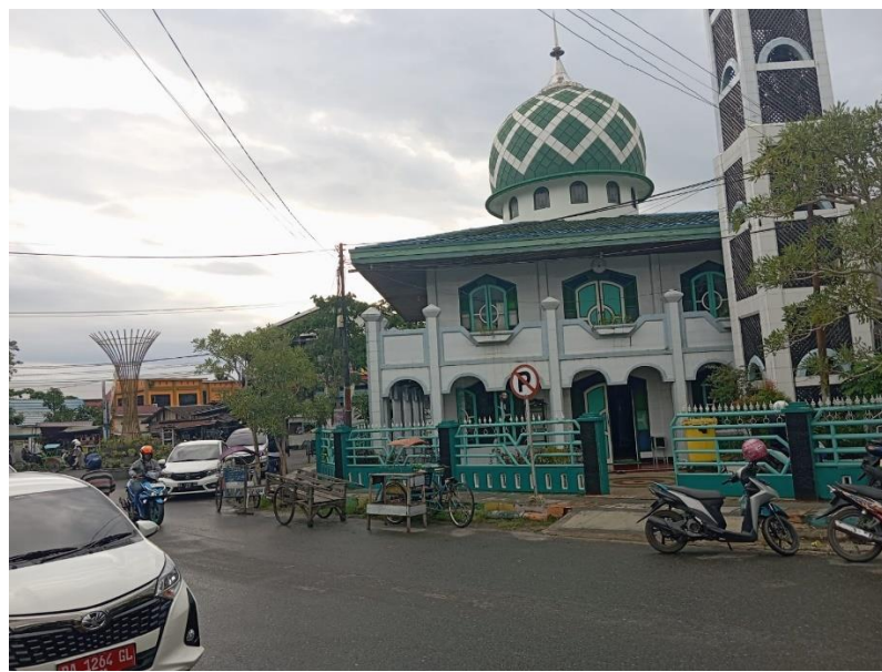
Lingkungan Sekitar Mushola Sirojul Huda