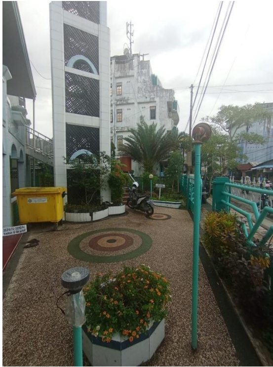
Halaman depan Mushola Sirojul Huda