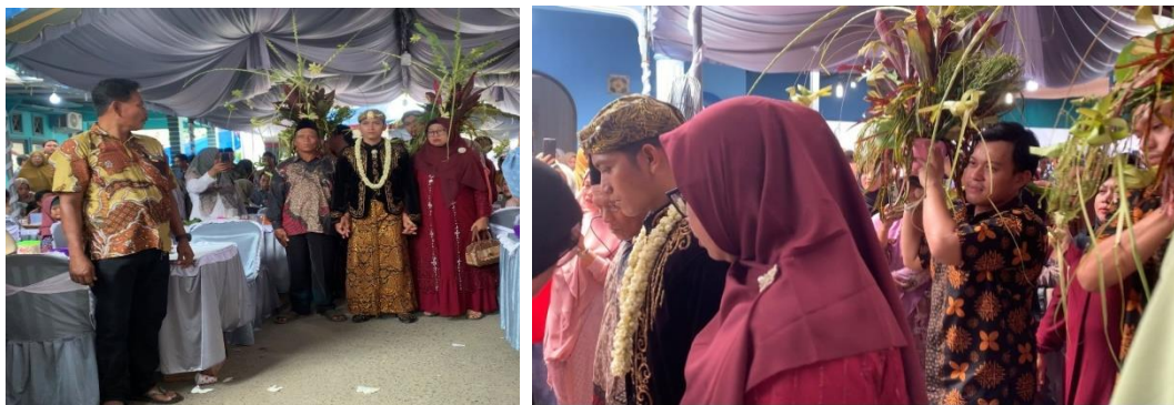
Gambar 1.4 (Pengantin Putra berjalan ke hadapan Pengantin Putri)