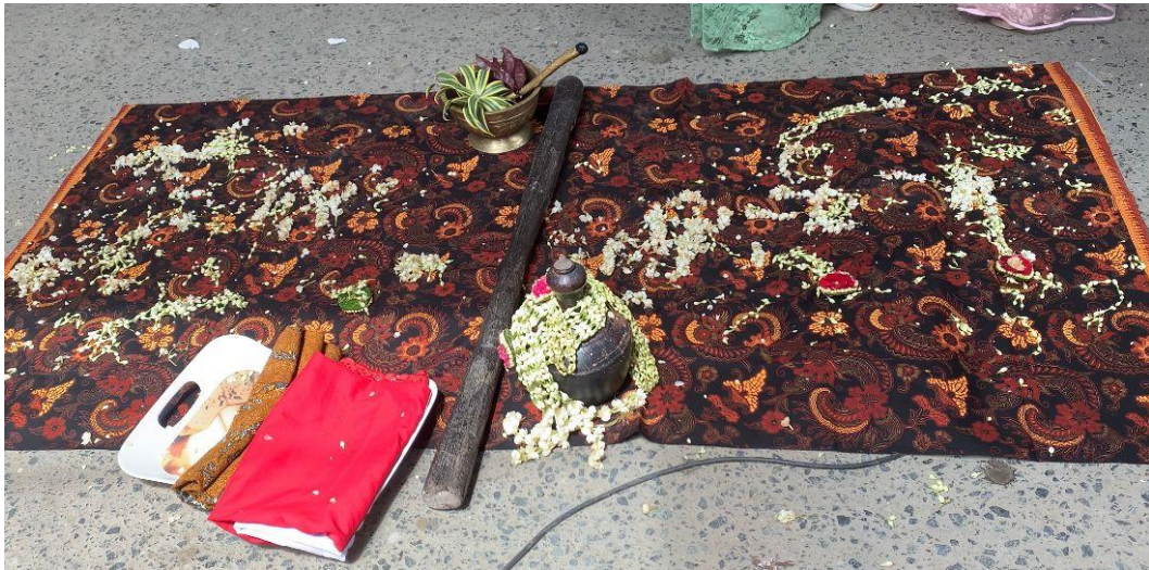
Gambar 1.1 (Peralatan dalam Ritual Temu Manten)