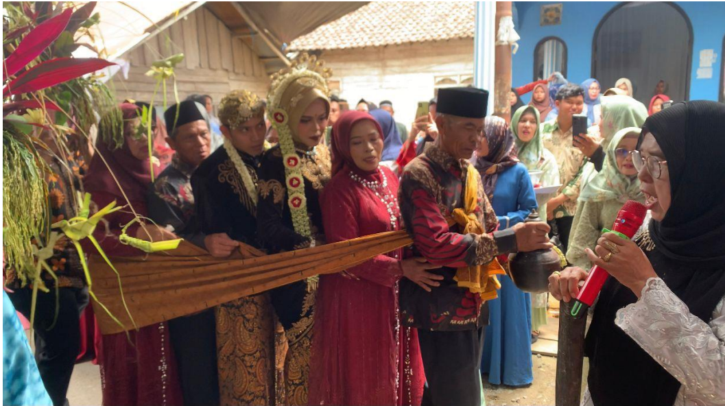
Gambar 1.8 ( Mubeng ping Telu dengan dinyanyikan lagu Lir-Ilir )