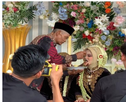
Gambar 1.12 ( Dhahar Klimah , kedua pengantin disuapi Sego Punar )