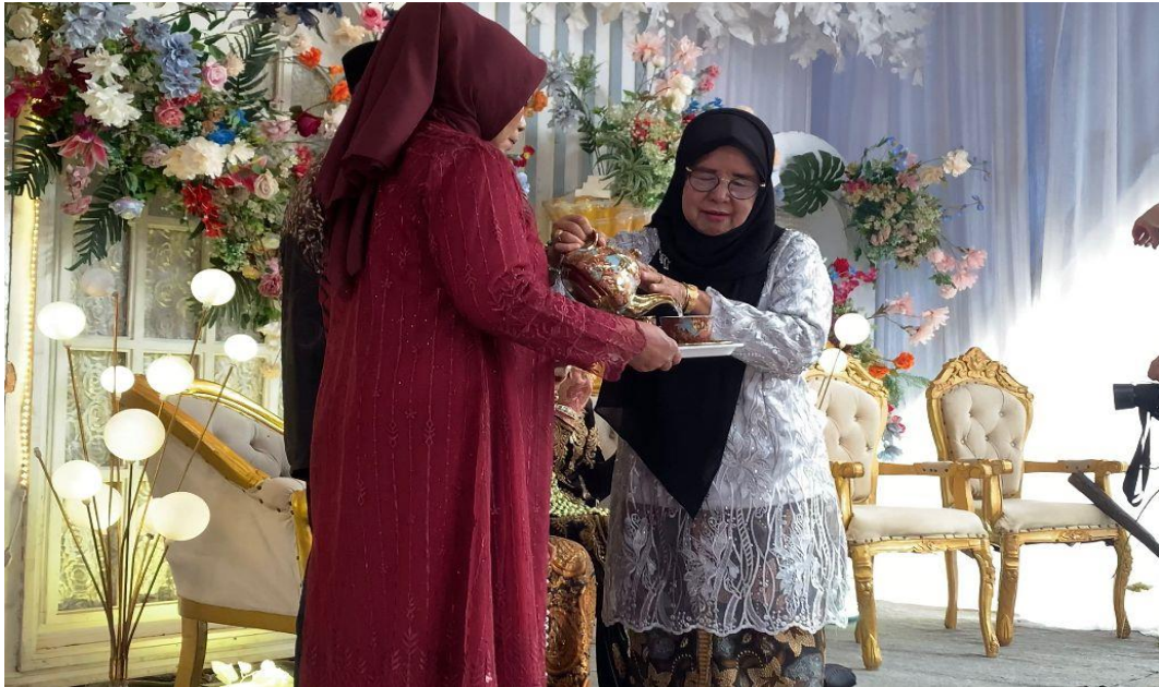
Gambar 1.13 (Setelah disuapi Sego Punar , pengantin diberi minum air burdah)