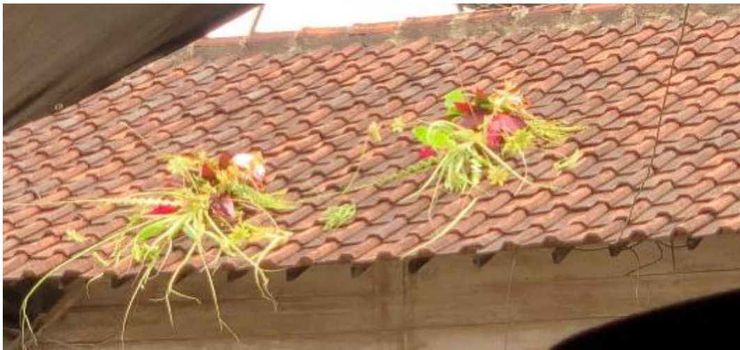
Gambar 1.14 (Setelah ritual selesai, Kembar Mayang dilempar keatas atap rumah)