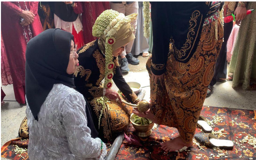
Gambar 1.7 ( Wisuhan , Pengantin Putri membasuh kaki Pengantin Putra)