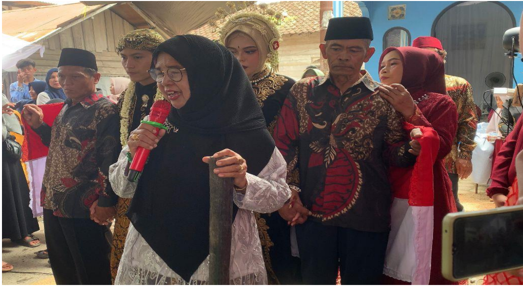
Gambar 1.10 ( Sinduran , pengantin dibawa ke pelaminan oleh orangtua mereka)