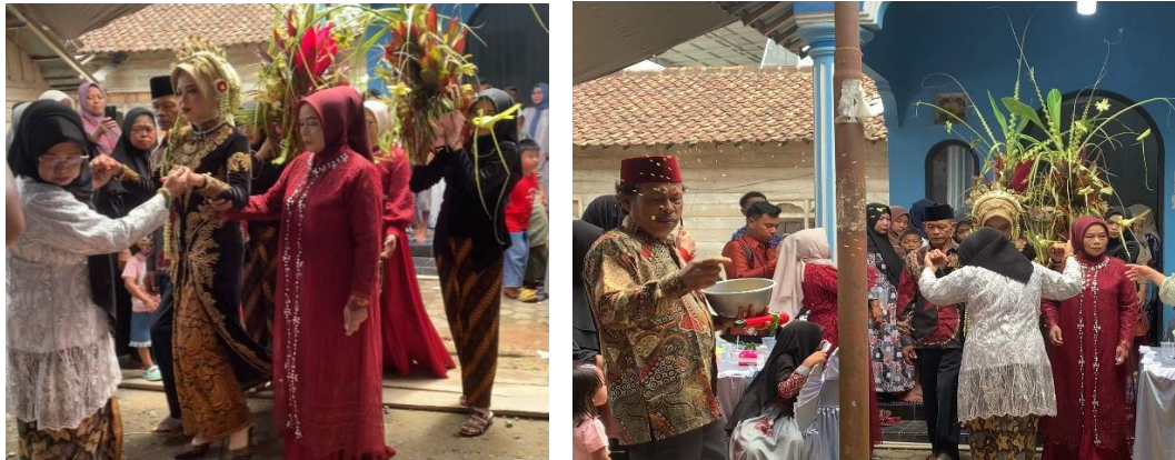
Gambar 1.3 ( Mijil , Pengantin Putri berjalan ke tempat ritual diiringi Kacar Kucur )