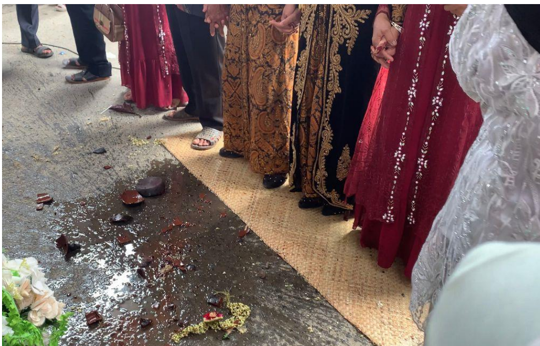
Gambar 1.9 (Pecah Kendi, yang memecahkan adalah Ayah dari Pengantin Putri)