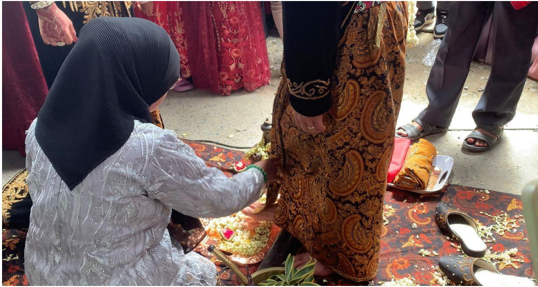
Gambar 1.6 ( Mecah Wiji dadi , Pengantin Putra menginjak telur)