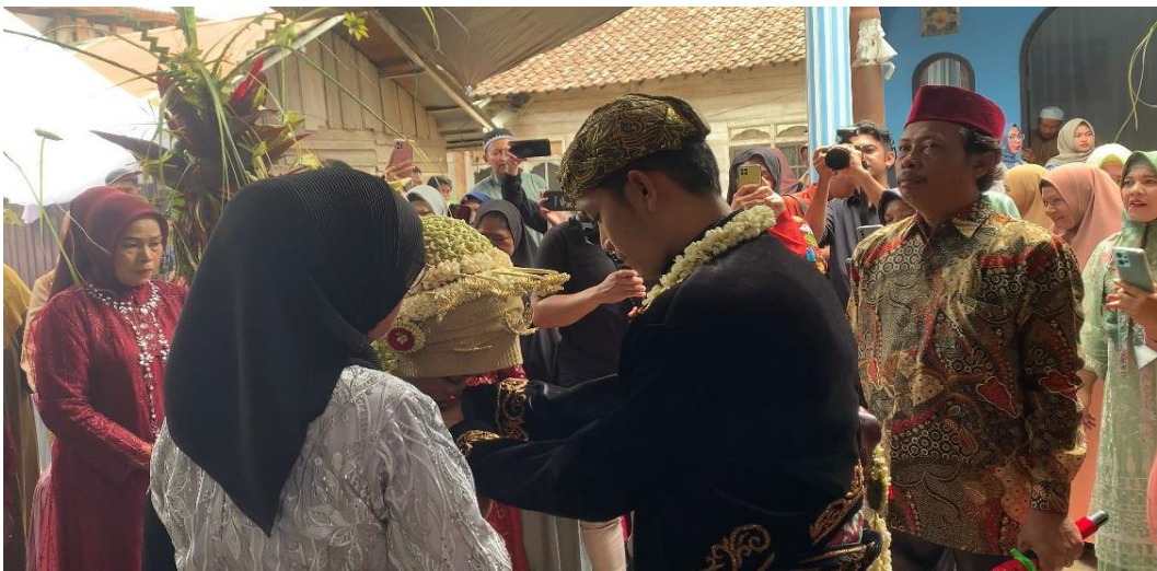
Gambar 1.5 (Sungkeman antara Pengantin Putri dengan Pengantin Putra)