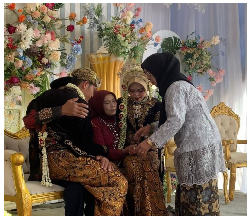
Gambar 1.11 ( Pangkon Timbang , kedua pengantin dipangku secara bergantian)