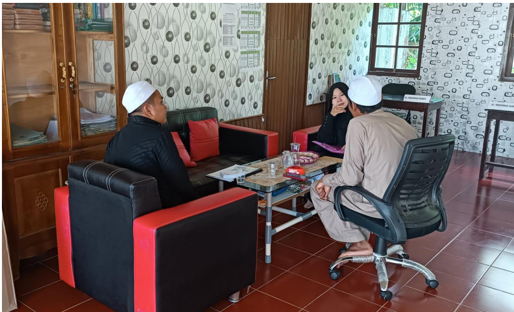
Dokumentasi wawancara bersama pembimbing