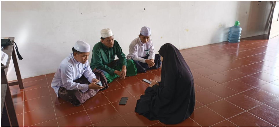
Dokumentasi wawancara bersama santri