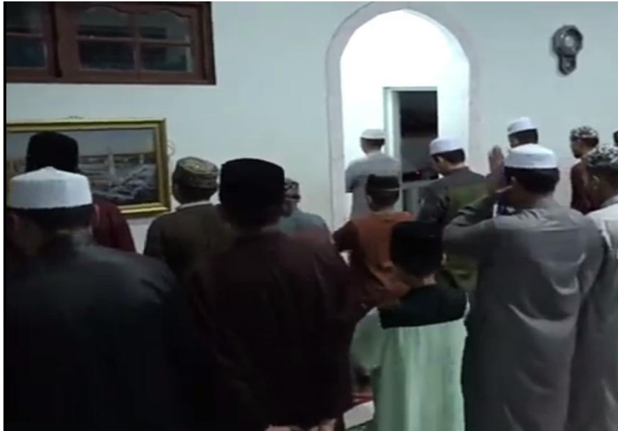
Dokumentasi sholat berjama'ah di Mushola