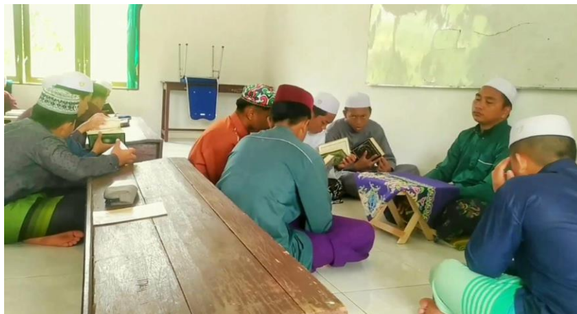
Dokumentasi bimbingan menghafal Al-Qur'an

“Bila kada hafal ayat yang sudah di tentukan untuk dihafal maka santri ini diberikan sanksi untuk terus mengulang hafalannya sampai inya hafal agar santri ni dapat disiplin dan terbiasa dalam menghafalkan Al-Qur'an dengan baik dan benar.” 39