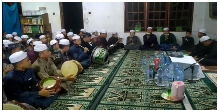
Dokumentasi kegiatan maulid habsy

Metode yang digunakan dalam bimbingan dzikir dan sholawat di pondok pesantren ini yaitu metode demonstrasi, keteladanan dan pembiasaan.