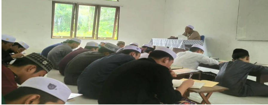
Dokumentasi belajar kitab kuning

dan mampu mempraktikan dalam membaca kitab kuning tersebut dengan baik dan benar. Maka diperlukan dengan kesungguhan dan konsentrasi ketika dalam pembelajaran kitab dasar ini sehingga mampu membaca dan mudah memahami kitab-kitab yang tinggi.” 44