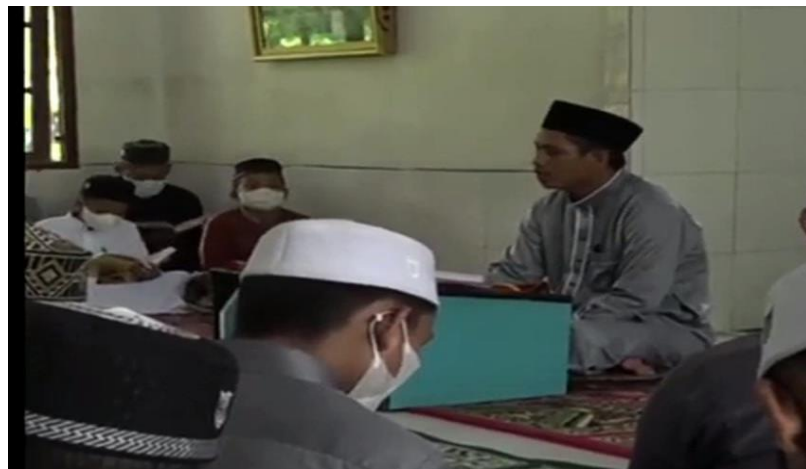
Dokumentasi bimbingan tilawah Al-Qur'an

“Saya pilih satu maqra (ayat dan surah pilihan) yang saya gunakan khusus untuk belajar tilawah naghah Al-Qur'an ini yaitu surat Ali-Imron ayat 144-148. Satu maqra ini akan diterapkan tujuh 7 macam naghah lengkap dengan cabang-cabangnya dari tingkatan nada bayyati, hijaz, nahwand, rast, sika, shaba dan jiharkah.” 41