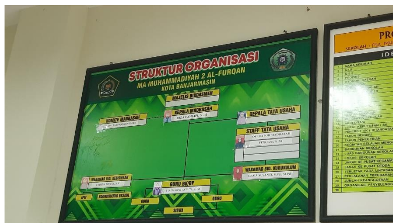
Struktur Organisasi MA Al-Furqan Banjarmasin