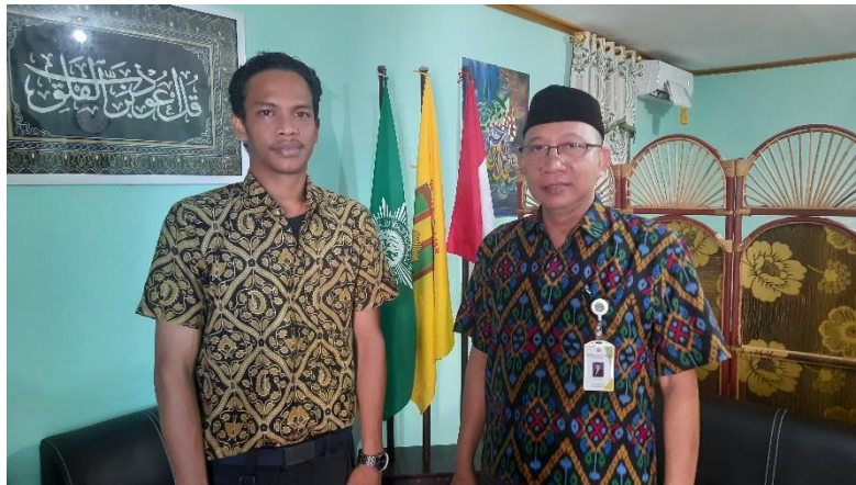
Foto bersama dengan Kepala Madrasah MA Al-Furqan Banjarmasin