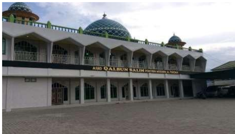
Masjid Bersama Yayasan Pondok Pesantren Al-Furqan Banjarmasin