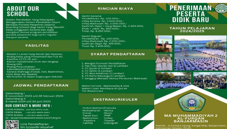
Brosur Penerimaan PPDB