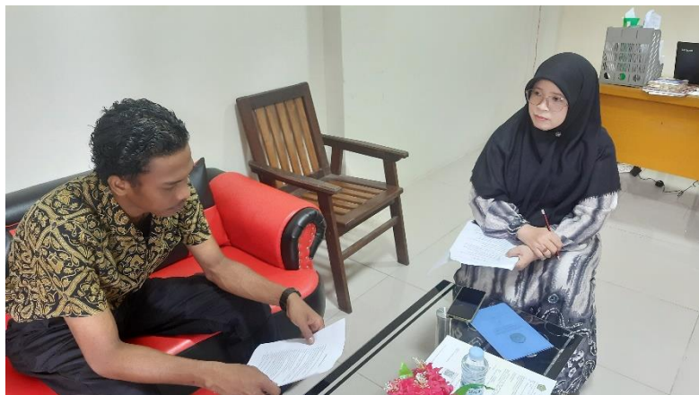
Wawancara dengan Wakil Kepala Madrasah Bidang Kurikulum