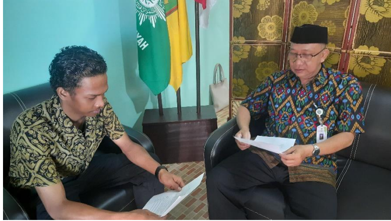
Wawancara dengan Kepala Madrasah MA Al-Furqan Banjarmasin