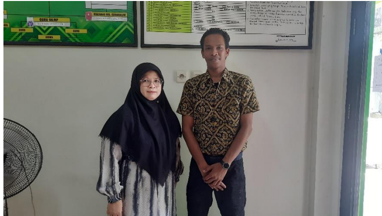
Foto bersama dengan Wakil Kepala Madrasah Bidang Kurikulum