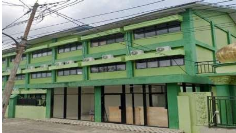
Gedung Sekolah MA Al-Furqan Banjarmasin