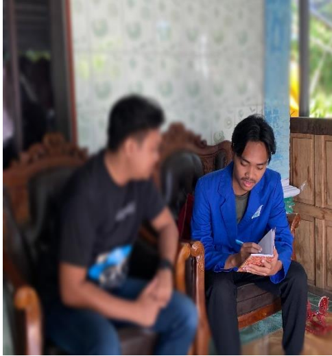
Wawancara dengan WR