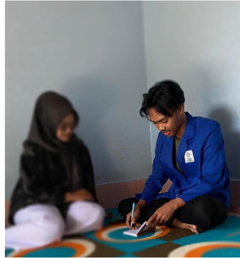
Wawancara dengan NY