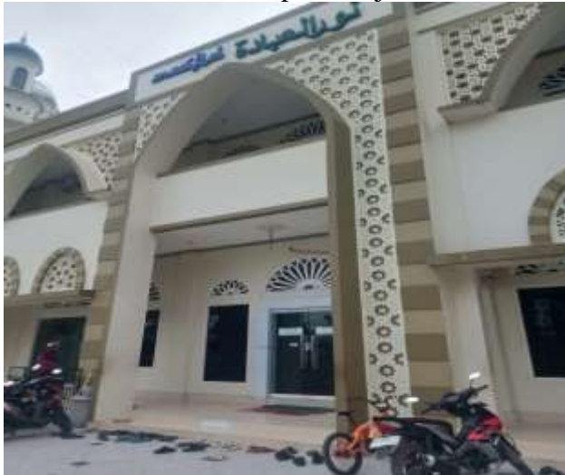
Gambar 4.1 halaman depan masjid nurul ibadah

Keberadaan yayasan ini menunjukkan peran penting masjid dalam mendukung pendidikan dan pembangunan jama'ah di sekitarnya. 1