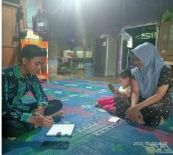
(Wawancara dan dokumentasi dengan SH pada tanggal 7 Oktober 2022 pada jam 15:24 di rumah orang tua responden)