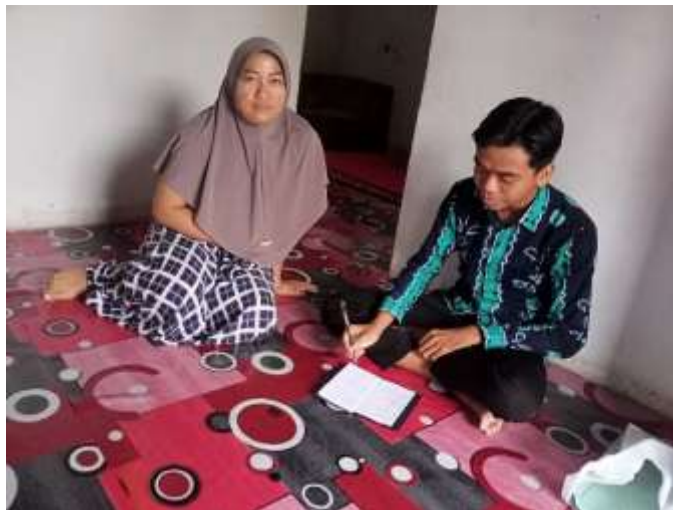
(Wawancara dan dokumentasi dengan RH pada tanggal 7 Oktober 2022 pada jam 11:10 di rumah responden)