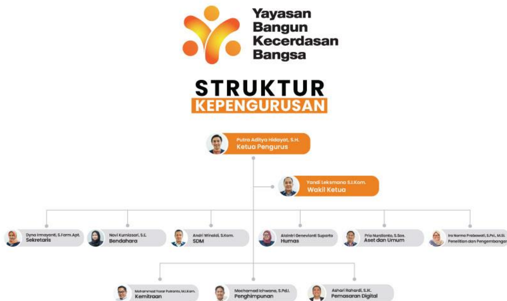
Gambar 4.1 Bagan Struktur Kepengurusan YBKB