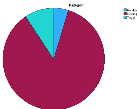
Gambar 4.3 Diagram Responden Berdasarkan Hasil Uji Kategorisasi Kestabilan Emosi Secara Umum

Dari tabel dan diagram kategorisasi tersebut, dapat disimpulkan bahwa ada 2 orang ibu rumah tangga atau 4,7% responden yang memiliki kestabilan emosi rendah, 37 orang atau 86% berada pada kategori sedang dan 4 orang atau 9,3% yang memiliki kategori kestabilan emosi tinggi.