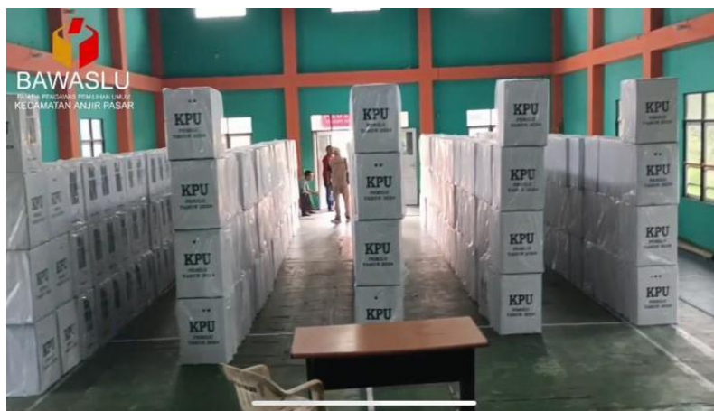
gambar 4. 27 pengawasan terhadap kelayakan kotak suara