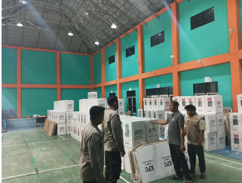
gambar 4. 29 pengawasan terhadap kotak suara yang telah di bawa dari TPS

telah di segel kembali agar tidak adanya kecurangan pada saat kotak masih belum di kembalikan ke kabupaten.