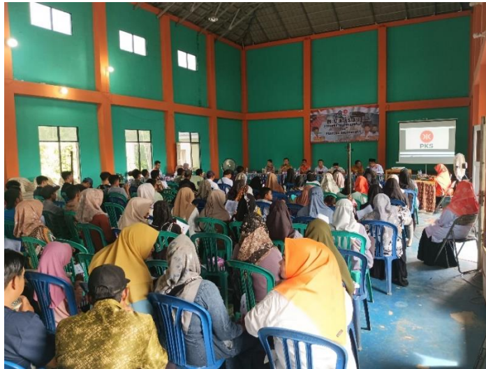
gambar 4. 16 pengawasan terhadap bimbingan dan perekrutan saksi