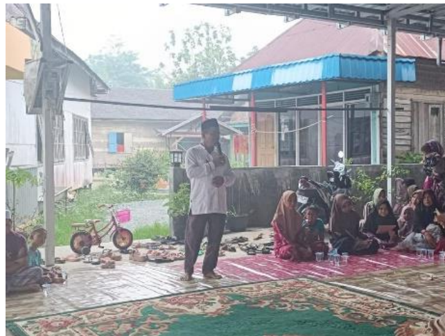
gambar 4. 9 pengawasan terhadap seorang caleg yang melakukan sosialisasi

Reses adalah masa di mana seorang anggota legeslatif melakukan kunjungan kerja baik secara individu maupun kelompok untuk menyerap aspirasi masyarakat sekaligus melakukan sosialisasi tanpa adanya unsur ajakan (kampanye)