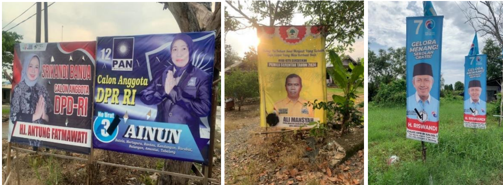
gambar 4. 8 pada tiga gambar di atas adalah contoh pelanggaran APK yang telah di beri teguran