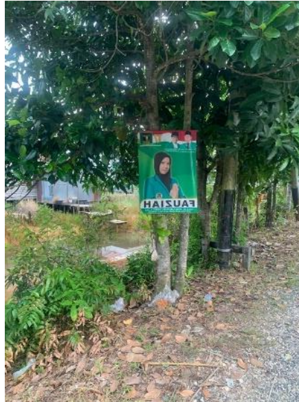
gambar 4. 4 foto pelanggaran terhadap pemasangan APK

Berdasarkan gambar di atas adalah contoh pelanggaran yang terjadi. Adapun pelanggannya adalah berupa penempelan APK (alat peraga kampanye) yang tidak sesuai dengan ketentuan.