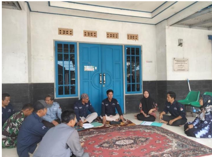
gambar 4. 19 sosialisasi kepada masyarakat akan pentingnya kesadaran hukum