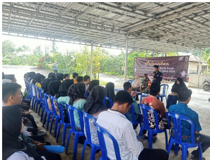
gambar 4. 17 panwascam melakukan pengawasan terhadap pelantikan anggota KPPS