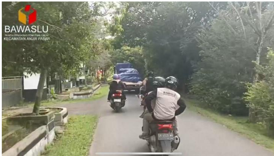
gambar 4. 25 pengawasan perpindahan kotak suara