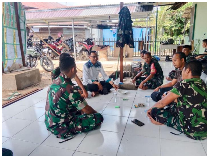
gambar 4. 11 himbauan kepada anggota TNI un tuk tidak ikut berkampanye