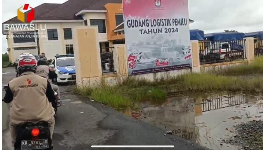
gambar 4. 24 PANWASCAM melakukan pengawasan kotak suara dari gudang logistic