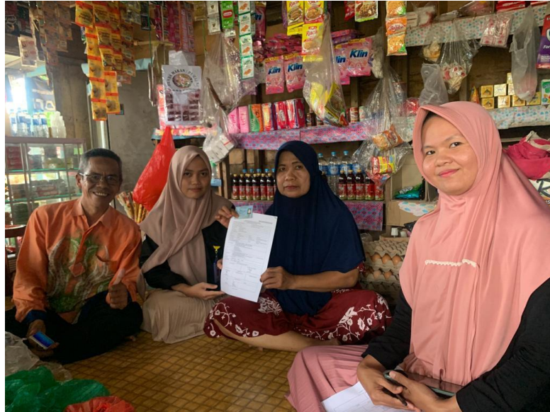
gambar 4. 2 foto ibu korban pengundang-undangnakan identitas secara ilegal