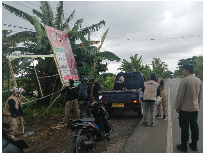
gambar 4. 22 proses pencabutan atribut kampanye yang masih terpasang