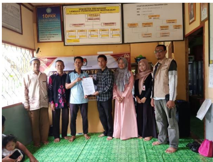
gambar 4. 13 himbauan kepada staf desa untuk tidak ikut berkampanye