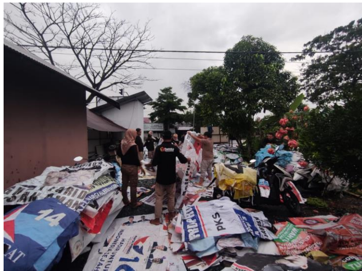
gambar 4. 23 apk yang telah selesai di cabut dan di kumpulkan di kantor PANWASCAM