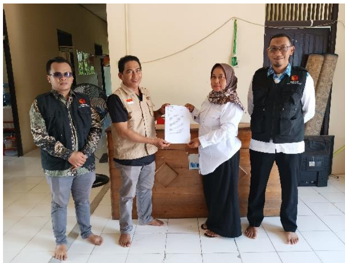
gambar 4. 12 himbauan kepada staf kecamatan untuk tidak ikut berkampanye