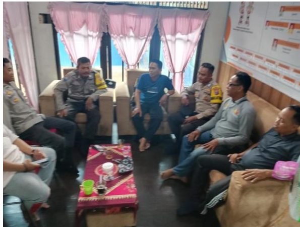
gambar 4. 10 himbauan kepada anggota kepolisiajn untuk tidak ikut berkampanye