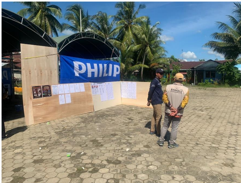
gambar 4. 28 panwascam dan PPS berkoordinasi untuk melakukan pengawasan di TPS