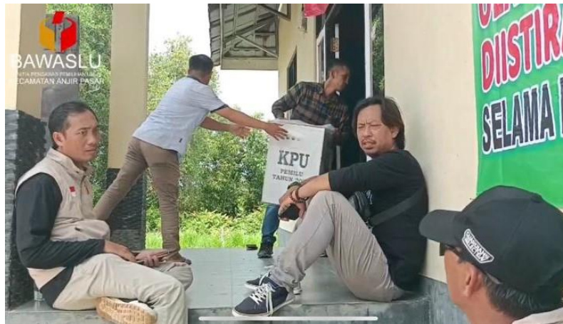
gambar 4. 26 pengawasan terhadap pendistribusian kotak suara