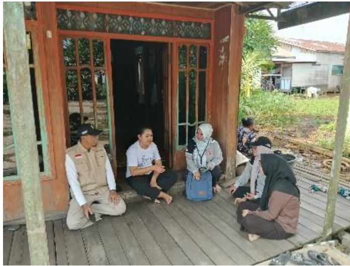
gambar 4. 18 berisi proses survei untuk mengetahui seberapa faham masyarakat akan kesadaran hukum