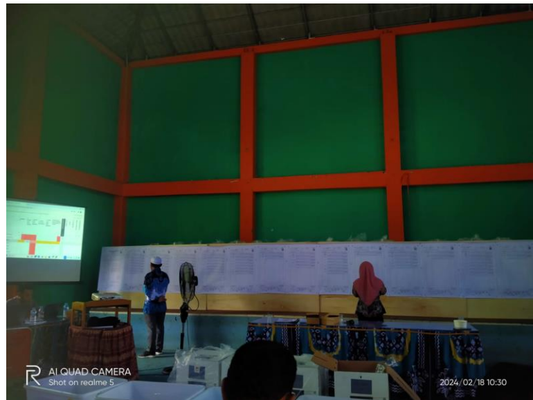
gambar 4. 31 pengawasan rekapitulasi suara