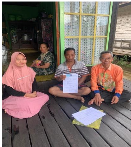
gambar 4. 3 foto bapak-bapak korban penggunaan identitas secara ilegal