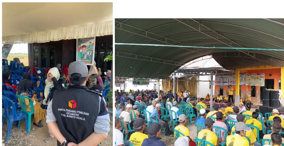
gambar 4. 15 pada dua gambar di atas anggota panwascam melakukan pengawasan terhadap proses kampanye caleg partai PKB dan GOLKAR