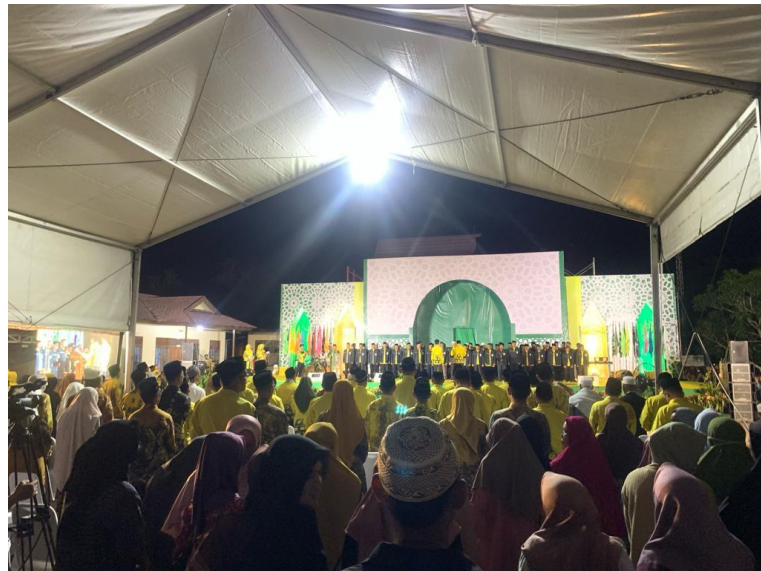
gambar 4. 5 dokumentasi pengawasan acara MTQ

terjadi pelanggaran administrasi maupun pidana sesuai dengan undang-undang yang berlaku. 29