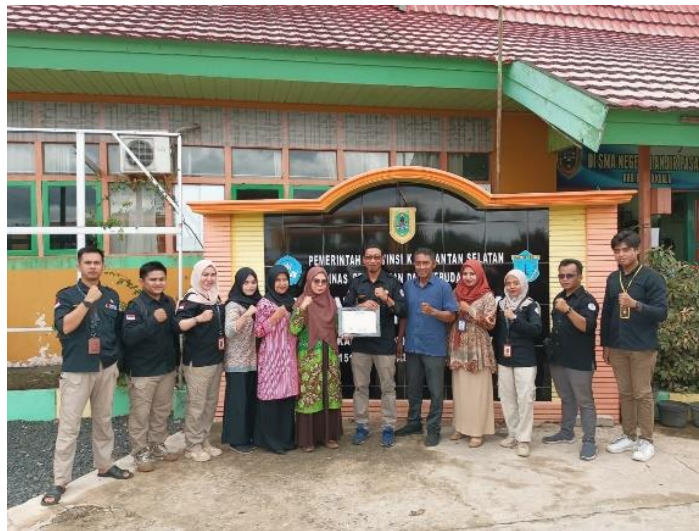
gambar 4. 14 himbauan kepada lembaga pendidikan untuk tidak ikut berkampanye