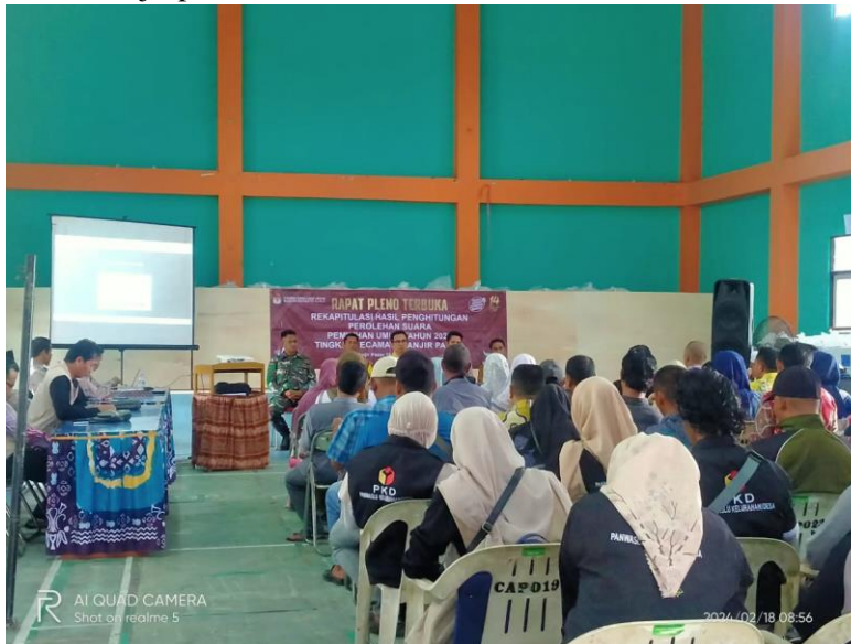
gambar 4. 30 rapat pleno rekapitulasi suara terhadap semua lapisan penyelenggara pemilu