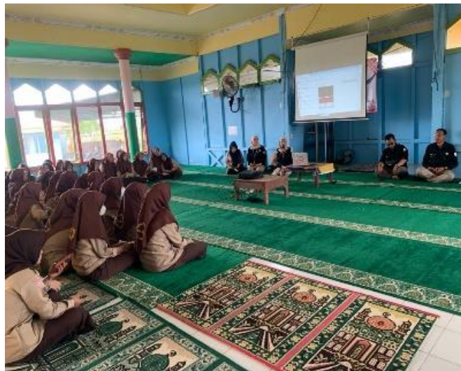
gambar 4. 20 pemberian edukasi terhadap calon pemilih baru