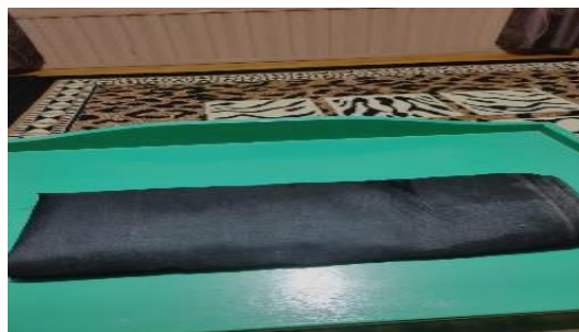
Gambar 4: Salah satu syarat mandi Sembilan yaitu kain hitam

Di dalam mandi Sembilan ini juga menggunakan kain hitam untuk mengeluarkan untalan dan untuk perisai diri. Untuk ukuran kain hitam tidak berbeda dengan ukuran kain kuning sebelumnya yaitu kurang lebih dua meter. Kain ini juga ditutup kan ke sebagian tubuh dari bagian kepala dada sampai ujung jari kaki. 128