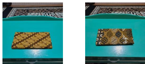
Gambar 5: Tapih Kurung dan Tapih behalai

Selain itu, ada juga mandi Sembilan ini menggunakan kain tapih behalai yang ditutupi dari dada kemudian dilapis kain hitam yang dipasang menutupi kepala yang ukurannya sepanjang badan orang yang mandi tersebut. Tapih yang digunakan ada tapih bahalai ataupun bakurung . 130