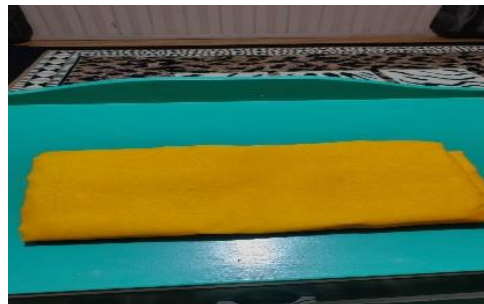
Gambar 3: Salah satu syarat mandi kuning yaitu kain kuning

Ada juga di dalam pelaksanaan mandi Sembilan ini menggunakan kain kuning. Adapun penggunaan kain kuning ini untuk kur semangat seperti mengembalikan semangat. Penggunaan kain kuning ini digunakan disepanjang badan. Biasanya ukurannya setatak atau setara dengan kurang lebih dua meter. Kain ini menutupi dari bagian kepala dada sampai ujung jari kaki. 126