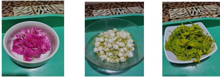
Gambar 1: Jenis-Jenis kembang yang biasa digunakan untuk mandi Sembilan dari sebelah kiri mawar, melati, kenanga.

Berdasarkan penuturan para responden yang pernah melihat pelaksanaan mandi Sembilan untuk menghilangkan untalan ini, dilaksanakan kapan saja menggunakan air kembang. Adapun kembang yang digunakan tidak terbatas jenisnya. Ada yang menggunakan bunga seperti acara mandi-mandi seperti biasa, seperti bunga mawar, bunga melati, bunga kenanga dan bunga kantil.