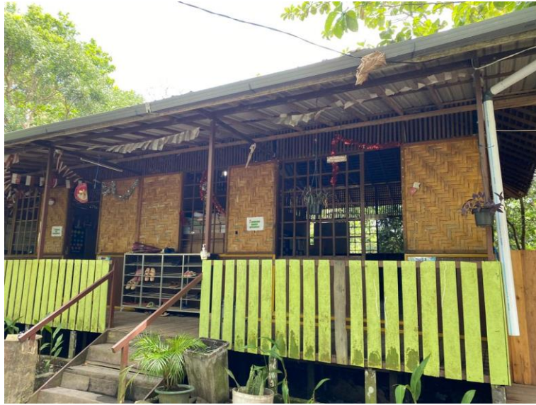
Gambar 10 Ruang Kelas SD Alam Muhammadiyah Banjarbaru