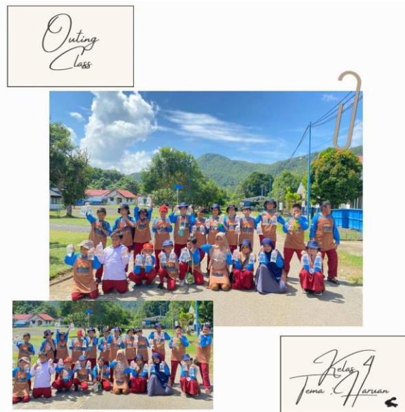
Gambar 13 Program Outing Class