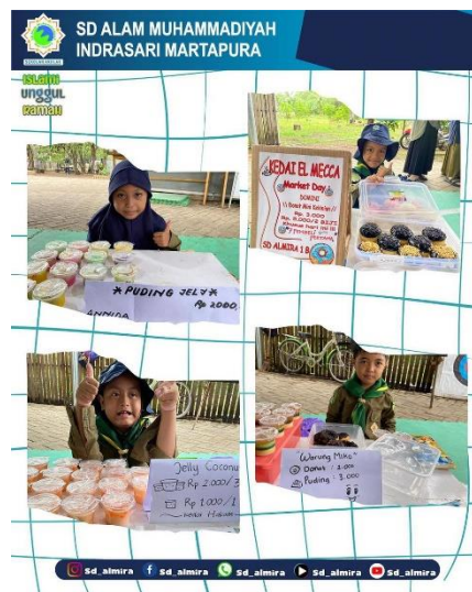
Gambar 14 Program Market Day