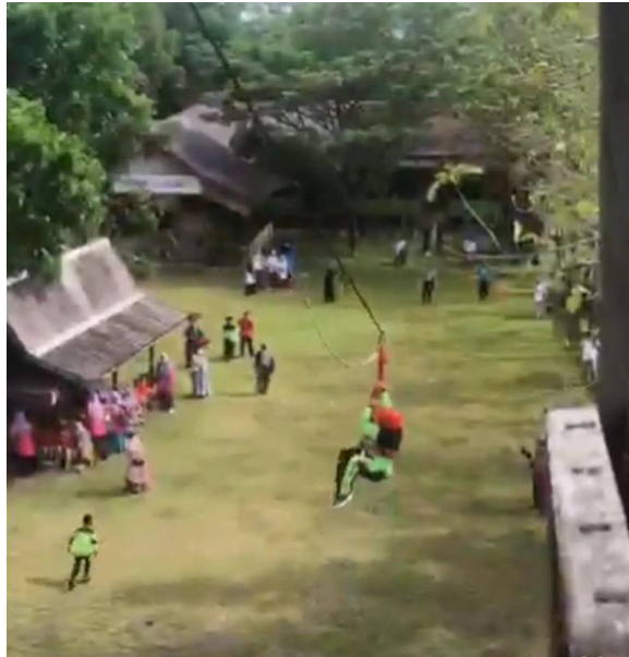
Gambar 8 Outbond SD Alam Muhammadiyah Banjarbaru