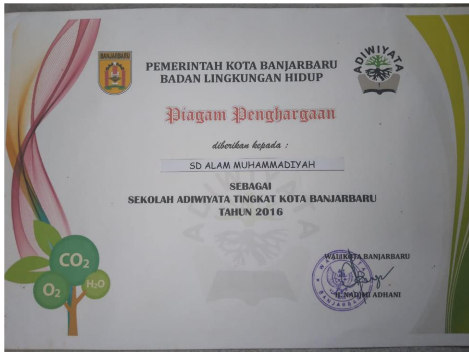
Gambar 18 Penghargaan Sekolah Adiwiyata

Gambar tersebut merupakan penghargaan sekolah adiwiyata kepada SD Alam Muhammadiyah Banjarbaru. Berdasarkan keputusan Gubernur Kalimantan Selatan Nomor 188.44/0299/KUM/2017 pada Penetapan Sekolah Adiwiyata Provinsi Kalimantan Selatan Tahun 2017 SD Alam Muhammadiyah Banjarbaru merupakan salah satu sekolah dasar alam di wilayah kabupaten Banjarbaru yang menerapkan program adiwiyata dengan konsep sekolah alam dari tahun 2017.