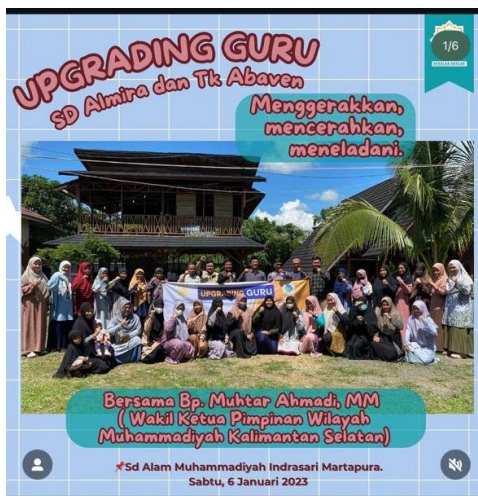
Gambar 22 Kegiatan Upgrading Guru

kemampuan dewan guru lebih mapan dalam menjalankan proses pendidikan khas sekolah alam.