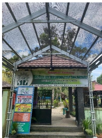
Gambar 3 Pintu Masuk SD Alam Muhammadiyah Banjarbaru

Sekolah dengan nama SD Alam Muhammadiyah (Muhammadiyah Green School) Banjarbaru didirikan pada tanggal 12 Juli 2010 dan diresmikan pada tanggal 19 Juli 2012 oleh Pimpinan Pusat Muhammadiyah Prof. DR. Din Syamsuddin, MA. SD Alam Muhammadiyah (Muhammadiyah Green School) Banjarbaru dinaungi oleh Majelis Pendidikan Dasar dan Menengah Pimpinan Daerah Muhammadiyah Banjarbaru Kalimantan Selatan. Sekarang dibawah Majelis Pendidikan Dasar dan Menengah Pimpinan Cabang Muhammadiyah Landasan Ulin.