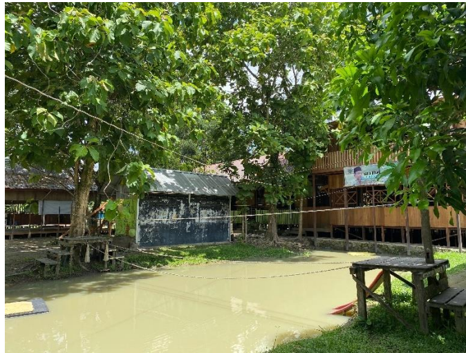
Gambar 4 Lingkungan SD Alam Muhammadiyah Banjarbaru