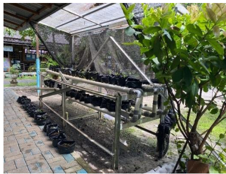
Gambar 6 Lahan Hidroponik SD Alam Muhammadiyah Banjarbaru