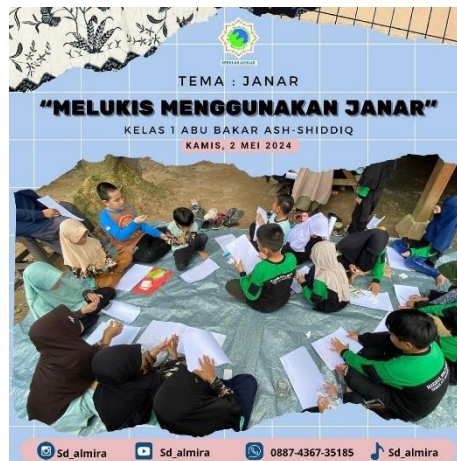
Gambar 16 Kegiatan Mewarnai