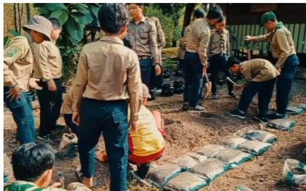
Gambar 9 Gardening SD Alam Muhammadiyah