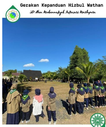
Gambar 15 Kegiatan Kemanduan Hizbul Wathan SD Alam Muhammadiyah Almira

Ekstrakurikuler merupakan kegiatan tambahan di luar jam pelajaran formal yang dirancang untuk mengembangkan minat, bakat, dan keterampilan peserta didik. Kegiatan ini diselenggarakan oleh sekolah dalam berbagai bidang seperti olahraga, seni, sains, teknologi, serta kegiatan sosial dan keagamaan. Ekstrakurikuler memberikan kesempatan bagi peserta didik untuk mengeksplorasi minat pribadi mereka, mengembangkan kemampuan non-akademis, dan membangun keterampilan sosial seperti kerjasama dan kepemimpinan. Selain itu, kegiatan ini juga membantu peserta didik untuk lebih mengenal diri mereka sendiri, meningkatkan rasa percaya diri dan membentuk karakter yang lebih baik. Sebagai sekolah alam yang baru berdiri SD Alam Muhammadiyah Indrasari sudah menyediakan berbagai kegiatan ekstrakurikuler diantaranya sebagai berikut : a) Tapak Suci, b) Angklung, c) Mewarnai, d) Qiro'ah , e) Memanah, f) Presenter, dan g) Kemanduan Hizbul Wathan.