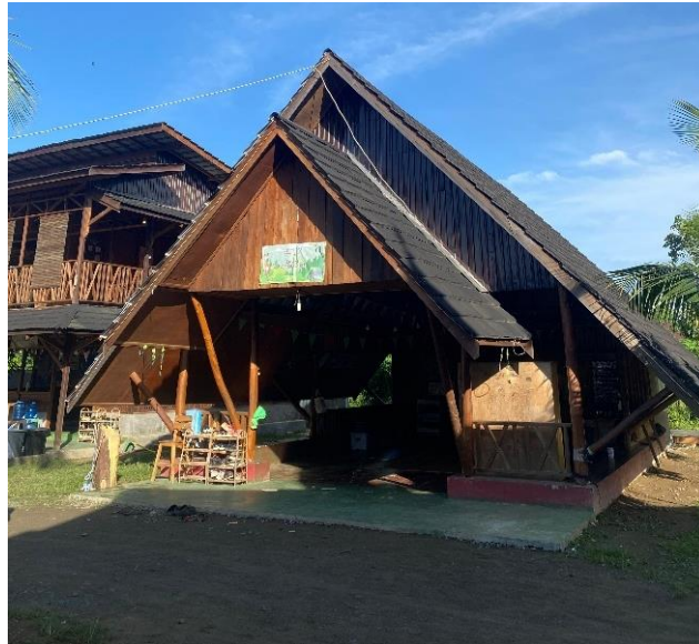
Gambar 12 Ruang Kelas SD Alam Muhammadiyah Indrasari

dengan tujuan untuk membentuk karakter peserta didik yang peduli dan bertanggung jawab terhadap alam. Pembelajaran disekolah alam biasanya dilakukan diluar ruangan, seperti di kebun, hutan, atau sungai, yang memungkinkan peserta didik berinteraksi langsung dengan lingkungan.