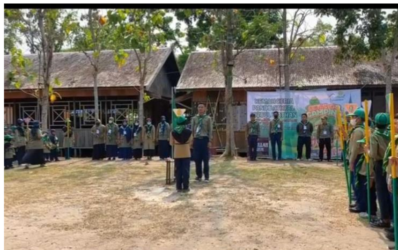
Gambar 5 Kepanduan Hizbul Wathan SD Alam Muhammadiyah Banjarbaru

Untuk melatih kemampuan kerjasama dan kepemimpinan diri, sekolah mewajibkan kepada seluruh siswa mengikuti kegiatan Kepanduan Hizbul Wathan setiap pagi Jum’at pada pukul 08.00 s.d 09.00 wita dan kegiatan outbond dilaksanakan 2 pekan sekali pada jam pembelajaran olahraga.