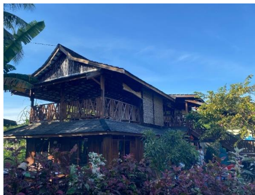
Gambar 11 Kantor SD Alam Muhammadiyah Indrasari

belum dimanfaatkan secara maksimal, yakni pada awalnya digunakan untuk lahan pertanian, kemudian diubah menjadi sebuah sekolah oleh kepala sekolah saat ini yaitu Ustadz Firman Hadi bersama rekan-rekan menjadi sebuah sekolah dengan konsep alam. Alasan utamanya adalah untuk memberikan tampilan baru dalam dunia pendidikan Muhammadiyah di kabupaten Banjar dan juga untuk memajukan Amal Usaha Muhammadiyah. 76