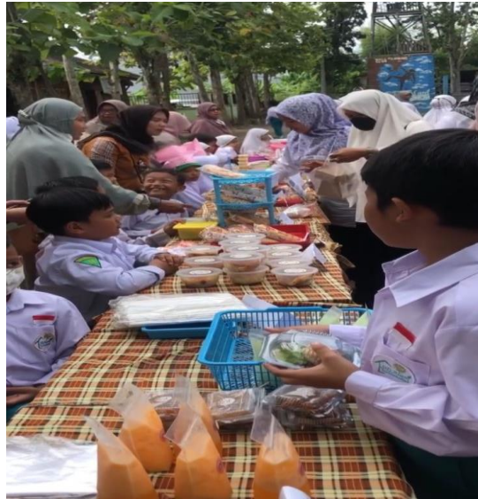
Gambar 7 Dokumentasi Market Day