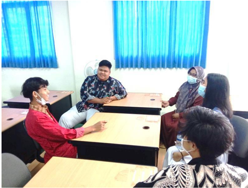
Foto 3: Wawancara dengan Peserta Didik SMA Negeri 2 Samarinda, Pada Selasa, 15 Juni 2021