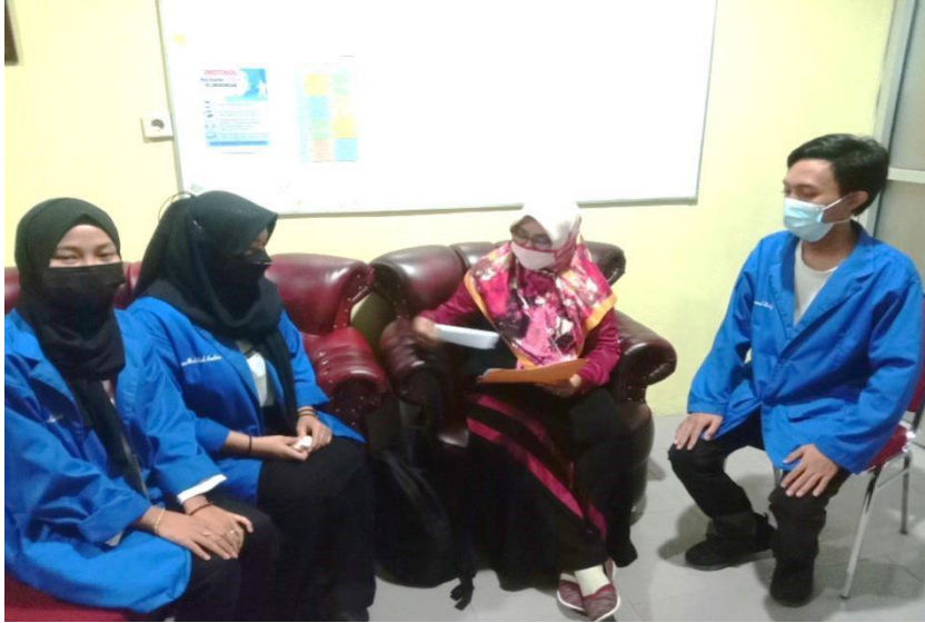
Foto 5: Wawancara dengan Peserta Didik SMK Negeri 4 Samarinda, Pada Kamis, 17 Juni 2021