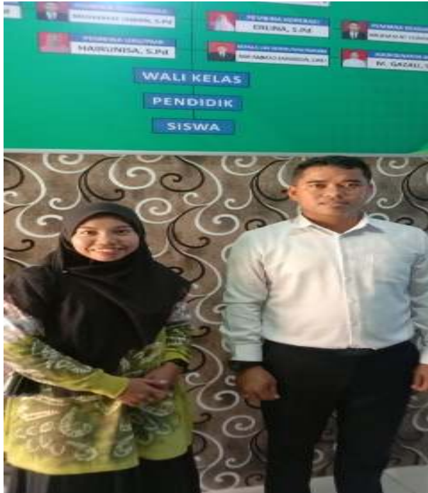
Foto Bersama Kepala Sekolah MTS Raudatul Jannah Kotabaru