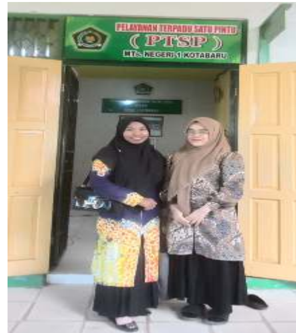
Foto Bersama Guru MTSN 2 Kotabaru

DOKUMENTASI Penelitian di MTSN 2 Kotabaru