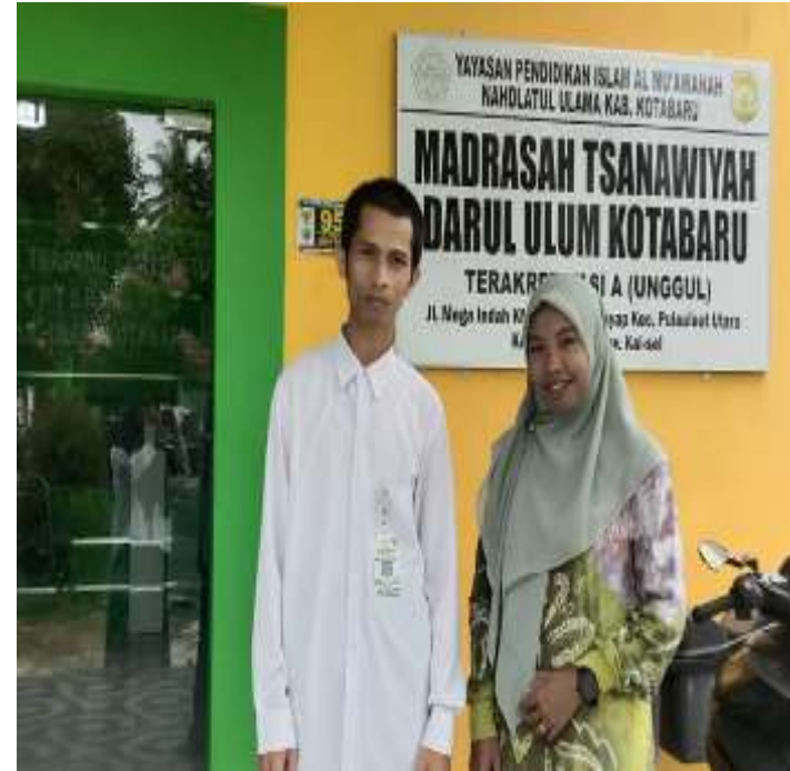
Foto Bersama Guru MTS Darul Ulum Kotabaru