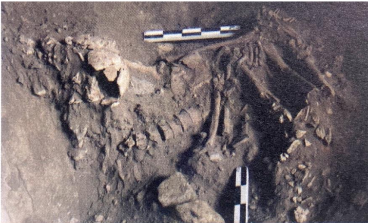
Temuan Rangka di Gunung Batu Buli

Memang, tak semuanya gua-gua itu layak huni bagi manusia purba. Alasannya adalah ketersediaan bahan makanan. Maklum, cara hidup manusia purba masih mengumpulkan makanan.