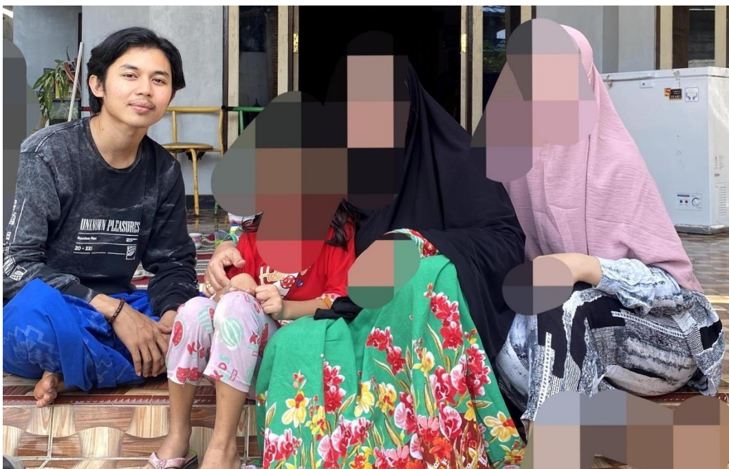
Wawancara dengan SYL. Wanita yang menunjuk dalam perkawinan