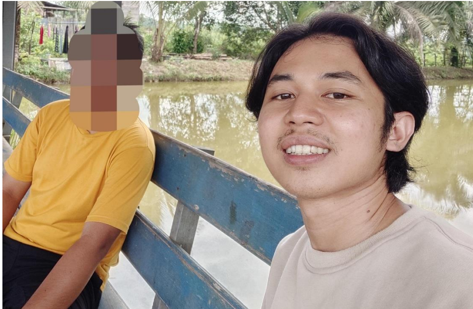
Wawancara dengan A.R. laki laki yang di tunjuk oleh wanita hamil