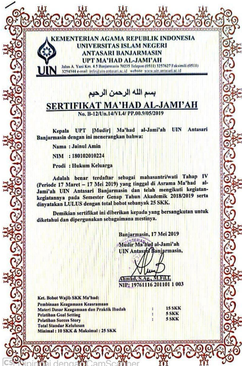
Lampiran 12. Sertifikat Ma'had Al-Jami'ah