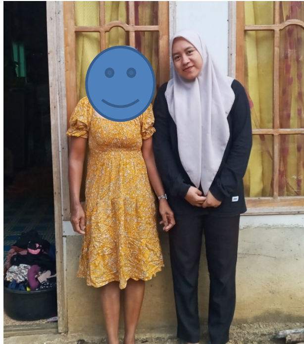
(Wawancara dengan Ibu Nn)