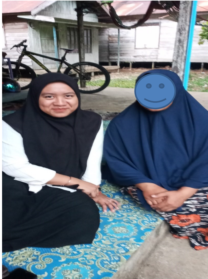
(Wawancara dengan Ibu Hr)