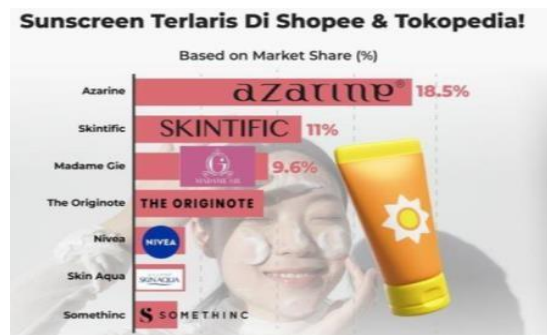
Gambar 1. 1 Penjualan Sunscreen 2023