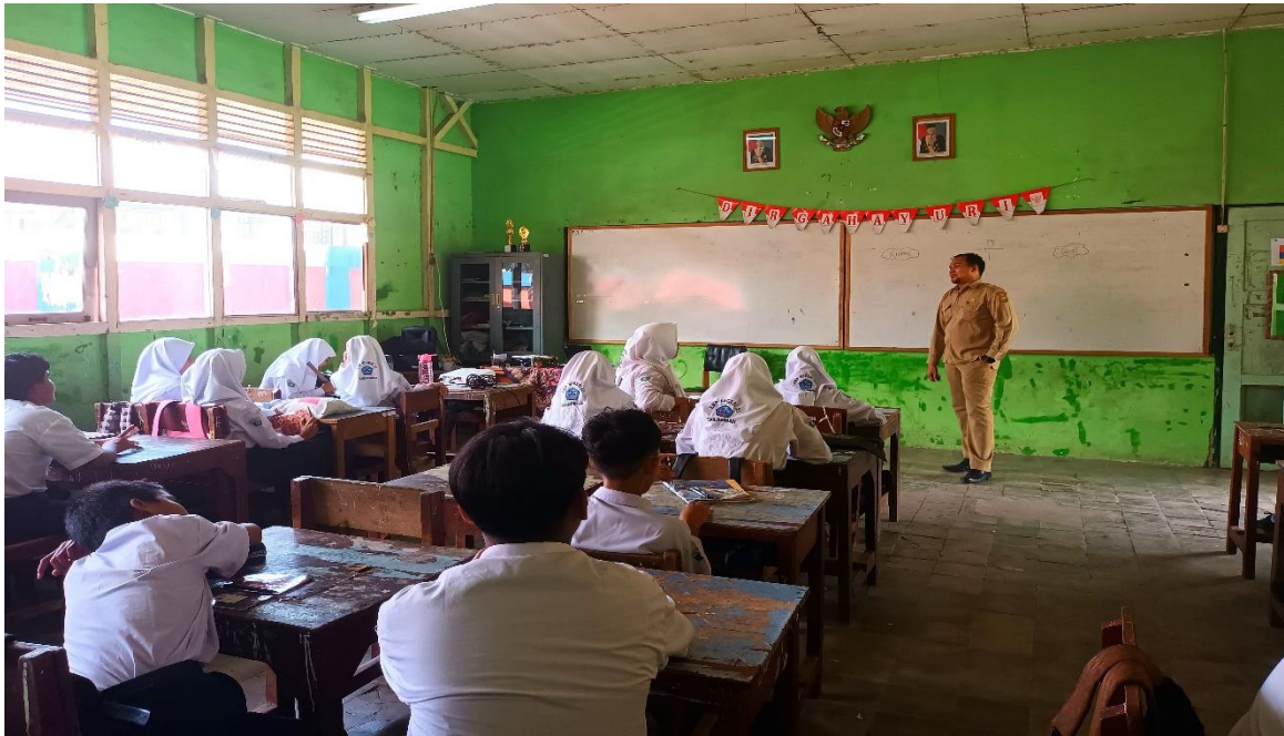
Kegiatan Pembelajaran PAI & BP di SMP Negeri 23 Banjarmasin