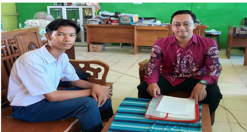
Wawancara dengan siswa kelas VII SMP Negeri 16 Banjarmasin