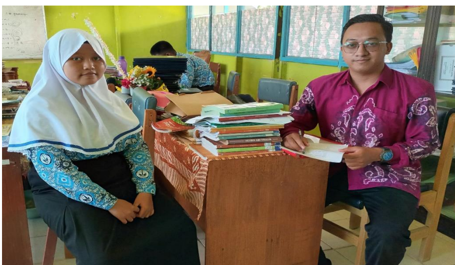
Wawancara dengan siswi SMP Negeri 20 Banjarmasin