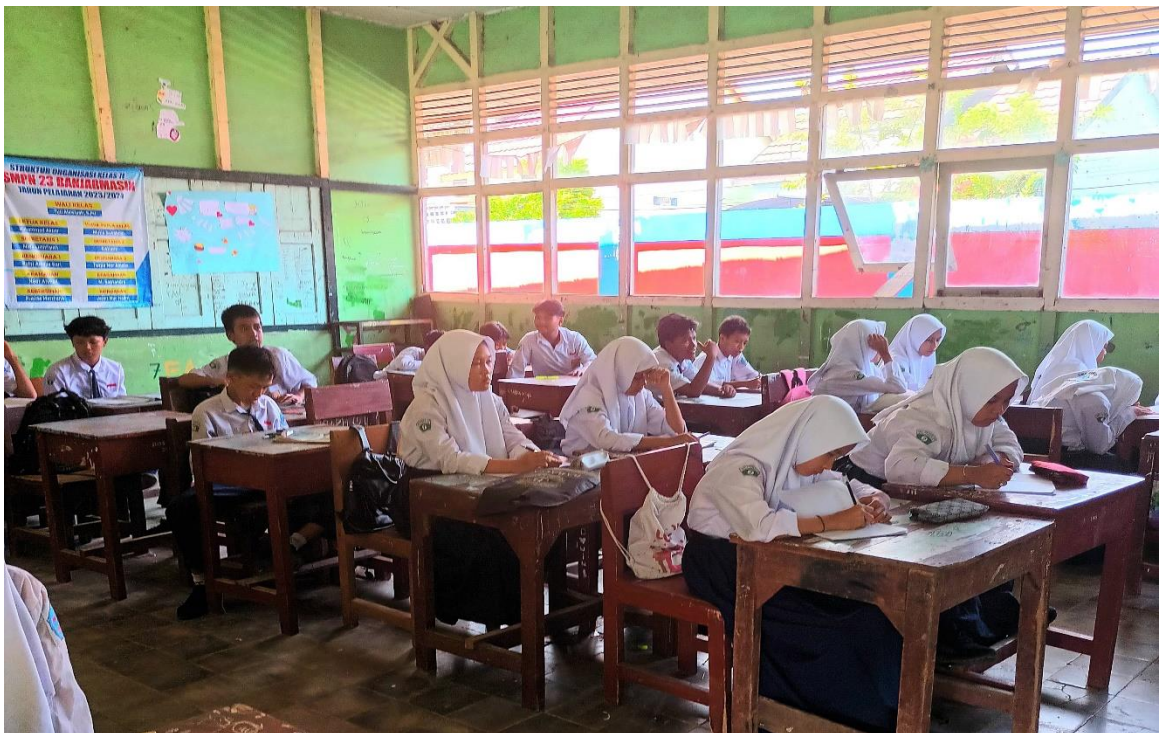
Kegiatan Pembelajaran PAI & BP di SMP Negeri 23 Banjarmasin