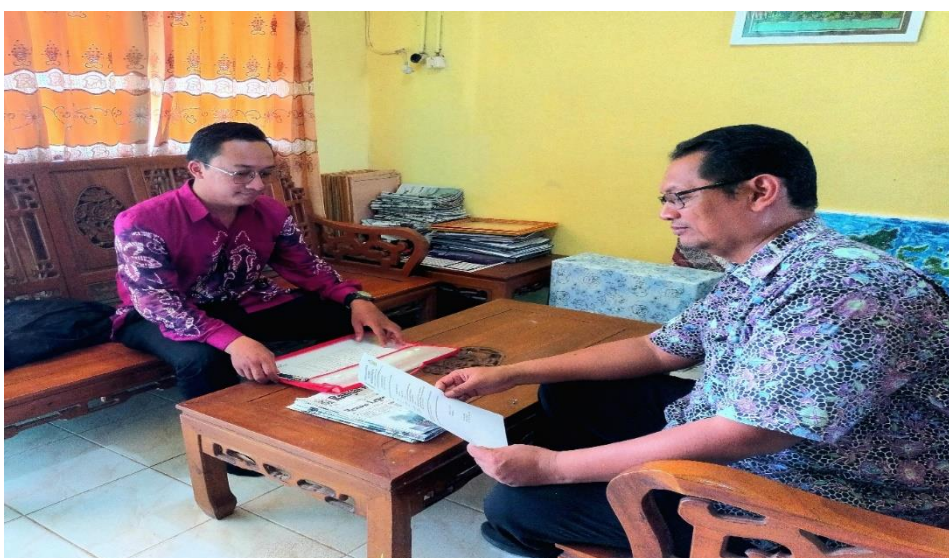
Wawancara dengan kepala sekolah SMP Negeri 16 Banjarmasin