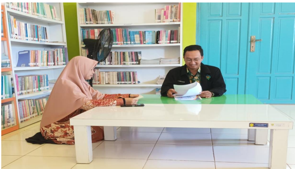
Wawancara dengan guru PAI SMP Negeri 16 Banjarmasin