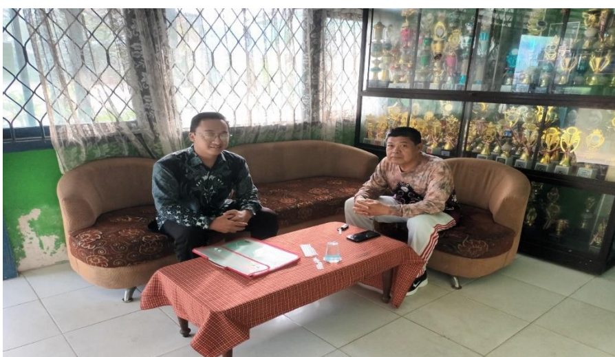
Wawancara dengan kepala sekolah SMP Negeri 20 Banjarmasin