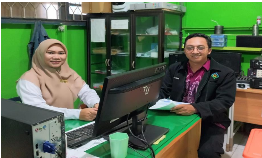
Wawancara dengan guru PAI SMP Negeri 20 Banjarmasin