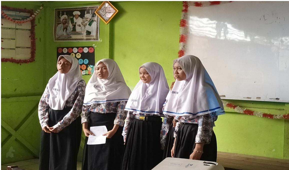
Kegiatan pembelajaran PAI & BP di SMP Negeri 20 Banjarmasin