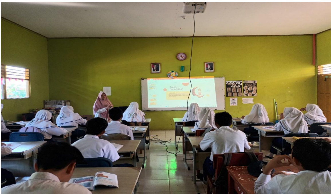
Kegiatan Pembelajaran PAI & BP di SMP Negeri 16 Banjarmasin