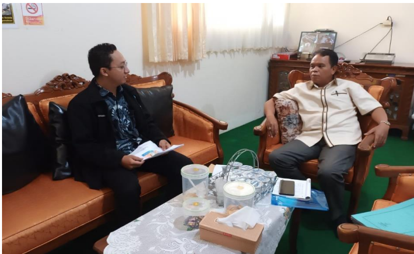
Wawancara dengan kepala sekolah SMP Negeri 23 Banjarmasin