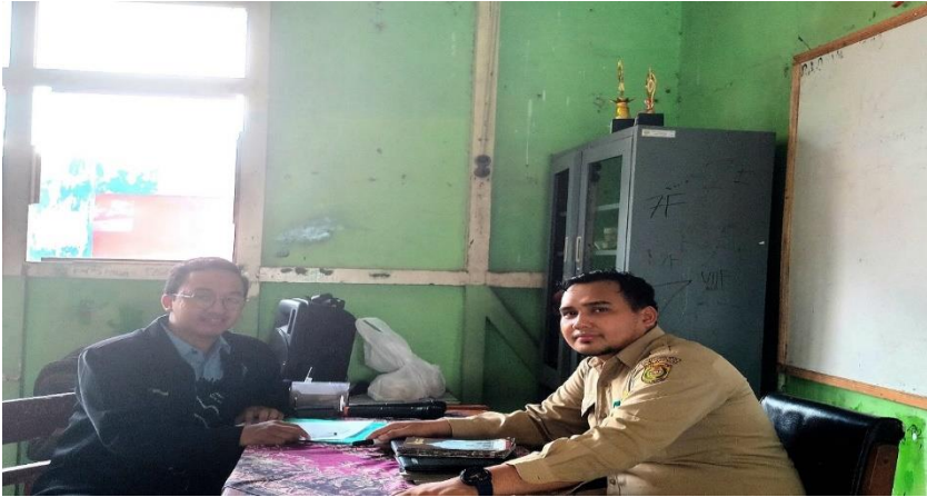
Wawancara dengan guru PAI SMP Negeri 23 Banjarmasin