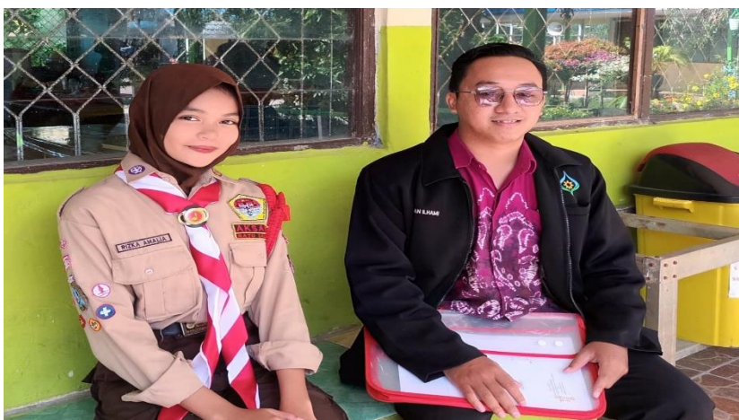
Wawancara dengan siswi SMP Negeri 23 Banjarmasin