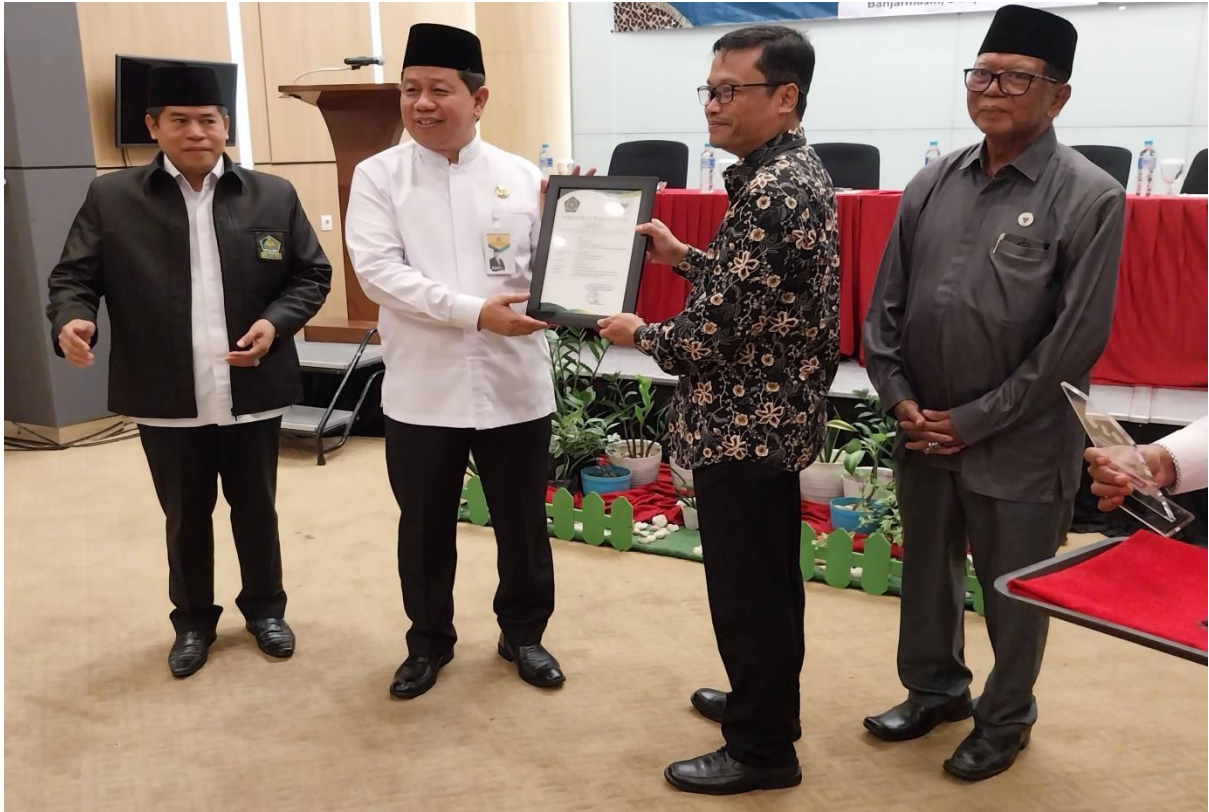
Ikut Bersama Perwakilan BWI Kalsel dalam Rangka Launching Si Gawang