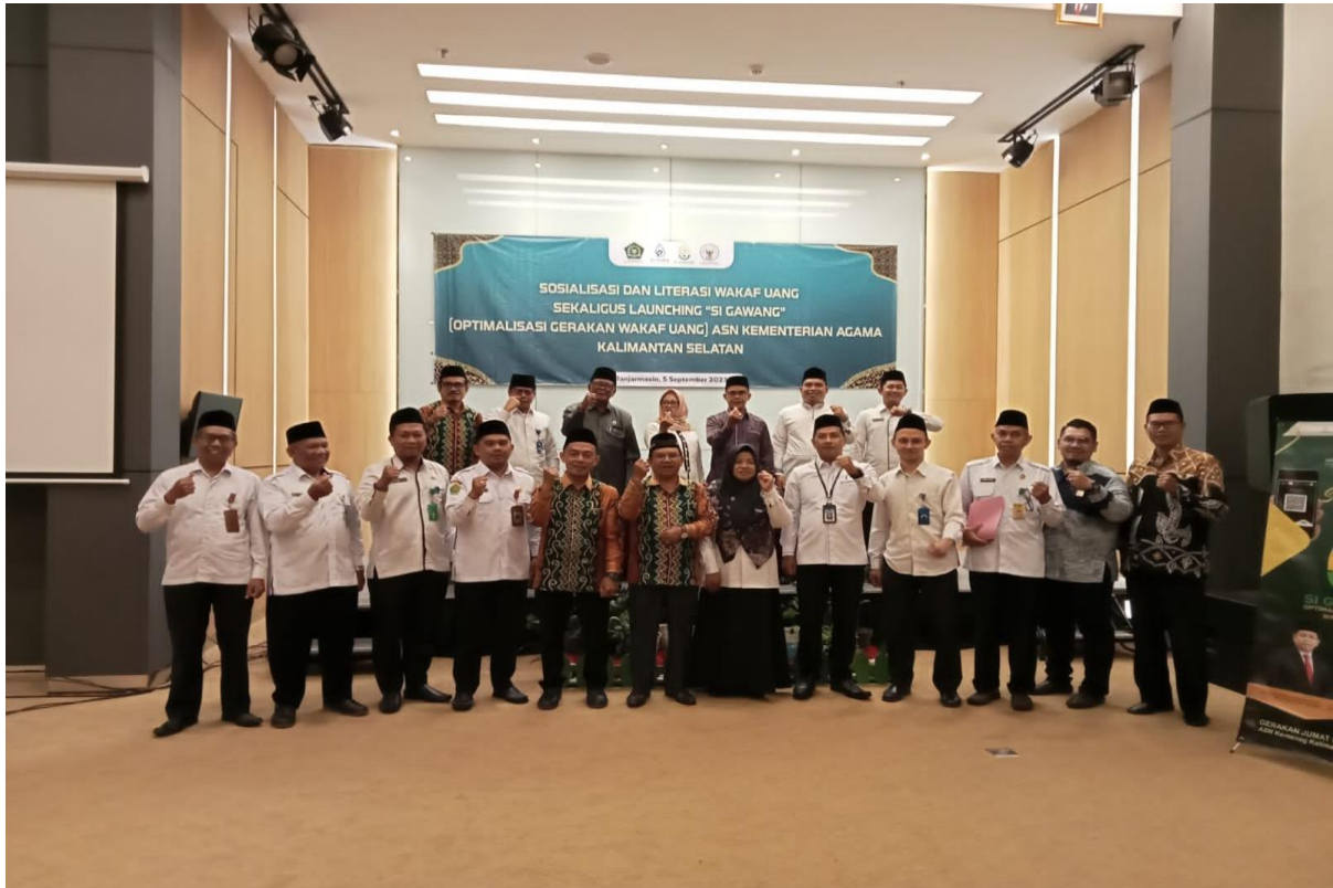
Ikut Bersama Perwakilan BWI Kalsel dalam Rangka Launching Si Gawang