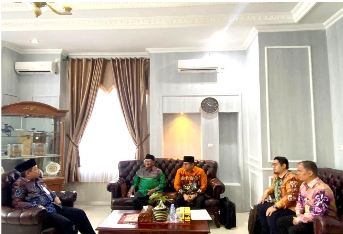
Ikut serta berkonsolidasi dengan Kakanwil Kementerian Agama Kalsel