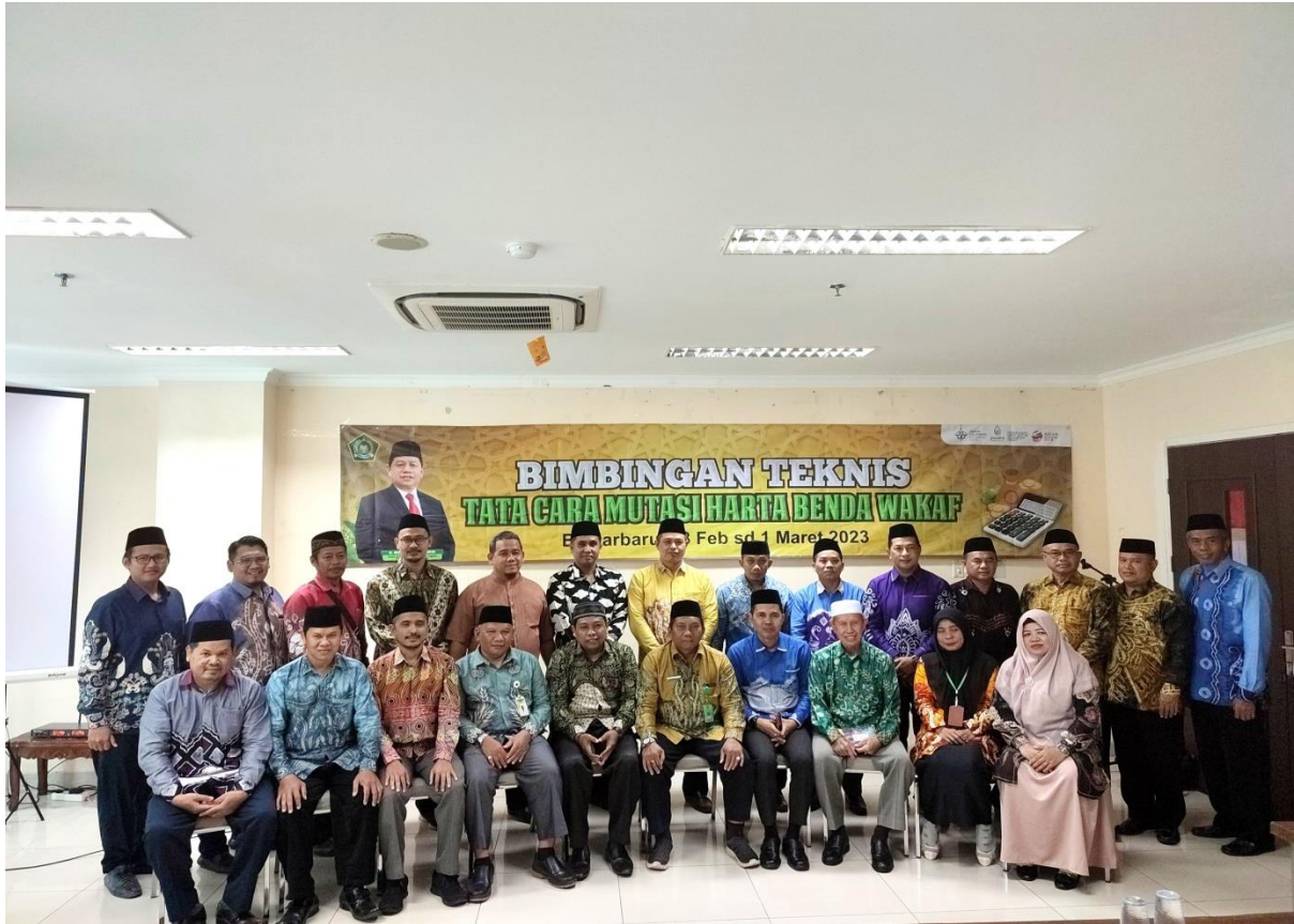
Bersama Pengurus Perwakilan BWI Kab/Kota se Kalsel