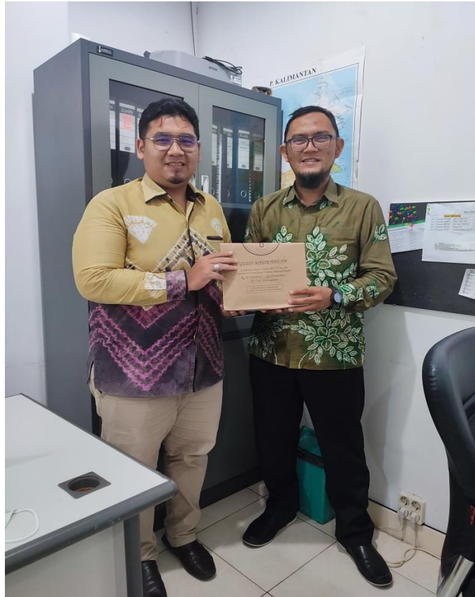
Bersama Kepala BSI Mashlahat Regional Kalimantan