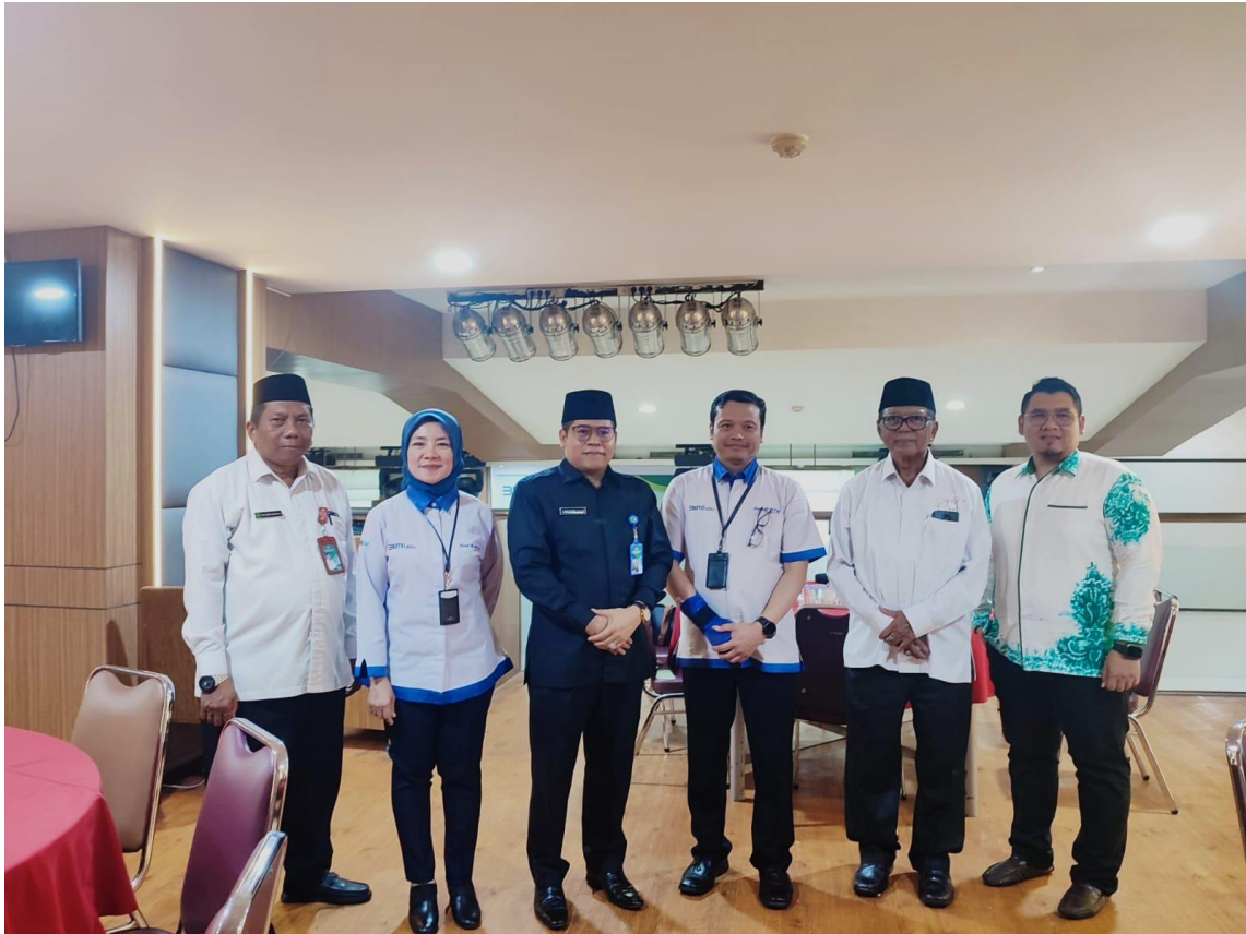
Ikut Bersama Perwakilan BWI Kalsel dengan BM BTN Syariah Banjarmasin