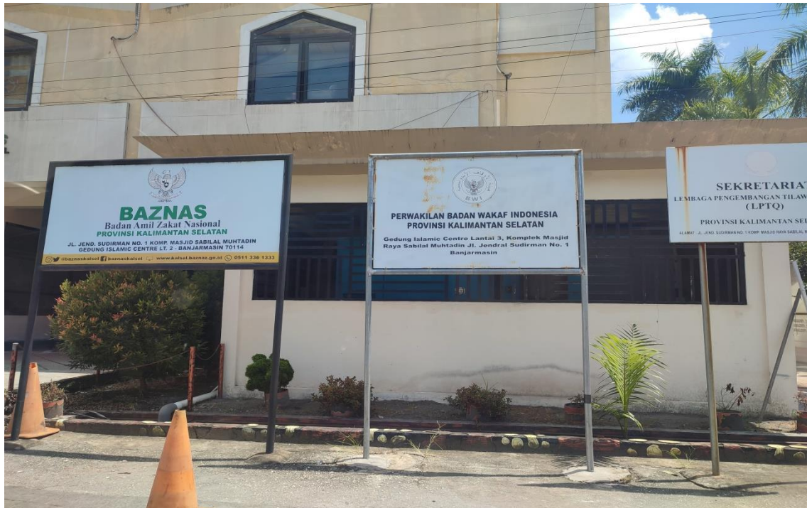
Kantor Perwakilan BWI Provinsi Kalimantan Selatan