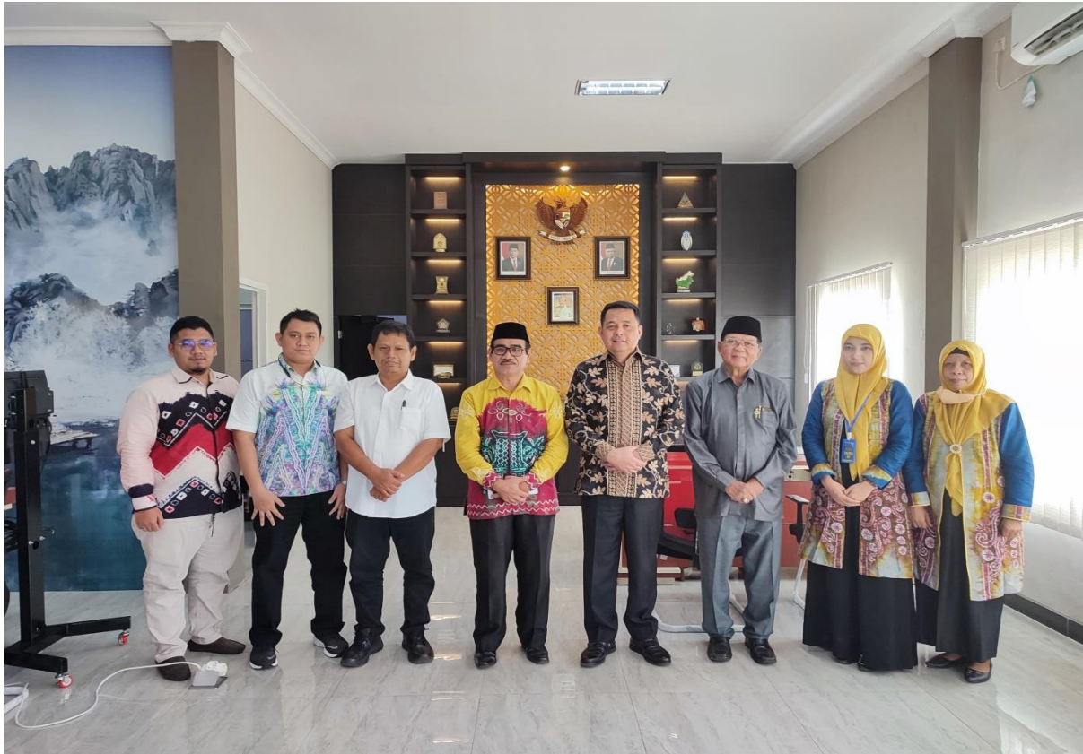
Ikut serta Koordinasi bersama Perwakilan BWI Provinsi dan Kanwil BPN Kalsel