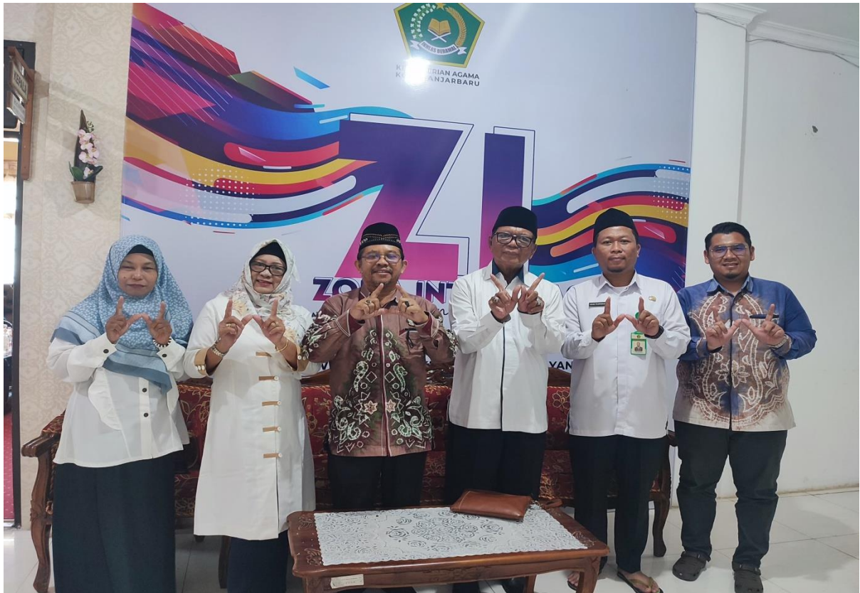
Ikut serta Koordinasi bersama Perwakilan BWI Provinsi dan Kota Banjarbaru