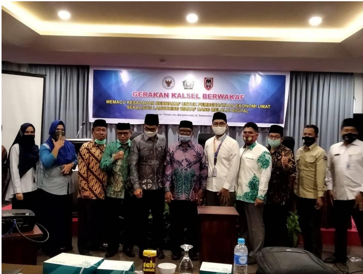
Ikut Bersama Perwakilan BWI Kalsel pada Gerakan Kalsel Berwakaf