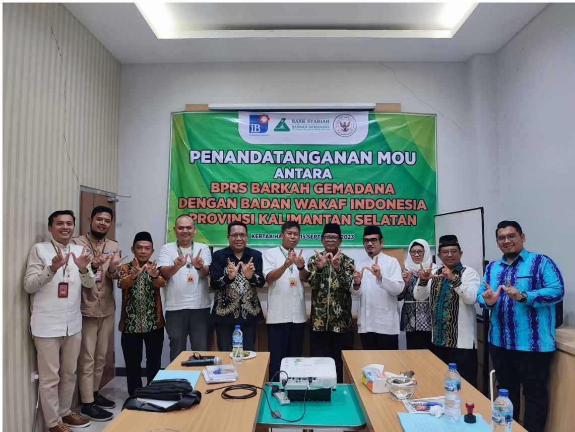
Ikut Bersama Perwakilan BWI Kalsel dengan PT. BPRS Berkah Gemadana