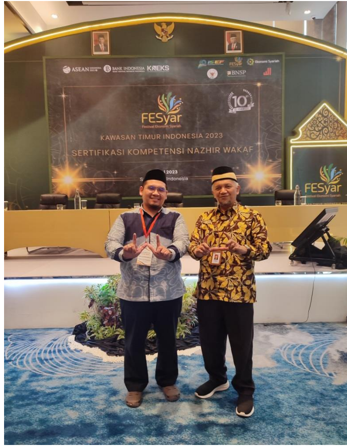
Ikut Serta Dalam Sertifikasi Kompetensi Nazhir Wakaf