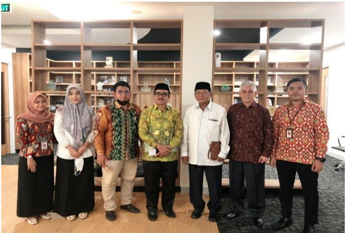
Ikut serta Koordinasi bersama Perwakilan BWI Provinsi dan OJK Kalimantan