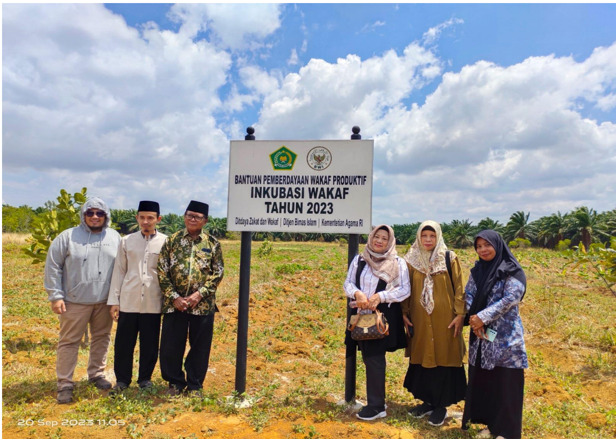
Ikut serta Koordinasi bersama Perwakilan BWI Provinsi dan Kab. Tanah Laut