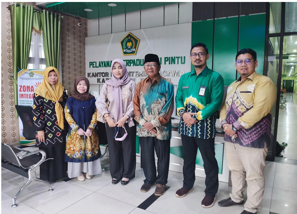
Ikut serta Koordinasi bersama Perwakilan BWI Provinsi dan Kab. Banjar