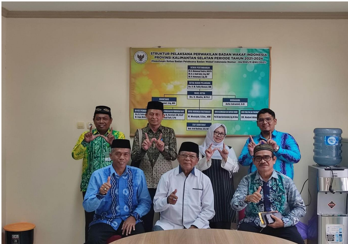
Bersama Perwakilan BWI Provinsi dan Kabupaten Tapin