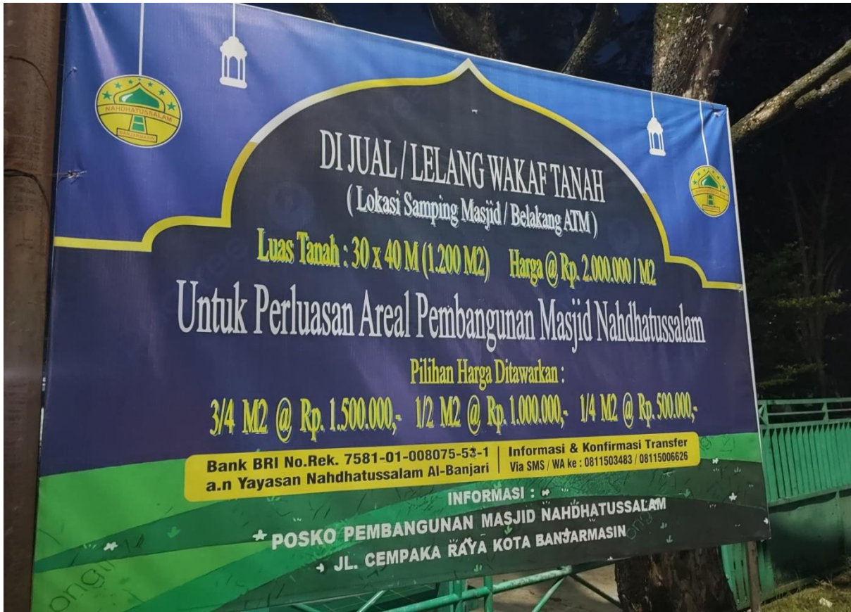
Implementasi Wakaf Uang di Masjid Nahdatussalam Banjarmasin