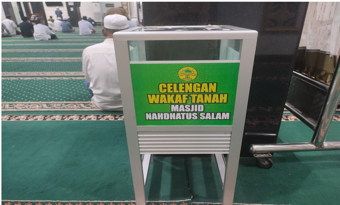
Implementasi Wakaf Uang di Masjid Nahdatussalam Banjarmasin