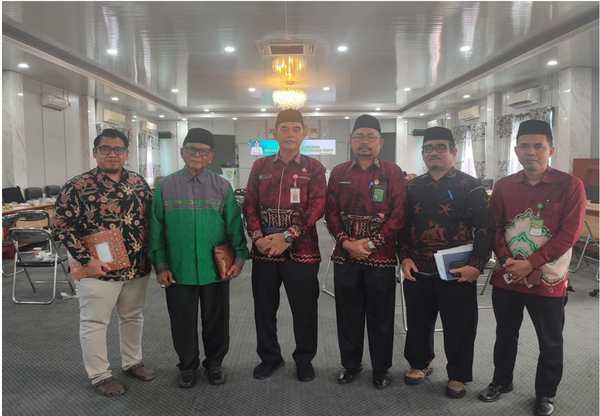
Ikut serta Koordinasi bersama Perwakilan BWI Provinsi dan Kab. Balangan