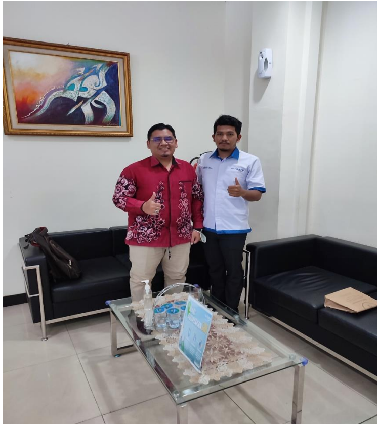
Bersama Head Funding Bank Tabungan Negara Syariah (BTNS) Banjarmasin