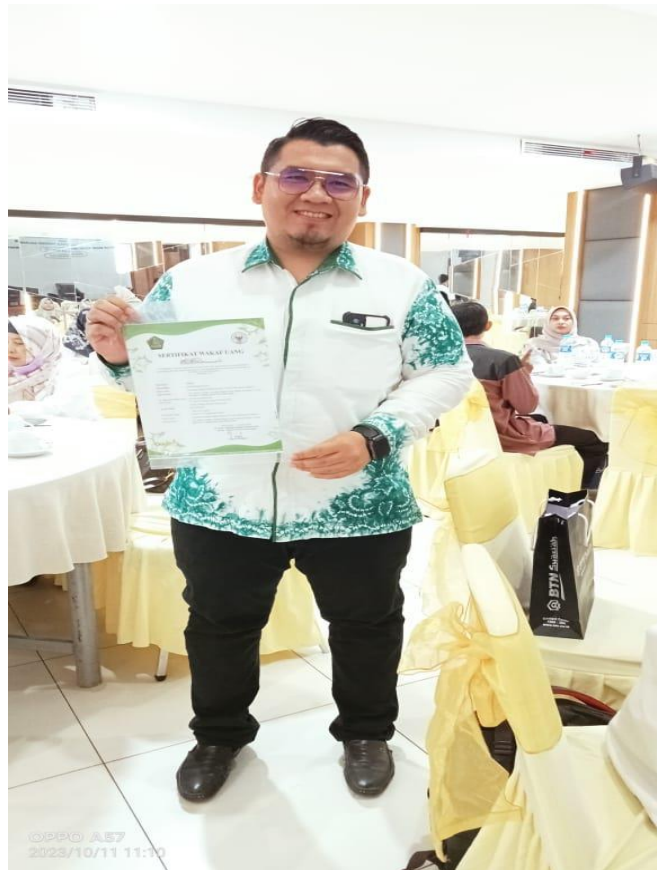
Ikut berpartisipasi Berwakaf Uang dan Mendapatkan Sertifikat Wakaf Uang