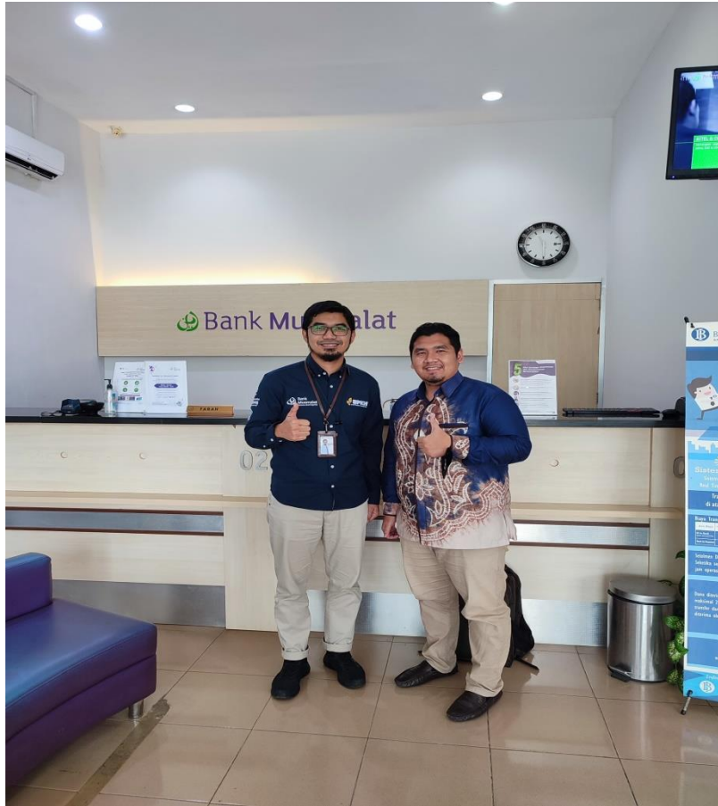
Bersama BM Bank Muamalat Indonesia Banjarmasin