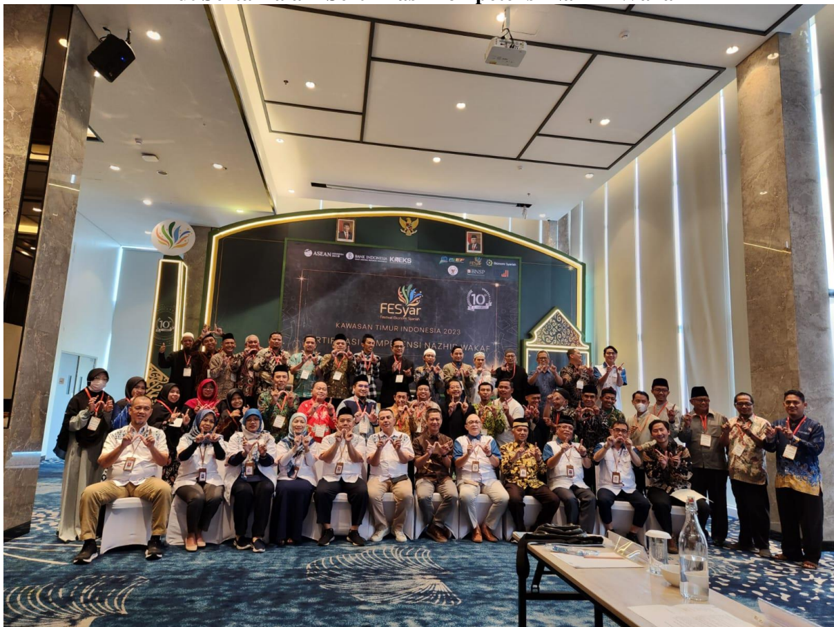
Bersama Peserta Sertifikasi Kompetensi Nazhir Wakaf