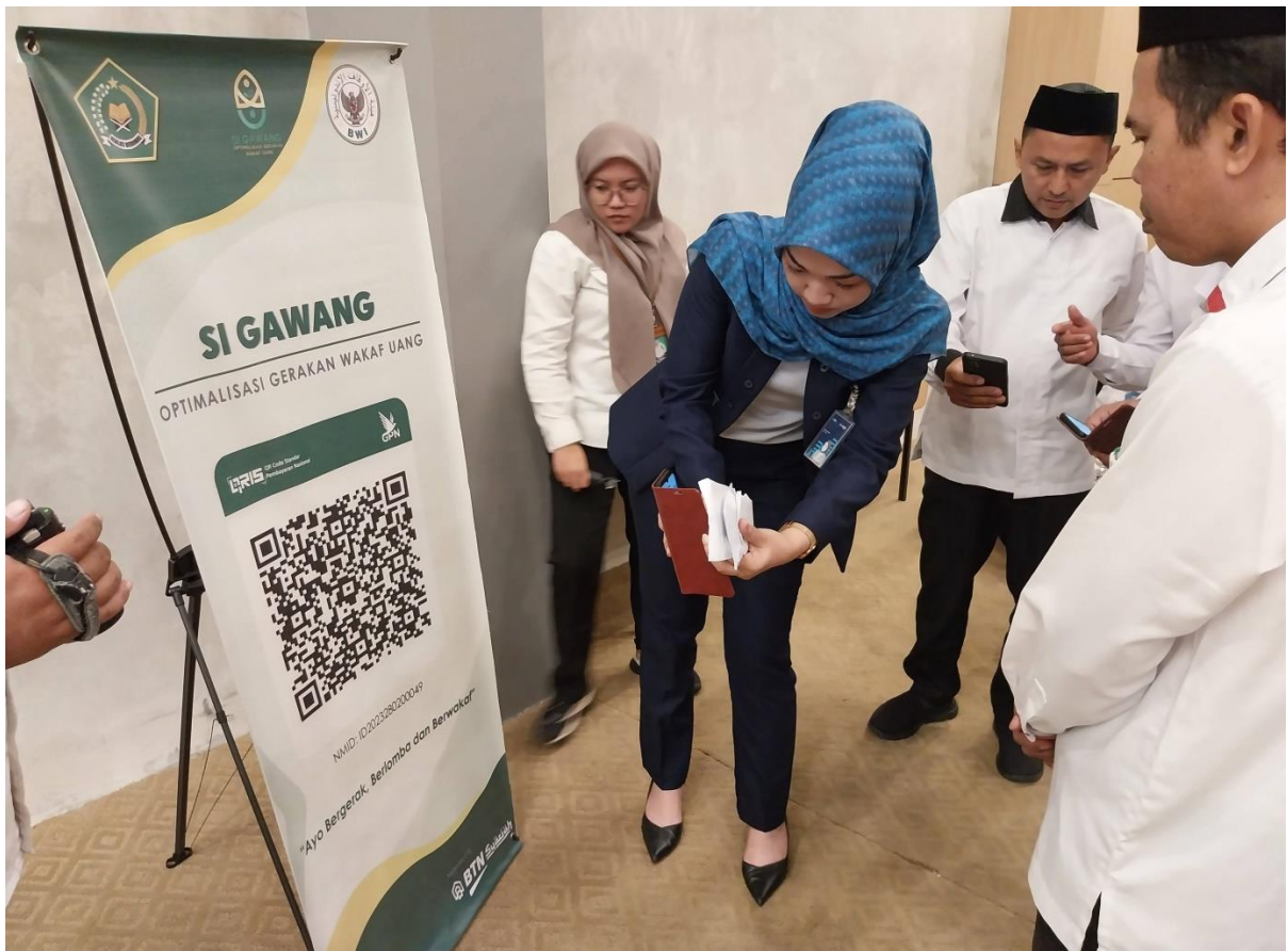
Ikut Bersama Perwakilan BWI Kalsel dalam Rangka Launching Si Gawang