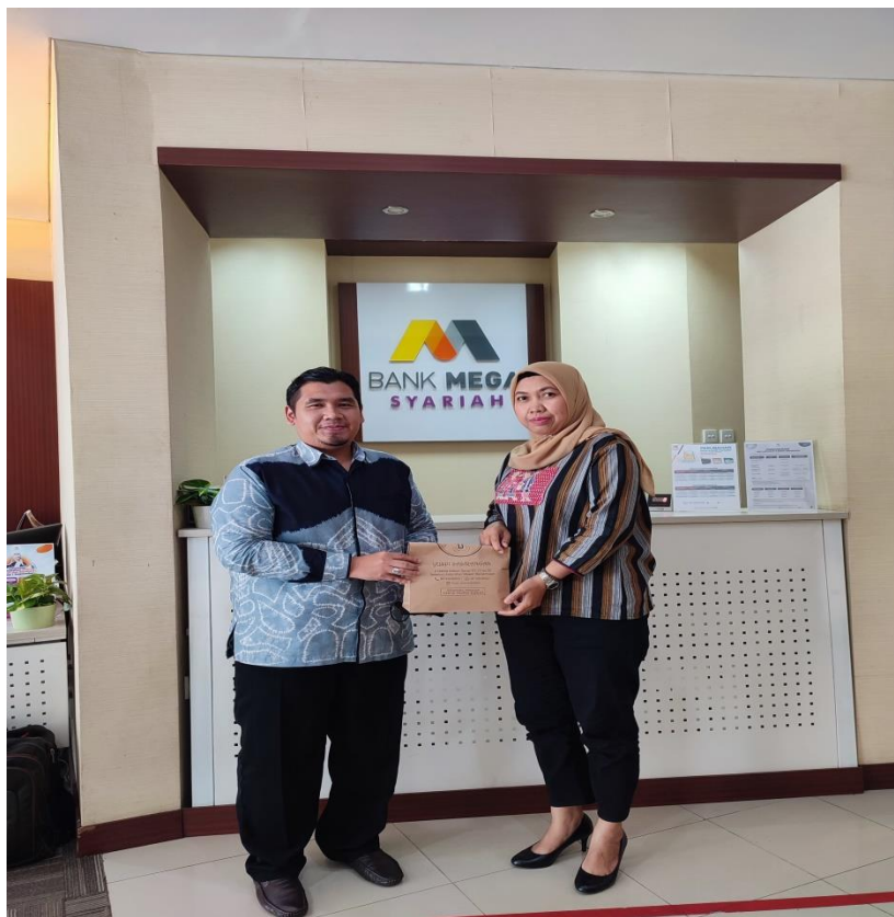
Bersama Head Operasional Bank Mega Syariah Banjarmasin