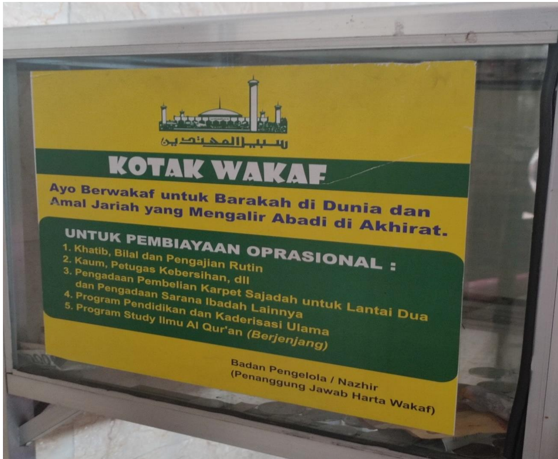
Implementasi Wakaf Uang di Masjid Raya Sabilal Muhtadin Banjarmasin