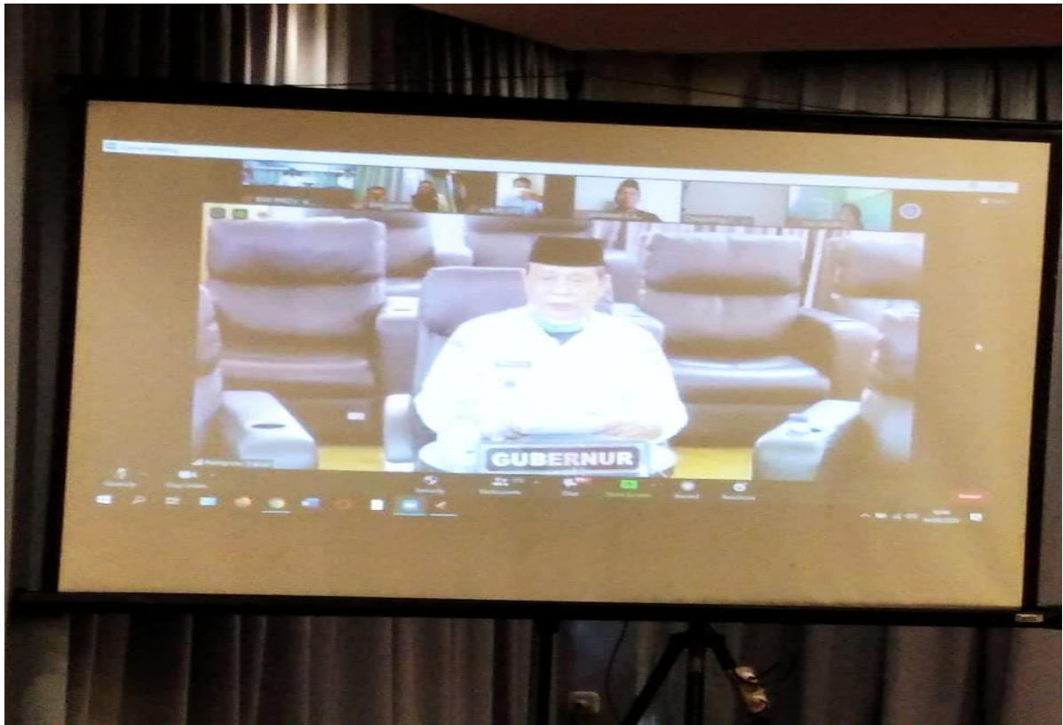
Gubernur Kalimantan Selatan Melaunching Gerakan Kassel Berwakaf