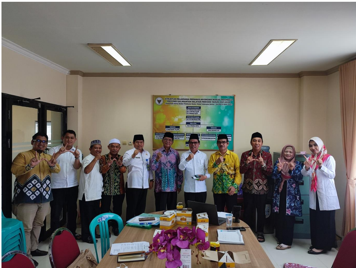
Bersama Pengurus Perwakilan BWI Prov. Kalsel