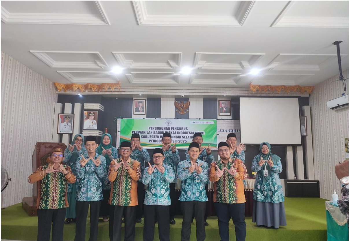
Ikut serta Koordinasi bersama Perwakilan BWI Provinsi dan Kab. HSS