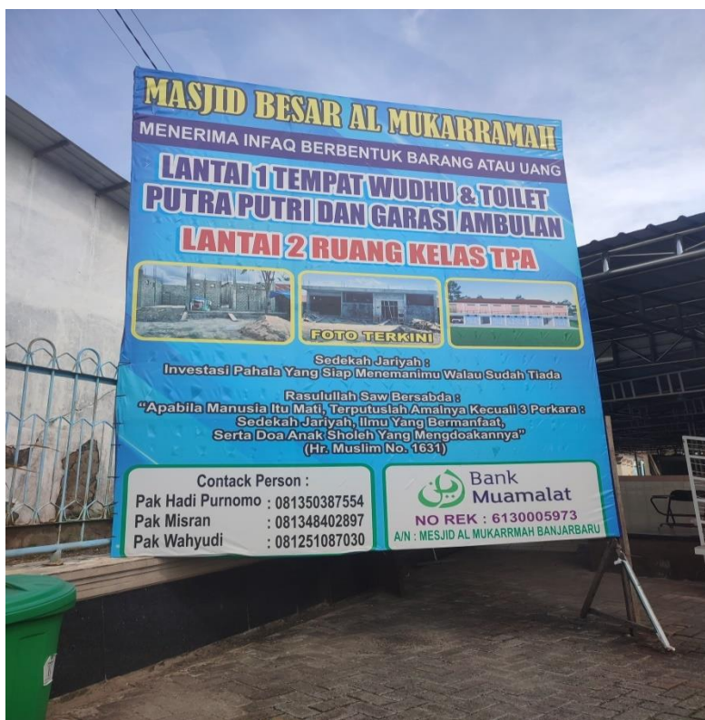
Implementasi Wakaf Uang di Masjid Besar Al Mukarramah Banjarbaru