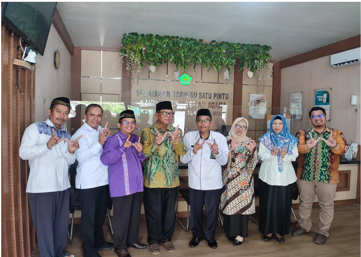
Ikut serta Koordinasi bersama Perwakilan BWI Provinsi dan Kab. HST