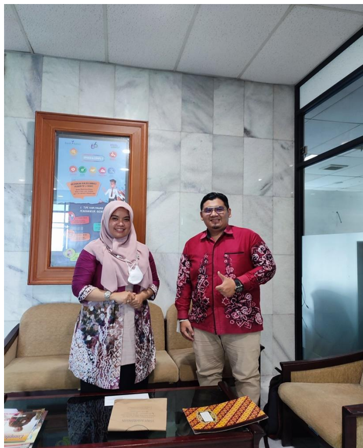
Bersama Divisi Unit Usaha Syariah (UUS) Bank Kalsel Banjarmasin