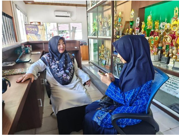
3.5 Wawancara dengan guru proyek PPRA MAN 2 Banjarmasin