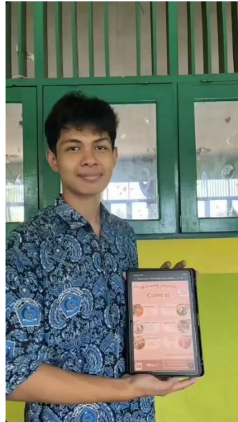
3.3 Pelaksanaan projek di MAN 3 Banjarmasin