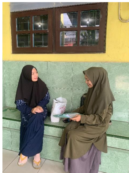
3.4 Wawancara dengan Guru projek di MAN 1 Banjarmasin