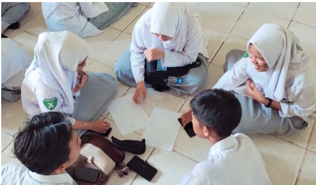
3.2 Pelaksanaan Projek Profil di MAN 2 Banjarmasin