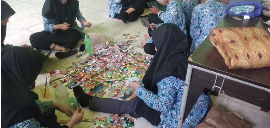
3.1 Pelaksanaan Projek Profil di MAN 1 Banjarmasin