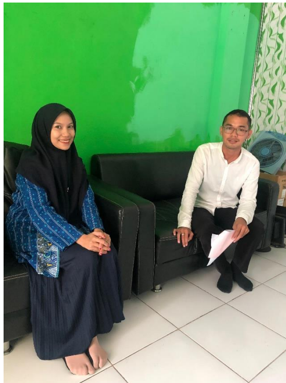
3.6 Wawancara dengan guru proyek PPRA MAN 3 Banjarmasin